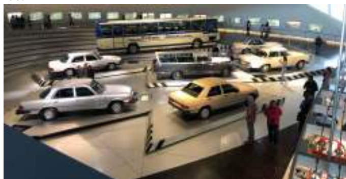
Platform med biler fra 1960erne og 1970erne, hvor der eksperimenteredes med forskellige brændstoftyper og sikkerhedssystemer.