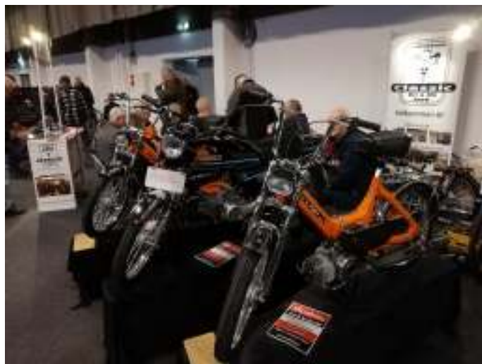
Knallerterne på standen.