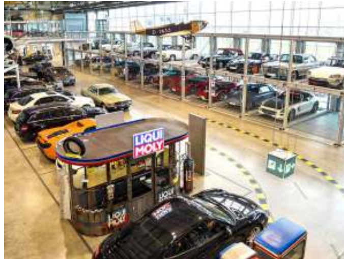
Bilerne var opmagasineret i to etager.

Udsigten fra nogle af værelserne på V8-hotellet var direkte ned til biludstillingen med masser af flotte gamle biler, fly med videre. Gik man længere ind i bygningerne, var der også mange flotte biler opmagasineret i to etager, ligesom der var klargøringsværksteder med mere.