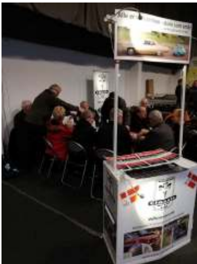
Kaffebord på standen.