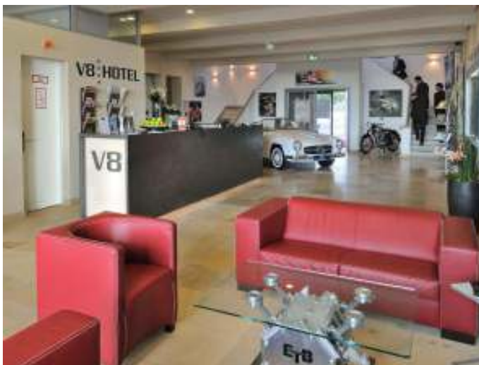
Allerede i receptionen er man ikke i tvivl om, at man er kommet på V8 hotel.

Vi havde valgt at gå "all in" med værelserne, og havde derfor valgt at booke tema værelser. Vores værelses tema var "Route 66", så vi sov i "telt", og havde blandt andet en halv motorcykel, som dekoration på værelset. Det var rigtig flot lavet af deres indretningsarkitekt. Vi havde selvfølgelig også selv klædt os efter forholdene, så vi var ved indkvarteringen begge iklædt Route 66 T-shirts, indkøbt på en rejse til USA for nogle år siden.