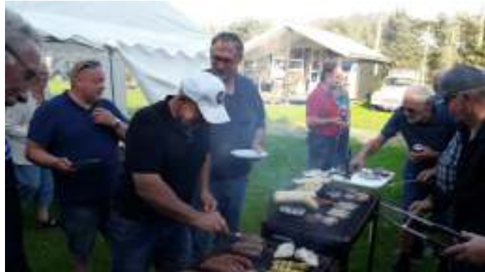
Grill torsdag aften i Grønhøj.

Der var stort fremmøde, jeg kunne næsten ikke tælle alle de mennesker. Jeg vil tro at vi var omkring 60 (vi var 69 ifølge formandens optælling), der sad og ventede spændt på filmen.