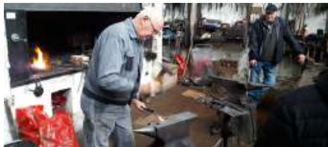
Den arbejdende smed viste først hvor hårdt det var at smede med hammer på ambolt, hvorefter han viste maskinhammeren.