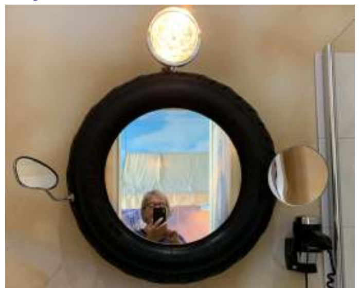
Spejlet på badeværelset var lavet af et bildæk, og havde selvfølgelig sidespejle.