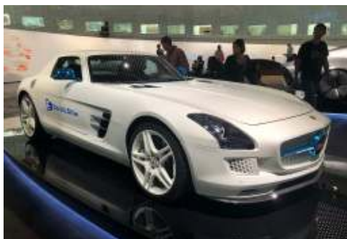
Mercedes Benz SLS AMG Coupé Elbil.