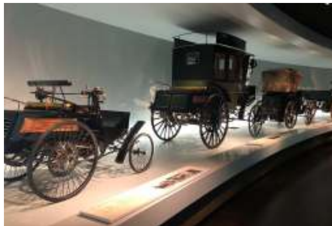
Nogle af de første Mercedes biler.

Om søndagen tog vi ind til Stuttgart centrum, fordi vi ville på Mercedes museum. Vi havde regnet ud, at vi kunne kombinere turen ud til museet med en rundtursbus, så vi samtidig kunne se lidt af Stuttgart. Der skulle være et stoppested tæt på museet, men det viste sig at være lukket, så vi måtte hele turen rundt og så lige ud til museet igen med taxa. Men rundturen var rigtig flot, og vi fik set, hvordan vinmarker faktisk ligger inde mellem huse og veje, fordi Stuttgart ligger i "et hul" med deraf følgende stejle skrænter, som ikke alle er bebygget, men i stedet for bruges til vinmarker. Og så er Stuttgart selvfølgelig også præget af, at der ligger Mercedes fabrikker med mere i området. Selv på hovedbanegården var der en Mercedes stjerne på taget.