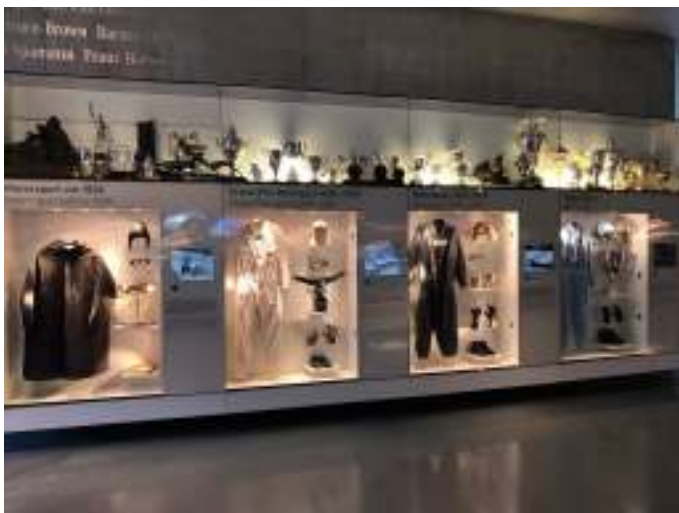
Der var også udstillet pokaler og køredragter.