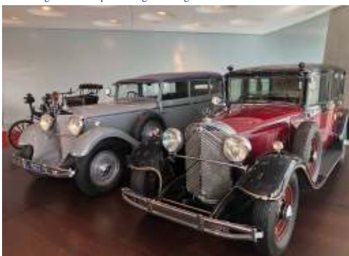
Mercedes Benz 770, Grand Mercedes cabriolet F og 770 Grand Mercedes Pullman fra 1930erne

Og så fik vi lige en tur i en simulator, hvor vi sad ved rattet, og fik fornemmelsen af at køre racerbil i nogle af historiens store racerløb, både på banen i Monaco og flere af de andre store Formel 1 baner. Det var sjovt ☺. Et besøg på museet kan absolut anbefales. Og har man rigtig god tid, og ikke kun er Mercedes freak, så ligger Porsche museet lige ved siden af, og man kan oven i købet få rabat på billetten, når man har besøgt det andet museum. Rabat gives også til "ældre" personer over 60 år. Vi var nogen, der ikke blev spurgt om alder ☺ – og så var der nogen, hvor de ikke var i tvivl om aldersklassen.