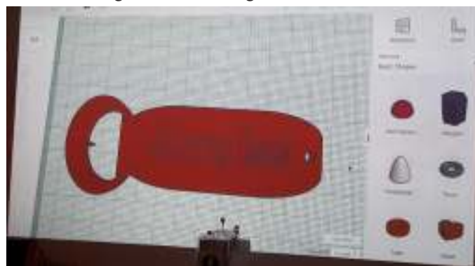
Her ses tegningen af oplukkeren.