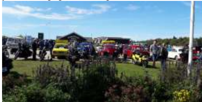
Træf lørdag eftermiddag på P-pladsen foran campingpladsen.

Filmene startede, og selv Bygholm var stille i en tid. Efter 1. halvleg, der var ca. 50 minutter, var der pause, og jeg skal så sandelig nok sige at snakken kom igang. Efter ca. 20 minutters pause kom vi igang med 2. halvleg, som varede ca. 1 time.