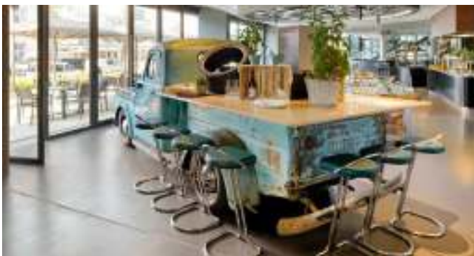
Alternativ bar i restauranten.