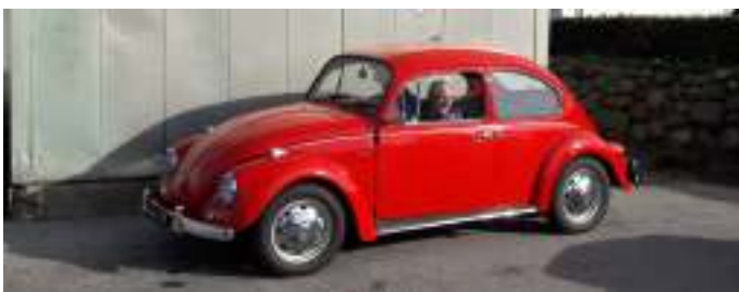
Jytte og Jørgens folkevogn, som var afsted på første tur med klubben.

Der var også tid til at beundre Jytte og Jørgens nye folkevogn.