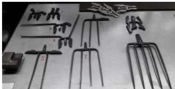
Nogle af de mange skridt, man skal igennem, når man smeder en greb.