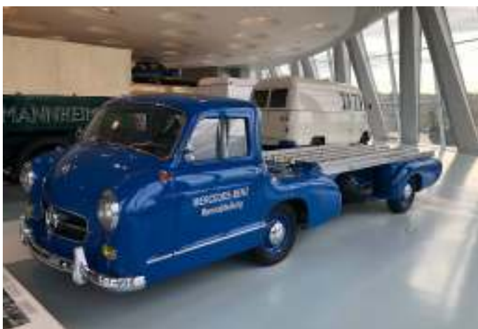
Mercedes Benz transporter - Blue Wonder fra 1955 - til transport af racerbiler.