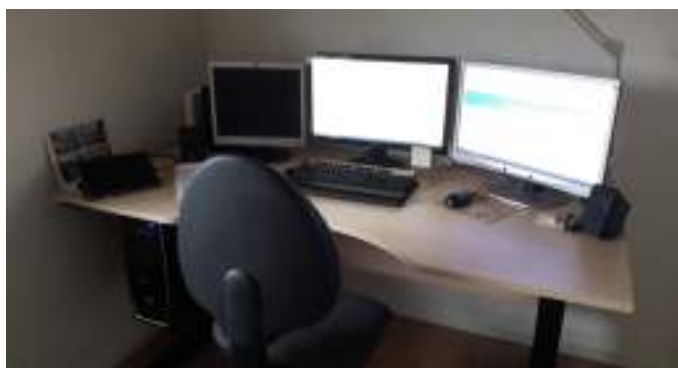
Redaktørens kontor. Det er her klubbladene bliver skabt.