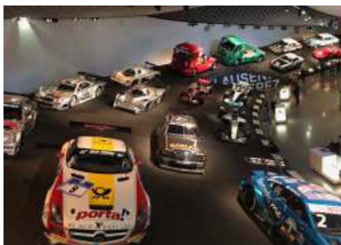
Præsentation af de berømte Mercedes racerbiler fra Silver Arrows, touring og sportsvogne, rallybiler og lastbil-racerbiler.