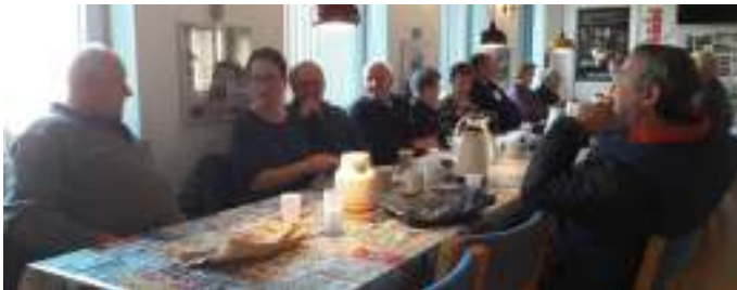
Morgenkaffe i klubhuset.

Man kunne møde op i klubhuset, og sammen spise sin medbragte morgenmad, og det var der ret mange, der benyttede sig af.