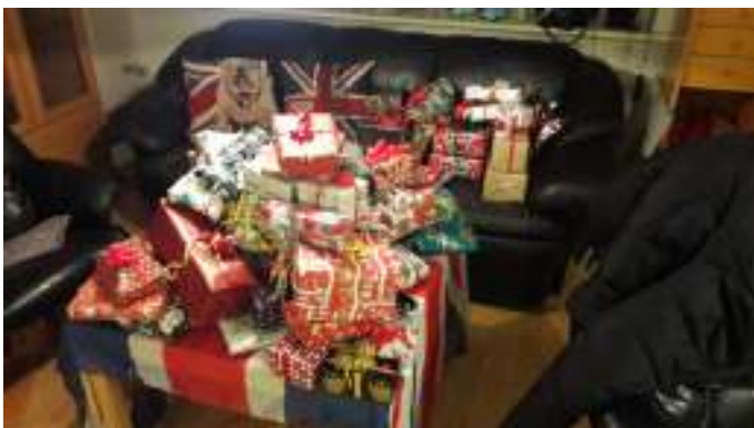
Pakkerne til pakkespillet blev afleveret på bordet i biblioteket.

Den 2. Onsdag i december, blev der traditionen tro, holdt julefrokost. De 70 pladser blev, som sædvanlig, hurtigt udsolgt, ja 38 pladser var solgt på 28 minutter. Mange af os kom i god tid, og stemningen var god. Der skulle være pakkespil efter at vi havde spist, og der var en stor bunke, meget forskellige pakker.