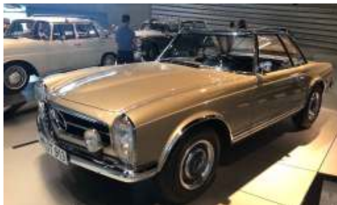
Mercedes 230SL med aftagelig hardtop, som blev produceret fra 1963 til 1967.