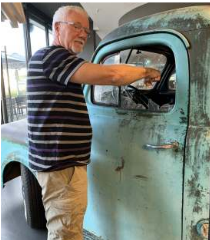
Godt at Ole ikke er sådan en "vandal", når han er på tur med Aalestrup Classic ©.