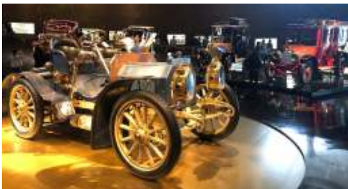
40 PS Mercedes Simplex, efterfølgeren til 35 PS, som var verdens første bil fra moderne tidsalder.