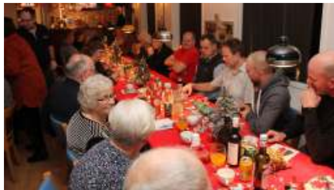
Pakkespillet er i gang, og der kæmpes for at slå seksere.

Efter uddeling af gavekurv og fiduspokal, var det blevet tid til pakkespil. Det blev grinet og hygget, mens den vilde jagt på pakkerne var i gang.