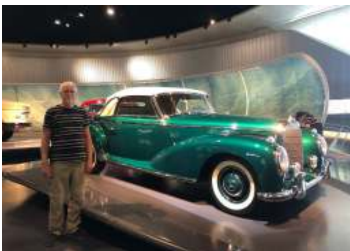
Mercedes Benz 300 S Convertible A, som der blev produceret 560 stk af fra 1951 til 1955.