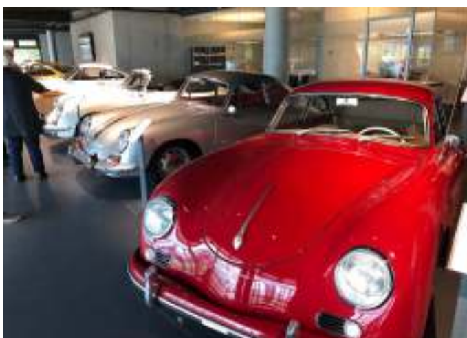
Porscher udstillet i bilforretningen ved V8 hotellet.

Og så fik vi lige en tur i en simulator, hvor vi sad ved rattet, og fik fornemmelsen af at køre racerbil i nogle af historiens store racerløb, både på banen i Monaco og flere af de andre store Formel 1 baner. Det var sjovt ☺. Et besøg på museet kan absolut anbefales. Og har man rigtig god tid, og ikke kun er Mercedes freak, så ligger Porsche museet lige ved siden af, og man kan oven i købet få rabat på billetten, når man har besøgt det andet museum. Rabat gives også til "ældre" personer over 60 år. Vi var nogen, der ikke blev spurgt om alder ☺ – og så var der nogen, hvor de ikke var i tvivl om aldersklassen.