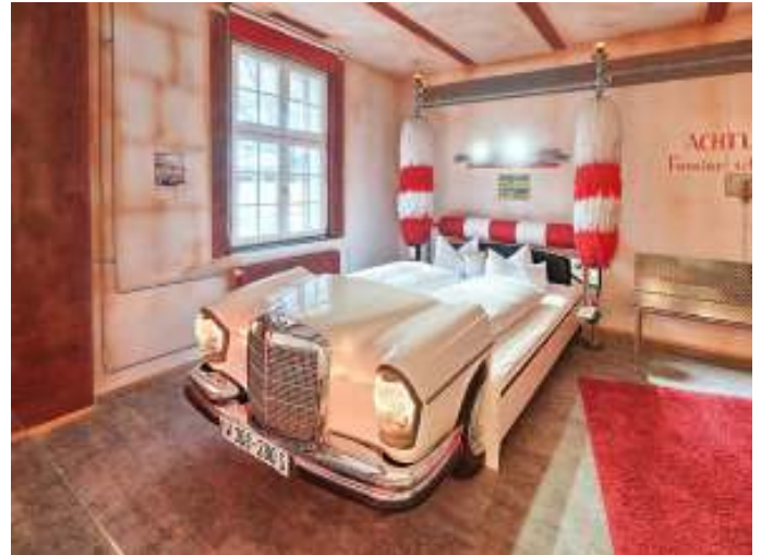
Alle værelser har en eller anden form for biltema. Her er det en Mercedes seng.

Vi havde valgt at gå "all in" med værelserne, og havde derfor valgt at booke tema værelser. Vores værelses tema var "Route 66", så vi sov i "telt", og havde blandt andet en halv motorcykel, som dekoration på værelset. Det var rigtig flot lavet af deres indretningsarkitekt. Vi havde selvfølgelig også selv klædt os efter forholdene, så vi var ved indkvarteringen begge iklædt Route 66 T-shirts, indkøbt på en rejse til USA for nogle år siden.