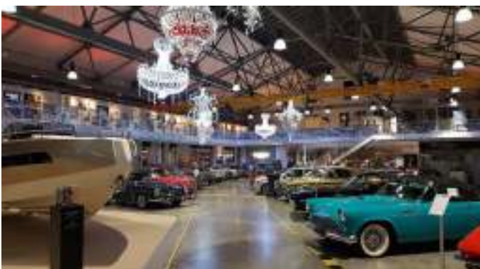
Nogle af de fine biler i udstillingen på V8 hotellet.

V8 hotellet ligger på den gamle flyplads, og de tidligere lufthavnsbygninger er omdannet til Motorworld med bilværksteder, biludstilling med mere. Lige ved siden af hotellet holder Harley-Davidson, Porsche og Ferrari til, så der var nok at se på. Den dag vi ankom (lørdag), havde Harley-Davidson åbent hus, og der var motorcykler over alt, herunder selvfølgelig også en V8 motorcykel, så vi var rundt og beundre alle de flotte maskiner. Og så indtog vi selvfølgelig også en kop øl på pladsen sammen med alle motorcykel entusiasterne.