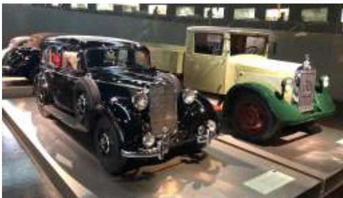
Personbilen har vi desværre ikke data på, men lastbilen er en Mercedes Benz Lo 2000 diesel lastbil med lad, som blev produceret 1932 - 1940.