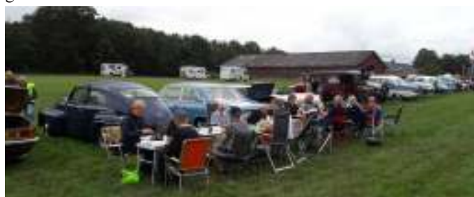
Vi lavede langbord ligesom vi plejer på Lundø.

De andre køretøjer på museet, er nogle der ligner dem, der var med. Der er altid fællessang i Grønhøj i rigtig hyggelig Morten Korch stil i en stor hyggelig pyntet lade. Tænk de havde også fået en vaskeægte bakkesangerinde til at komme forbi og give nogle numre. Det var ikke kedeligt, og der var rigtig mange gæster.