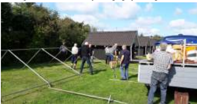
Opsætning af teltet.

Turen gik videre mod Brovst, Udholm og op efter Moseby. Vi kørte forbi Etly Klarborgs butik med nisser. Videre mod Pandrup til Saltum Kirke. Så drejede vi mod Kettrup og ind til Grønhøj Strand Camping. Vi fik vores nøgler udleveret til hytterne og afleverede kager til lørdag til træffet, som vi havde medbragt. Så var der ellers udpakning og opsætning af teltet.