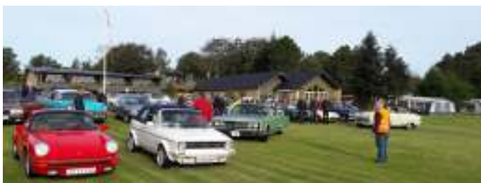
Ankomst til Lundø, hvor vi fik parkeret bilerne i to rækker.

Vi kørte omkring kl. 8:45, hvorefter vi ankom til pladsen på Lundø kl. 9. Vi var mange biler blandt andet Mercedes, Oldsmobil, Fiat, Mustang og mange andre flotte biler, som kørte i samlet trop. Der var fin plads, da vi kom til Lundø, og vi parkerede bilerne, så vi kunne sætte vores borde og stole op imellem de 2 rækker biler, så vi kunne sidde sammen og spise vores medbragte morgenmad.