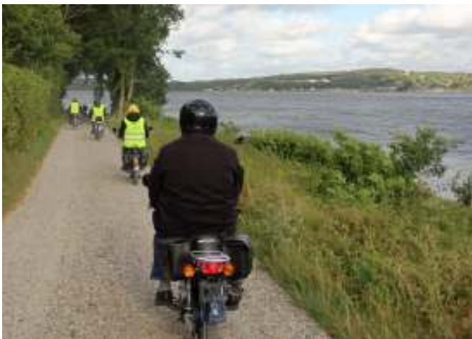
Flot tur lang fjorden.

Vi kørte til Kielstrup, videre over Karls, men før vi nåede dertil, måtte Martins knallert opgive. Jeg så det ikke selv, men har det fra et meget troværdigt øjenvidne. Knallerten stoppede. Den havde sat sig fuldstændig fast i motoren, og måtte læsses op på traileren. Godt, vi havde følgebil med. Da knallerten var læsset, kørte vi videre, forbi Låenhus, som er hjemsted for Oue-Valsgård spejderne, hvor en masse mennesker rumsterede. Jeg tror det var en spejderlejr. Der var blandt andet en campingvogn med fortelt, hvor nogen sad og hyggede sig. Vi kørte videre, ned til Høllet, forbi selvbetjeningsishuset, hvor vi dog ikke stoppede.