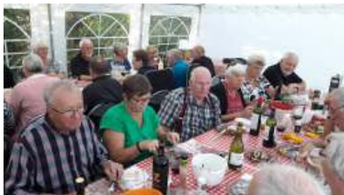
Grill og hygge i teltet om aftenen.