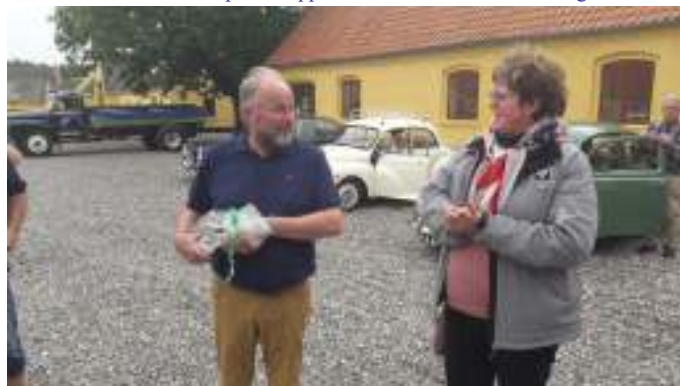
Pigalop takker for rundvisningen og overrækker et par flasker rødvin til rundviseren.