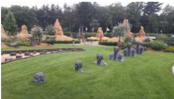
Flotte skulpturer i skulpturparken i Blokhus.

Bagefter kørte vi en tur ned til stranden og så vandet. Der var lidt bølger på vandet. Derefter kørte vi op i byen for at finde en parkeringsplads vi kunne holde på, mens vi tog en lille travetur i byen, kiggede på butikker og handlede lidt. Så fortsatte turen ellers hjemad, for at spise middagsmad i teltet, inden vi skulle over og spille krolf.