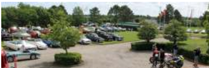
Aalestrup Classic Træf 2019.

Som de fleste af jer ved, så har vi siden 2009 holdt vores Aalestrup Classic-Træf hos Leoka på Borberggade i Aalestrup. Det har vi altid været glade og taknemlig for, at vi kunne, så mange tak til Leoka for, at vi har måtte låne deres grund til træffet.