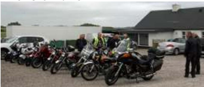
Pause ved Trend Kro. OBS: Billedet er fra en anden MC tur pga vejret.