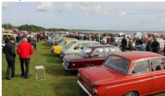
Pladsen var næsten fyldt til bristepunktet denne dag.

Vi nød det gode vejr og det gode selskab, og snakken gik lystigt, som den altid gør, når vi er samlet. I løbet af formiddagen dukkede der efterhånden flere fra klubben op i biler, på knallert eller motorcykel. Efter at have nydt vores kaffe, gik vi rundt og så på alle de flotte 4- og 2-hjulede. Der var rigtig mange flotte og specielle køretøjer, og især var der mange knallerter og motorcykler.