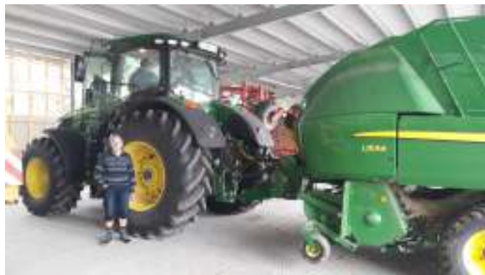
Redaktørens far ved en af de store traktorer.

De havde ikke mindre end 11 robotplæneklippere til at slå alt græsset. Rigtig flot gård og park med en spændende rundvisning.