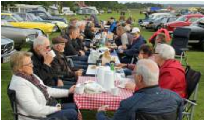
Bordene blev stillet op, så vi kunne få vores morgenkaffe.

Vi nød det gode vejr og det gode selskab, og snakken gik lystigt, som den altid gør, når vi er samlet. I løbet af formiddagen dukkede der efterhånden flere fra klubben op i biler, på knallert eller motorcykel. Efter at have nydt vores kaffe, gik vi rundt og så på alle de flotte 4- og 2-hjulede. Der var rigtig mange flotte og specielle køretøjer, og især var der mange knallerter og motorcykler.