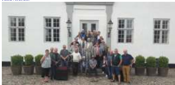
Gruppefoto foran hovedgaarden.