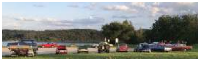
Pause ved Bramslev Bakker.