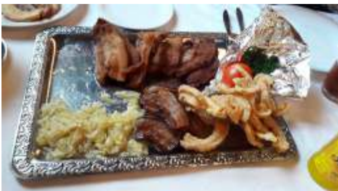
Der er altid 3 forskellige slags flæsk.

Derefter var der fælles eftermiddagskaffe med kage til i teltet. Kl. 17:45 kørte vi fra campingpladsen mod Biersted Kro, hvor vi skulle ind og have stegt flæsk med kartofler og persillesovs. Det var dejlig sprødt flæsk, og der var rigelig af det.