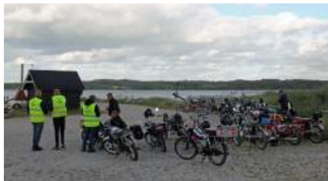
Pause ved Stinesminde fiskerleje.