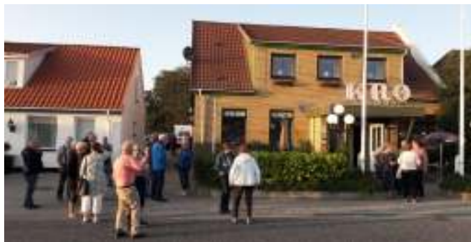
Hyggesnak foran Biersted Kro, inden vi kørte tilbage.

Vi var 28 stk fra klubben, så der var fuldt hus. Der kom flere, som også gerne ville have flæsk, men de havde ikke bestilt, så de måtte gå igen. Folk kom i flere hold, og gik ligesom de var færdige med at spise. Vi kørte fra Biersted Kro og tilbage til campingpladsen igen. Om aftenen var der kaffe og hyggesnak i teltet.