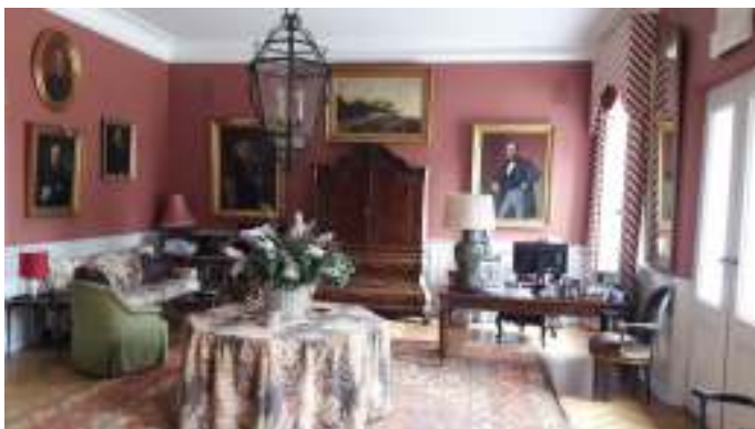
Inde i stuerne på Birkelse Hovedgaard.

Hovedbygningen ved Birkelse Hovedgaard er opført i 1555-1697, og ombygget i 1819 efter en brand, hvor der blev bygget nye længer. De nye længer er fra 1843 og 1868.