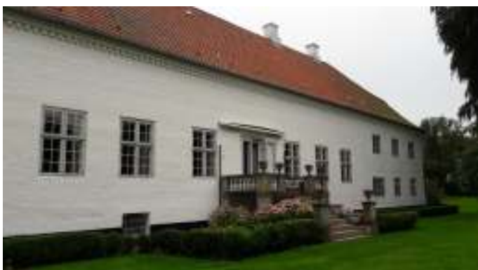
Hovedbygningen set fra parken.

Der var også en kæmpe stor park, hvor Ryå snoede sig igennem, og hvor man kunne se spor af den gamle voldgrav.