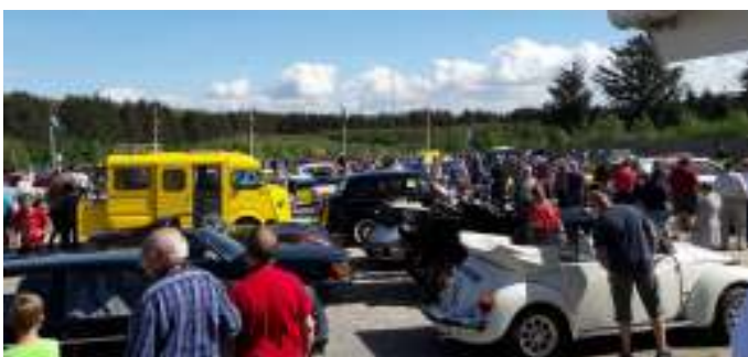
Masser af biler og mennesker til træffet.

Så gik turen ellers tilbage til campingpladsen, hvor der var træf for veteranbiler fra Aalestrup Classic og andre klubber. Der blev serveret kaffe med kage til, som deltagerne fra Aalestrup Classic havde sponsoreret.