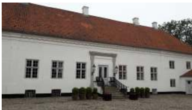
Hovedbygningen på Birkelse Hovedgaard.