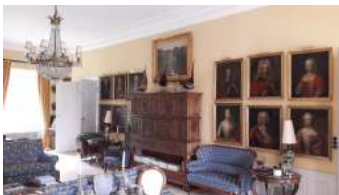
Inde i stuerne på Birkelse Hovedgaard.

Der var en, der viste os rundt i bygningerne, kæmpe stuehus i flere etager, meget gammelt, men flot.