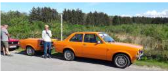
1½ kadet ☺

Hver bil skulle komme med en kage. Det plejer at være vældig hyggeligt, og i år var der fint solskin og rigtig mange mennesker. Der var ca. 65 - 70 biler, og nogle motorcykler. Alle kagerne blev spist, og kl. 15:50 var der kun 5 stykker kage tilbage. Der var omkring 200 mennesker til træffet, så det var vældig flot.