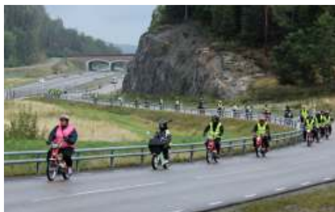
Emilie i front på vej hjem fra Trollhättan i 2019.