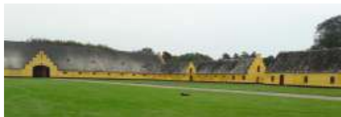
Ikke mindre end 11 robotplæneklippere skulle der til for at slå alt græsset.

De havde ikke mindre end 11 robotplæneklippere til at slå alt græsset. Rigtig flot gård og park med en spændende rundvisning.