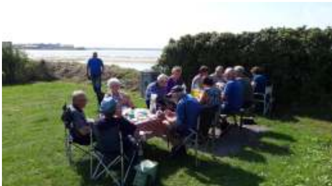
Vi sluttede turen som den startede - middagsmad ved Aggersundbroen.

Vi kørte ad Marguerit ruten fra Hune og ud til Rødhus igennem Tranum Klitplantage til Halvrømmen og Brovst. Videre af ruten til Tannerup, over Bejstrup og til Aggersundbroen, hvor vi holdt og spiste vores middagsmad.