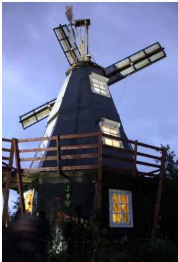
Jøn's hollandske vindmølle.

Vi kunne komme ind og se møllen, som fungerer, og laver strøm. Jøn har også en vingård i Ungarn, så der var også vinsmagning, og mulighed for at købe vin, som nogle benyttede sig af. Jøn fortalte om sit projekt med at bygge møllen. Derefter kom borde og stole frem, så vi kunne få vores medbragte kaffe og kage. Derefter gik snakken jo lystig, som altid inden vi skulle hjem efter en dejlig tur i tørvej.