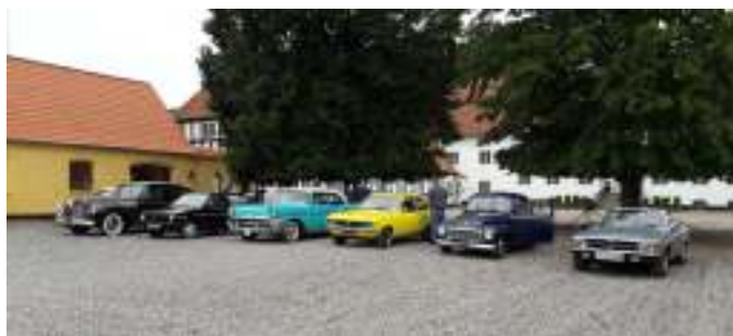
Parkering foran Birkelse Hovedgaard.

Dagen startede med morgenkaffe og rundstykker i teltet, og så skulle vi ellers være klar til at køre kl. 9:45. Vi skulle ud og se Birkelse Hovedgaard, som ligger ved Fristrup.