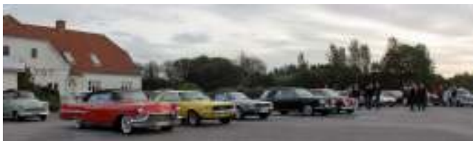
Vi mødtes i Sundstrup inden fælleskørsel mod Lundø.

Lørdag den 14. september, var der Lundø Classic Motorshow. Det var som sædvanlig Krumtapperne, der afholdt træffet, som er en årlig tilbagevendende begivenhed. Træffet tiltrækker både mange biler, lastbiler, motorcykler og knallerter. I år var der rekord mange køretøjer, da der var omkring 900, fordelt på de forskellige 4- og 2-hjulede. De andre år har der være omkring 600, så der var godt fyldt op på pladsen. Der var også mange, der kom for at beundre køretøjerne, så p-pladsen for gæsterne, var også fyldt op. Vi var 23 biler og 10 knallerter, der mødtes i Sundstrup.