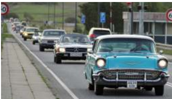
Fælleskørsel mod Lundø.

Vi kørte omkring kl. 8:45, hvorefter vi ankom til pladsen på Lundø kl. 9. Vi var mange biler blandt andet Mercedes, Oldsmobil, Fiat, Mustang og mange andre flotte biler, som kørte i samlet trop. Der var fin plads, da vi kom til Lundø, og vi parkerede bilerne, så vi kunne sætte vores borde og stole op imellem de 2 rækker biler, så vi kunne sidde sammen og spise vores medbragte morgenmad.