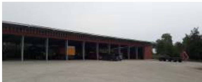
Det nybyggede maskinhus.

Der er derfor også brug for en ordentlig maskinpark, som vi også var ovre for at se.