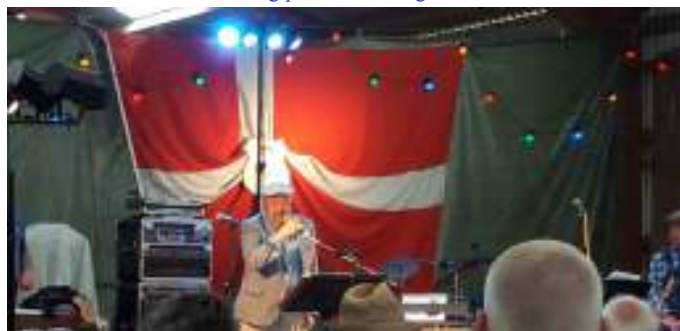
Morten Korch's barnebarn.

De andre køretøjer på museet, er nogle der ligner dem, der var med. Der er altid fællessang i Grønhøj i rigtig hyggelig Morten Korch stil i en stor hyggelig pyntet lade. Tænk de havde også fået en vaskeægte bakkesangerinde til at komme forbi og give nogle numre. Det var ikke kedeligt, og der var rigtig mange gæster.