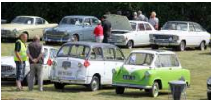
Fiat Multipla og Zündap Janus til Aalestrup Classic Træf for et par år siden.

Grunden til at vi nu har besluttet at flytte vores træf til Pinsedag er, at vi har fået en henvendelse fra Knaberfesten. De vil gerne om vi kunne flytte vores træf ud til byfesten i Aalestrup - Knaberfesten - om søndagen. Det overvejede vi en tid og besluttede så på forrige bestyrelsesmøde, at det ville vi gerne prøve. Vi får hele pladsen bag Aalestrup Idrætscenter til vores rådighed. Det er en større plads vi får, og der er flere muligheder for at vores gæster kan gå rundt og se noget.