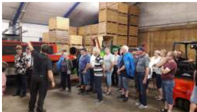
Der fortælles om, hvordan man sorterer og lagrer kartofler, så de ikke rådner.