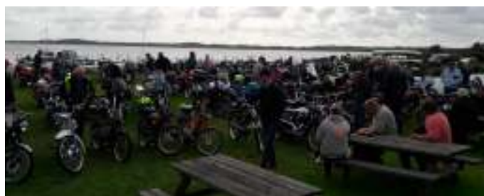
Der var også mange motorcykler og knallerter på Lundø.

Det er blevet meget populært at køre veteranknallert, hvilket også kan ses i det stigende antal medlemmer, der kører med på 50cc turene. Flere bilklubber var repræsenteret blandt andet Historisk Opel Klub Danmark og 2 CV klubben, og selvfølgelig var der også en del amerikanere. Værtsparet fra Krumtapperne Lone og Lasse Nystrøm havde, som altid, en del biler med, og i år, havde de også hentet en Bobby fra England.