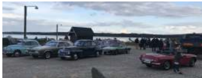
Pause i Stinesminde.