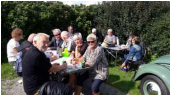
Middagsmad ved Aggersundbroen.

Vi kørte fra Aalestrup kl. 10:50, og tog turen ad små veje op til Aggersund. Vi kørte over Farsø mod Fredbjerg, Hyllebjergh, Overlade, Vilsted, Vindblæs, Løgstør og nåede så til Aggersundbroen. Der var 12 biler og ca. 25 mennesker. Vi nød vores madpakke, og hyggede os lidt, inden vi kørte videre.