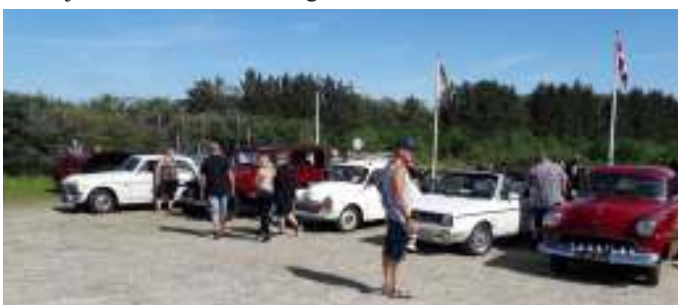
Træf på p-pladsen foran campingpladsen.

Vi sad udenfor og spiste vores medbragte mad. Der var dejlig solskin, og inden vi kørte derfra, fik vi nogle Vildmose kartofler med hjem, som vi skulle smage.