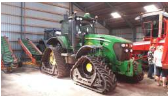
Vildmosekartoflen I/S havde også store maskiner.

Vi sad udenfor og spiste vores medbragte mad. Der var dejlig solskin, og inden vi kørte derfra, fik vi nogle Vildmose kartofler med hjem, som vi skulle smage.