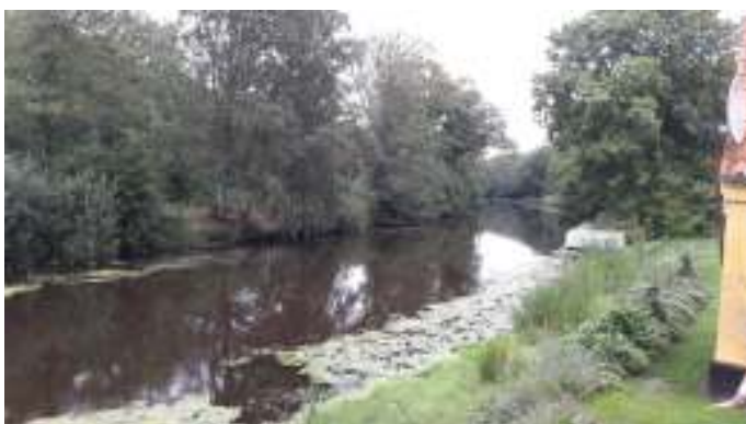
Ryå snor sig gennem parken.

Der var også en kæmpe stor park, hvor Ryå snoede sig igennem, og hvor man kunne se spor af den gamle voldgrav.