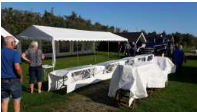
Nedtagning af teltet.

Vi stod op til dejlig solskin og nød morgenkaffen i teltet. Derefter skulle der tørres telt og pakkes, hytterne skulle gøres rene, og der skulle afleveres nøgler. Nogle biler skulle tørres for dug, inden vi kørte fra Grønhøj.