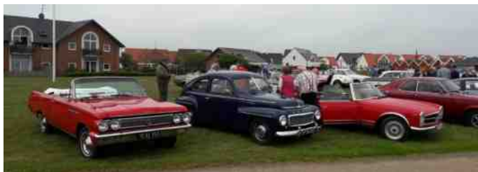
Formiddagskaffe i Glyngøre.

Vi var 23 biler, så det var et flot syn, da vi kørte op ad bakken lige efter færgen. Turen gik nu over Salling og ind til Glyngøre, hvor vi slog os ned på plænen ved havnen. Der var hurtigt linet op med borde og stole, og mange nød deres formiddagskaffe.