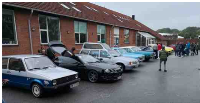
Nogle af de fremmødte biler til udstilling i forbindelse med bilboksning.