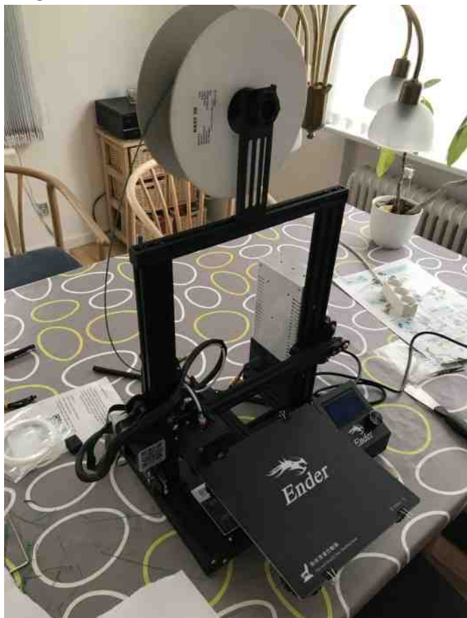
Sørens 3D printer.

Okay, det lykkes ikke første gang at ramme størrelsen, men det blev nu ganske fint. Fik hjælp af en kammerat, som printede hjælpeværktøjet, men tænkte straks, at jeg måtte have sådan en. Nogen gange skal man jo bare handle, så nu har jeg også sådan en 3D printer. Hvad jeg så skal bruge den til? Tjaa, det ved jeg ikke endnu, jeg skal først lære at tegne det, der skal printes ☺.