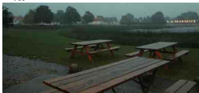
Uvejret rasede, men der var heldigvis tørvejlr i pavillionen.

Som underholdning havde de oven i købet arrangeret det helt store lys- og lydshow i form af lyn og torden. Det bragede løs udenfor, og der var de flotteste lyn, der spejlede sig i søen, men vi hyggede os bare indenfor.