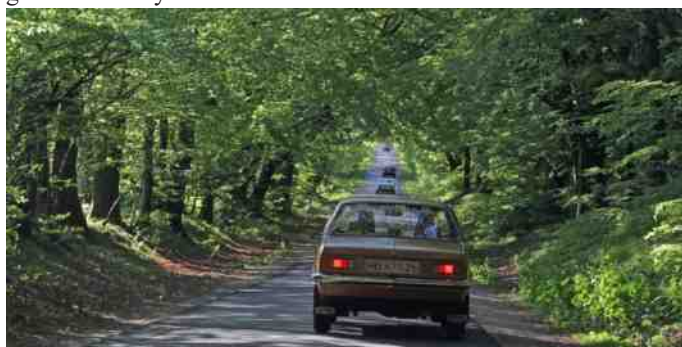
Træerne dannede nærmest en tunnel.