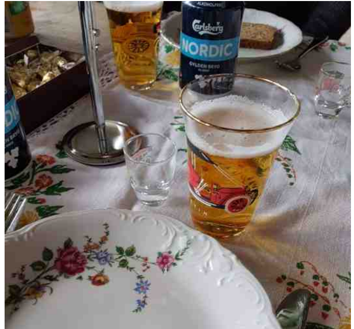
Pia og Pia havde det fine stel med i dagens anledning.

Vi sadlede op igen, og kørte videre til Klostermølle. En rigtig flot gammel vandmølle. Der holdt vi en god pause, da vi kunne sidde inde i læ, og der var rigtig meget at se ved møllen.