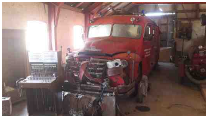
Brandbil og telefoncentralen fra filmen "Der brænder en ild".

Allerede inden middag var plænen godt fyldt op med veterankøretøjer. De to veteranmadammer var klædt i rigtig Morten Korch stil med kjoler, forklæde og tørklæde om hovedet. På stedet er der også et Morten Korch Museum, som blev indviet i 2013 i kroens staldbygninger. Det er Danmarks eneste Morten Korch Museum med ting fra de forskellige film. Kromanden har i samarbejde med Morten Korch's efterladte samlet effekter til museet: