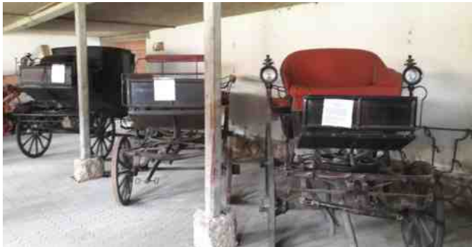
Nogle af hestekøretøjerne.

Der er også et landbrugsmuseum i den gamle lade, som også er en del af museet. Det består af mange ting fra dengang heste var trækraft. Der var mange hestekøretøjer, en gammel kane, mange forskellige høstmaskiner, en kartoffeloptager og mange andre redskaber.