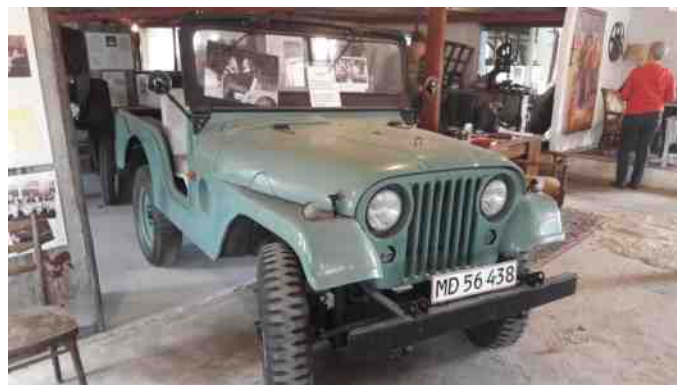
Den grønne Jeep fra filmen "Flintesønnerne".

Fra denne film kunne blandt andet ses den grønne Jeep, som sønnerne kørte til marked i sammen med Karen.