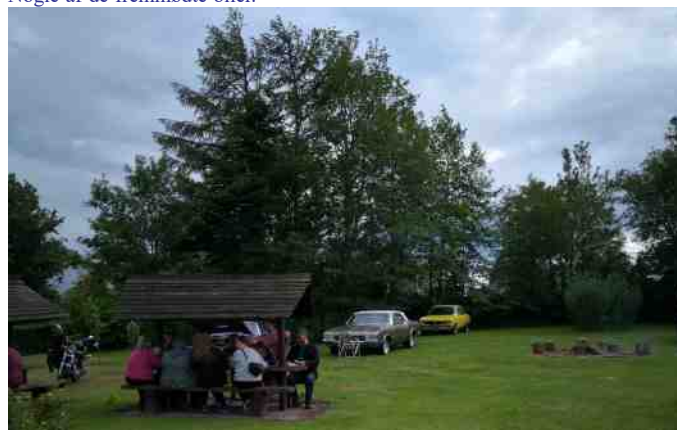
Hygge ved de overdækkede borde.