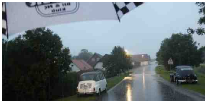
Bygholm havde ikke held af at forsøge at sælge Aalestrup Classic paraplyer til 400 kr. stk.

Måske blev vi lidt våde, da vi til slut skulle ud i bilerne igen, for ingen ville købe en Aalestrup Classic paraply for de 400 kr., som Bygholm tilbød dem til, men pyt - vi havde haft en rigtig flot og hyggelig tur, så hvem brokker sig over en smule regn ☺ Tak for turen til Martin og Else.