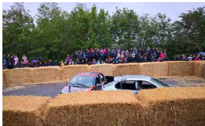
Så er der gang i bilboksningen.