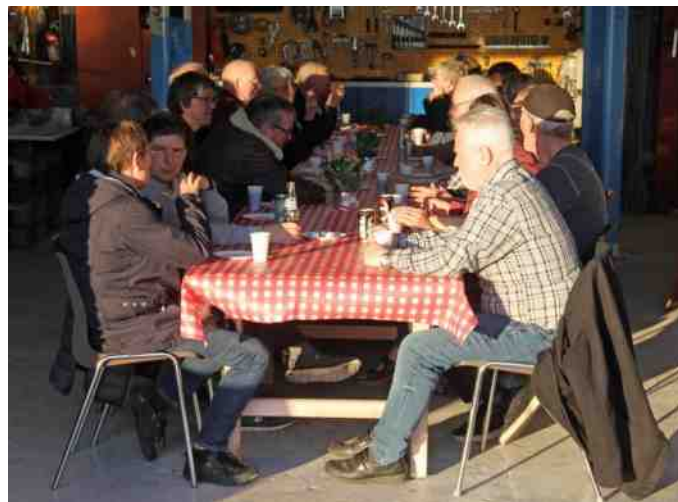
Tid til hyggesnak på værkstedet.

Turen gik nu tilbage til Ravnkilde, gennem Arden og Rold, hvor vi passerede cirkus museet. Turen var ca. 43 km, hvilket var meget passende, for så havde vi god tid til at hygge os begeter. Tilbage på værkstedet, var der dækket op med kaffe, kringle og "kys".