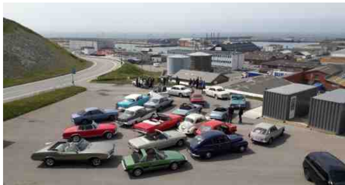
Pause ved udsigtspunktet i Hanstholm, hvor vi kunne se byggeriet af den nye havn.

Så blev der sadlet op igen, og retningen blev sat mod Hanstholm ad den smukke klitvej med den mest smukke natur, klitter, marhalm og det smukke Vesterhav. Da vi kom til Hanstholm kørte vi op til udsigtspunktet, hvor vi kunne se hvor meget, der bliver bygget i forbindelse med den nye havn.