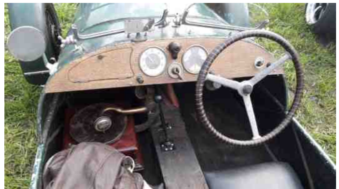
Man må håber at denne bil er godt affjedret, hvis der skal høres musik under kørslen ☺.

Vi var en 10-12 stykker fra Aalestrup Classic Bil og MC Klub på trods af, at vi ikke havde arrangeret fælles kørsel, eller aftalt noget på forhånd.