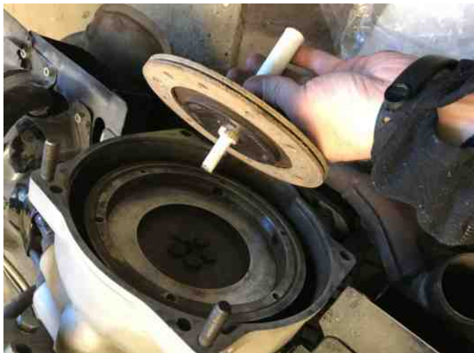
Justering af kobling med 3D printet aksel.

Jeg skulle have en ny kobling i min BMW 600 fra 1959, men manglede en ekstra aksel til at få den justeret rigtigt med. Løsningen blev et 3D print, så jeg kunne få centreret koblingen.