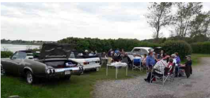
Eftermiddagskaffe ved Aggersundbroen.

Så blev der opbrud igen, og så skulle vi hjemad. På Vejlerne blev der gjort stop igen og udsigten blev rigtig nydt. Efter opholdet gik turen øst på gennem Gøttrup, igen ad de små hyggelige veje.