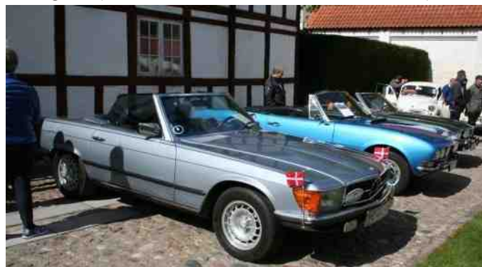
Ulla og Oles Mercedes Benz SL 450 fra 1974.

Ulla og Ole (Bil nr. 43 - Mercedes Benz SL 450 fra 1974)