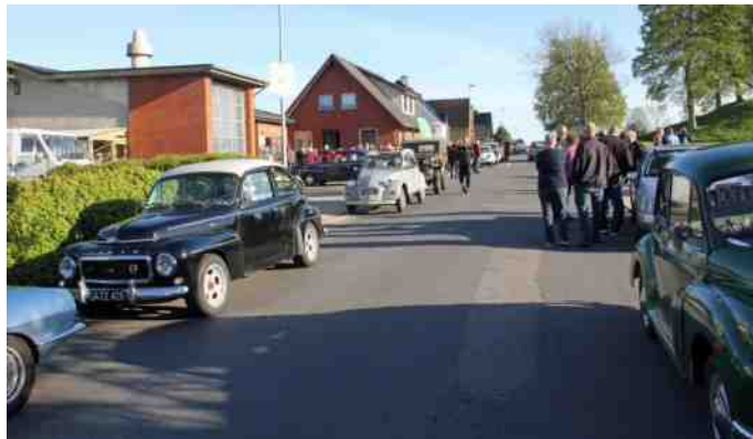
Der var brug for parkering i begge sider af vejen i Ravnkilde denne aften.

Onsdag den 15. Maj, kom endelig dagen, hvor bilerne skulle luftes. I løbet af dagen forsvandt skyerne, det klarede op, og vi kørte turen i det skønneste solskin. Der var god tilslutning. Vi var 30 biler, fordelt på mange forskellige mærker.