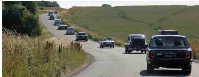
25 biler var med på køretur denne aften.

Jeg vil gerne takke alle for en fantastisk aften, med 25 biler på en vellykket tur. Vi var på en lille køretur ud ad Markedsdalen til Østerbølle videre mod Vesterbølle, og ud over Møllevejen til Lerkenfeld og videre mod Farsø.