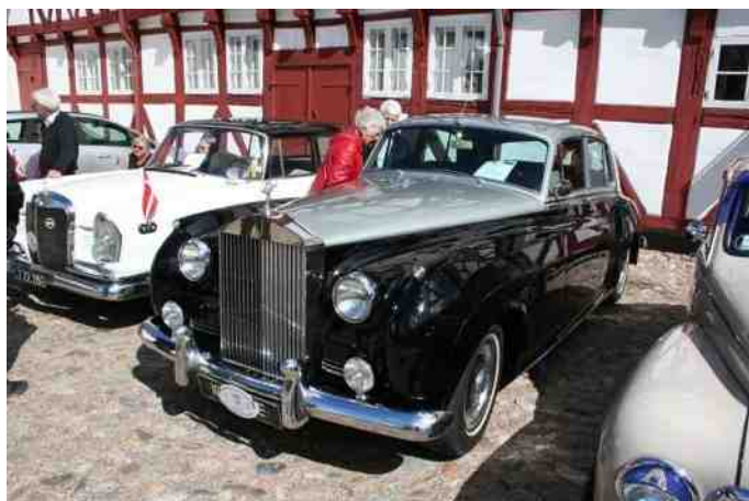
Lindhardts Krone 1.

Herefter gik turen i kortege til Aalborghus Slot. Der blev vinket og kigget interesseret fra tilskuere langs ruten, og enkelte fik lige et dronningevink fra standins i Lindhardts Krone 1.