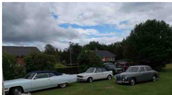
Nogle af de fremmødte biler.