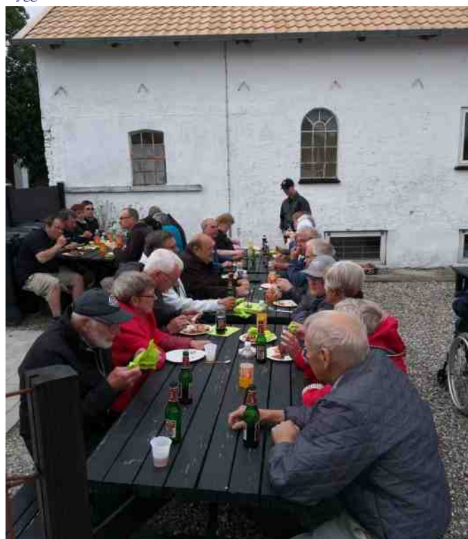
Den helstegte gris med nydt med velbehag.