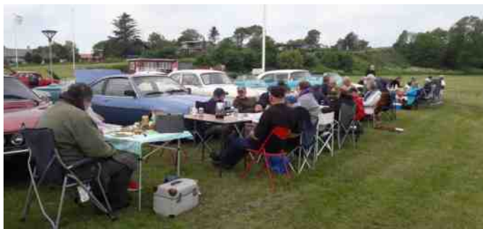
Middagsmad ved Vildsund Strandhotel.

Efter 3/4 times tid gik turen videre over Sallingsundbroen, nordvest over til Vildsund Strandhotel, hvor vi indtog plænen, og nød udsigten over Limfjorden mens vi indtog vores middagsmad.