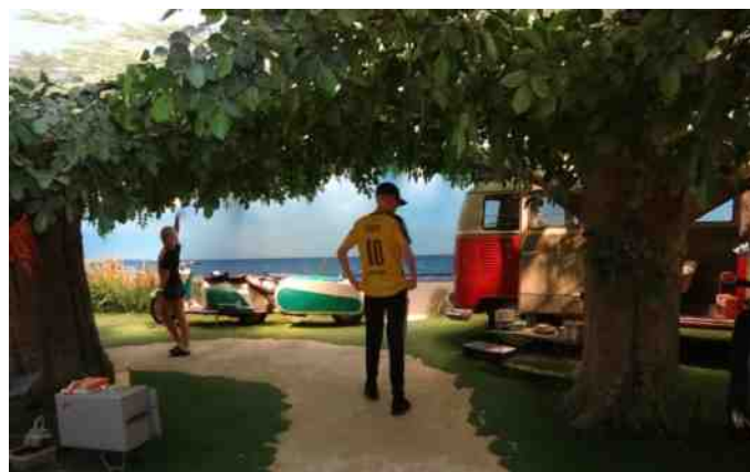
En tur igennem strandparken.

Igennem strandparken for derefter at blive sluset forbi en cafe i 60er stil. Desværre rendte tiden fra os, så de sidste 2 etager gik lidt for hurtigt, men ungerne holdt humør og virkede interesseret på de rigtige tidspunkter.