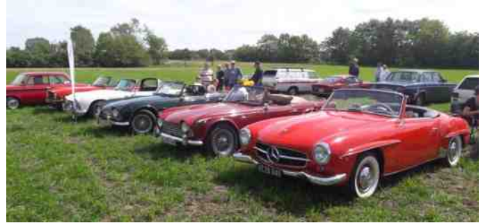
Masser af biler i Grønhøj denne søndag.

militæret. Det kneb dog med at indfri løfterne, hvilket skabte en del utilfredshed blandt kolonisterne.