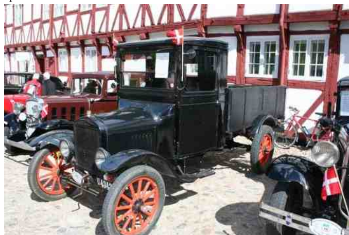
Ford T fra 1925.

Og så blev der ellers hygget i slotsgården med medbragte rundstykker og kaffe, og siden sandwich, vand og Ryå is sponsoreret af Region Nordjylland. Der var masser af besøg hele tiden af interesserede tilskuere, der kastede lange, beundrende blikke efter de fine biler, og enkelte spurgte ind til køb/salg af specifikke biler.