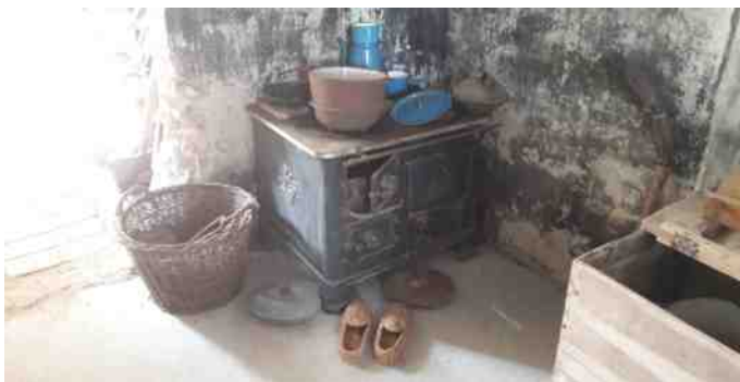
Et gammelt smedejernskomfur.

De havde også en køkkenudstilling med potter, pander, en gammel røremaskine og syltekrukker.