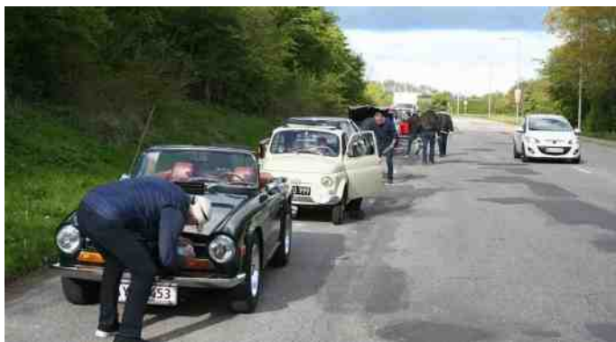
Bilerne forsynes med numre ved Travbanen.

Veteranbilerne og deres ejere mødtes ved Aalborg Travbane, hvor bilerne skulle forsynes med numre og p-licenser. Bilerne skulle køre i en på forhånd oplyst nummerrækkefølge, men det er altså ikke helt så let at få ca. 50 biler til at holde i nummerrækkefølge, som havde det været 50 personer, der skulle ind på geled. Men det gik med lidt hurtig gang frem og tilbage langs rækken af ventende biler, som så blev kaldt frem én efter én.