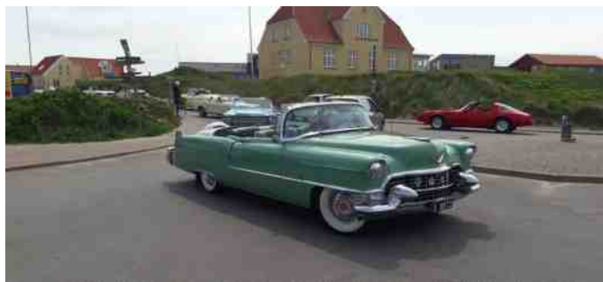
I Klitmøller fik vi besøg af to andre klubber, der også var på køretur.

Så blev der sadlet op igen, og retningen blev sat mod Hanstholm ad den smukke klitvej med den mest smukke natur, klitter, marhalm og det smukke Vesterhav. Da vi kom til Hanstholm kørte vi op til udsigtspunktet, hvor vi kunne se hvor meget, der bliver bygget i forbindelse med den nye havn.