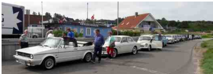
Vi skulle mødes ved færgen i Hvalpsund.