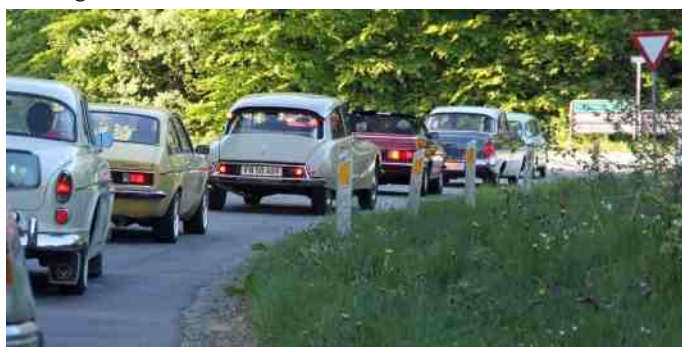
Bredt udvalg af bilmærker.

Vi kørte gennem Årestrup, der lige som alle andre byer, var fyldt med valgplakater. Det pyntede ikke just, men det er en af de ting, der følger med.