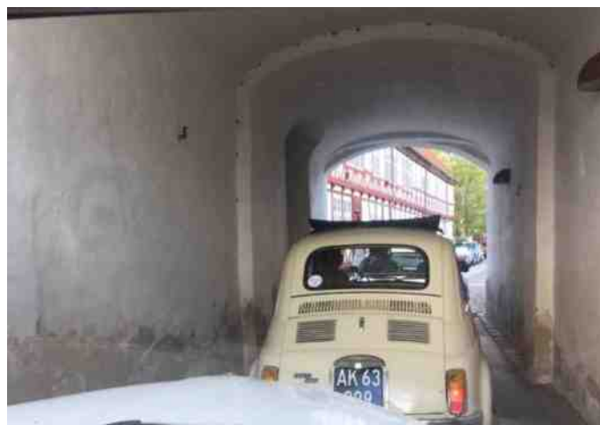
Denne Fiat 500 havde ingen problemer med at komme gennem porten til Aalborghus Slot.

Hvis I aldrig har været på Aalborghus Slot, så har I ikke set den smalle indkørsel til slotsgården. Især nogle af de helt store bilers førere så lidt betænkelige ud, og ville i det øjeblik nok have ønsket, at de havde en lille Fiat 500 eller lignende, men det gik fint med at komme ind, helt uden ridser eller buler os bekendt.