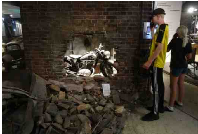
Her ses hvorledes motorcykler blev muret inde under krigen.

En imponerende og flot gennemgang af MC historien, krydret med flotte kulisser med blandt andet 2. verdenskrig (hvor man så MCere blive muret inde, for så at blive fundet frem igen efter krigen).