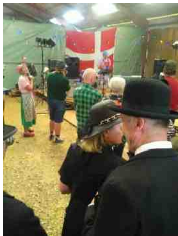
Der var underholdning fra scenen mellem kl. 13 og 15.

Øl, vand, kaffe og kage samt pølser direkte fra grillen kunne købes. Flere var mødt op i tidstypisk påklædning, som piftede det hele op, så man følte sig tilbage til den tid. Efter åbningsceremonien kl 13, var der frem til kl 15 fællessang og underholdning fra scenen. Veterandamerne og kromanden gav den fuld gas hele dagen, og gjorde deres til, at alle havde en god dag. Jeg ankom ca. kl 12:30, og der var der allerede helt sort af mennesker. Alt i alt en god oplevelse/tur, som jeg kan anbefale.