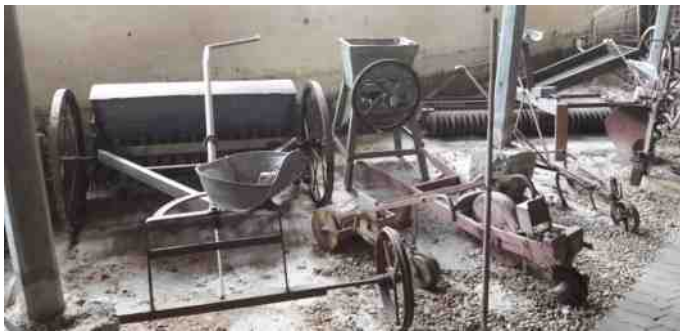
Nogle af de mange landbrugsmaskiner.

De havde også en køkkenudstilling med potter, pander, en gammel røremaskine og syltekrukker.