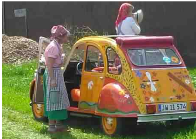
Veteranmadammerne var klædt i tidstypisk tøj.

Et nyt initiativ som "Veteranmadammerne" sammen med kroejeren havde sat på skinner.