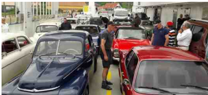
Der var trængsel på færgen, og færgemanden nåede kun lige akkurat at biltere alle bilerne, før vi var i Sundsøre.

Vi var 23 biler, så det var et flot syn, da vi kørte op ad bakken lige efter færgen. Turen gik nu over Salling og ind til Glyngøre, hvor vi slog os ned på plænen ved havnen. Der var hurtigt linet op med borde og stole, og mange nød deres formiddagskaffe.