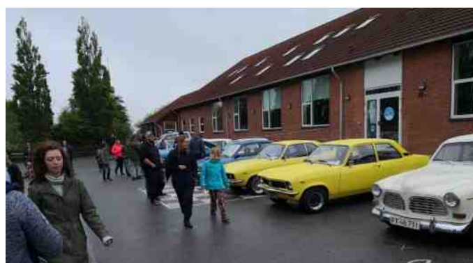
Nogle af de fremmødte biler til udstilling i forbindelse med bilboksning.