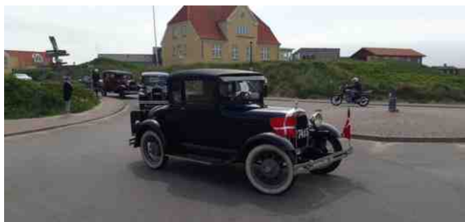
I Klitmøller fik vi besøg af to andre klubber, der også var på køretur.