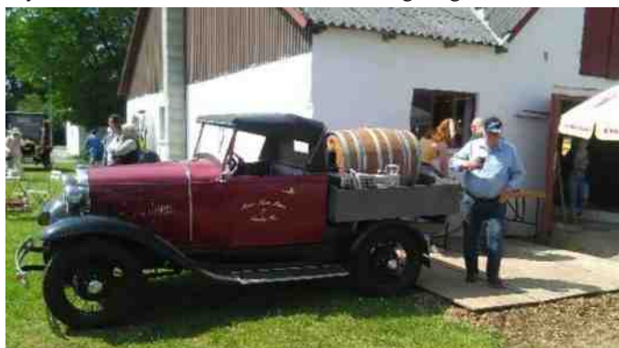
Der kunne købes øl direkte fra ølbilen.

Der var opstillet et, fra den tid, omrejsende nostalgi tivoli med skydetelt, børnekarusell, tombola, isbod og meget andet.