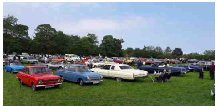
Masser af biler i Grønhøj denne søndag.

Der var ca 100 veterankøretøjer i alt og vejret var fint hele dagen med solskin og ingen regn, så det var altidens dag. Meget interessant at se museet, da vi ikke vidste at der var et Morten Korch museum i Grønhøj. Det er bestemt et besøg værd.