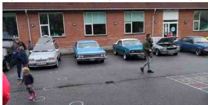
Nogle af de fremmødte biler til udstilling i forbindelse med bilboksning.