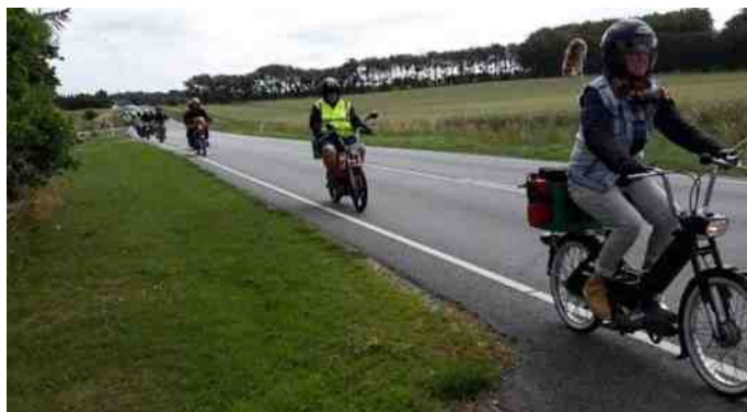
En af Maxi Girls efterfulgt af de andre deltagere.

Vejret var lidt gråt, men dog med rimelig temperatur. Vi kørte gennem Hvalpsund mod Alstrup, videre mod Gl.Ullits, Svingelbjerg, Vognsild og mod Farsø, hvor vi holdt en lille kombineret tisse, snakke, opladningspause. Vi var også inde og se på nogle maskiner, der var "lidt større end Puch Maxi" i butikken hos Gert. Så er en Puch Maxi godt nok borte ved siden af de store maskiner, der vejer 350 kg og har 1600 kubik (eller hørte jeg forkert?) Nu gik turen tilbage mod campingpladsen af små hyggelige veje over Fandrup, Foulum og forbi Dollerup og sidste stop var campingpladsen. Vi havde kørt små 40 km. Ingen problemer undervejs og vejret var klaret flot op og endt i dejligt solskin. På campingpladsen havde forplejningsholdet gang i grillede pølser, brød osv. Dog var der nogen, blandt andet undertegnede, der hurtigt spottede at Maxi Girls stod med nogle flotte flasker, som viste sig at være deres berømte Maxi Mut. Og så kan det ellers nok være, at vi var hurtige til at få fundet de små snapseglasser frem, og os snapsentusiaster fik luret et par opskrifter fra tøserne, blandt andet på jordbær snaps. Uhhhhm, den var dælmee god. Efter rigeligt med lækre pølser, sluttede vi af med kaffe og kage, som campingfatter og mutter havde sponsoreret.