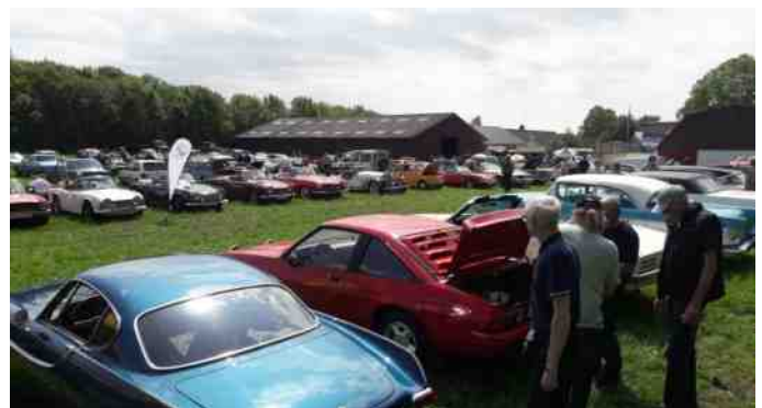
Masser af biler i Grønhøj denne søndag.

Vi var en 10-12 stykker fra Aalestrup Classic Bil og MC Klub på trods af, at vi ikke havde arrangeret fælles kørsel, eller aftalt noget på forhånd.