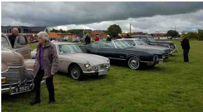
Pause i Ry.

Vi holdt en kort pause på en bakke i Ry, hvor der var en fantastisk dejlig udsigt. Vi blev enige om ikke at spise frokost der, da det stormede helt vildt.