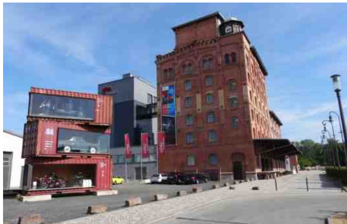
Museum PS Speicher.

I sommerferien 2018 havde vi en dag, vi skulle have brugt, inden vi havde vores feriebog til rådighed. Jeg havde set i en Facebookgruppe, at der var et stort bil/MC museum i Einbeck i Tyskland. Tidligere havde der været afholdt træf (Stori) for småbiler, men på grund af for stor succes, og uenigheder med kommunen om afholdelse, stoppede det vist i 2010. Det er nu startet op igen 13. - 16. Juni 2019 (andet år), men vist ikke med særlig meget planlægning. Vi startede på museet kl 10.