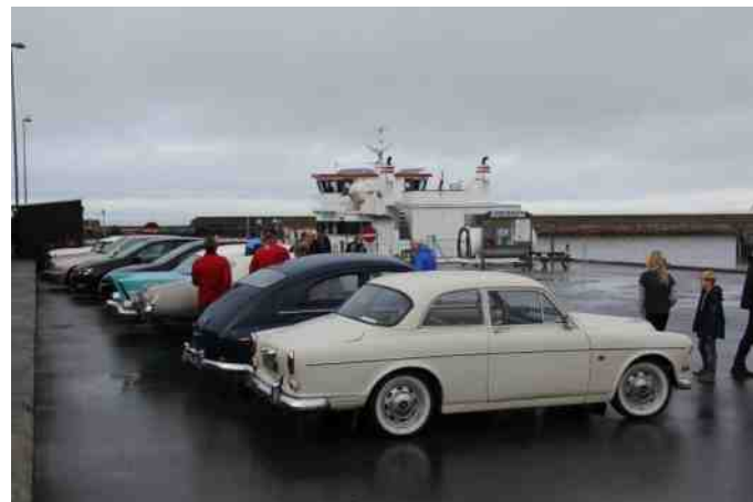
Pause på Rønbjerg havn.