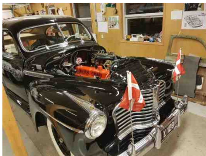
Så kan vi snart hejse flaget

Så er kølegitteret monteret, pladen foran, hvor også kofangeren er sat på. Nu mangler vi kun motorhjelm og bagklappen.