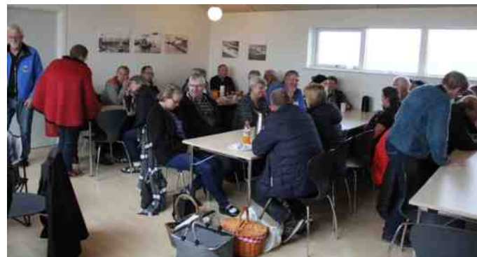
Frokost i sejlklubbens lokaler på havnen i Løgstør.

Klokken 14.15 gik turen videre til Hvalpsund for dem, der ville med, ellers var der opbrud.