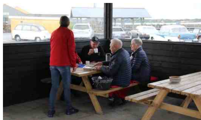
Kaffe på havnen i Hvalpsund.