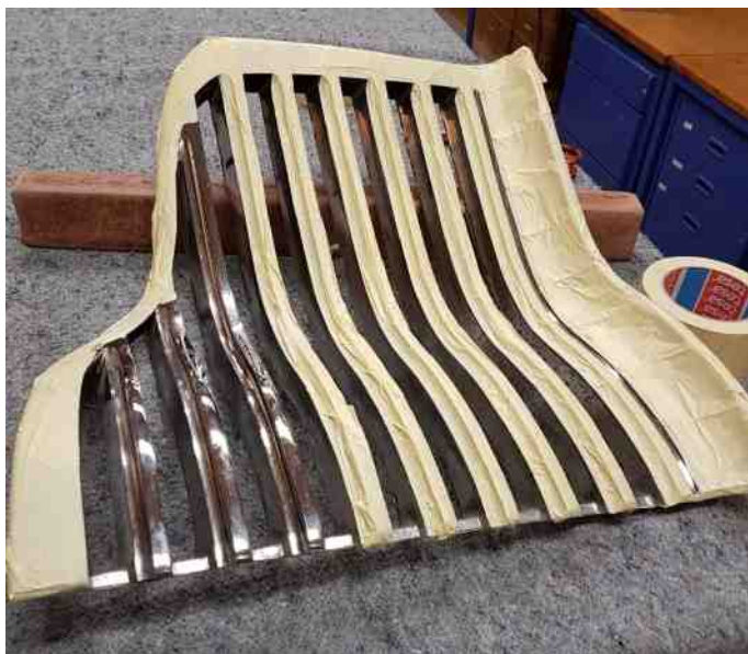
Godt med malertape

Kølegitteret er blevet malet i rillerne. Det har vi selv gjort. Man skulle tro vi har aktier i malertape fabrikken. Den har vi godt nok støttet flittigt de sidste år. ☺