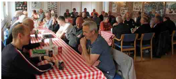
Der er altid et flot fremmøde til generalforsamlingen.