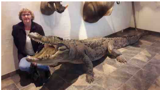
Redaktørens mor sammen med krokodillen.

Historien om at opholde sig på Savannen i korte bukser og kort skjorte i bagende varme om dagen, og ligge på Savannen om natten i bidende kulde, samt da han løb i en faretruende situation og efterlod konen til at klare sig selv på Savannen på deres sølvbryllupsrejse.