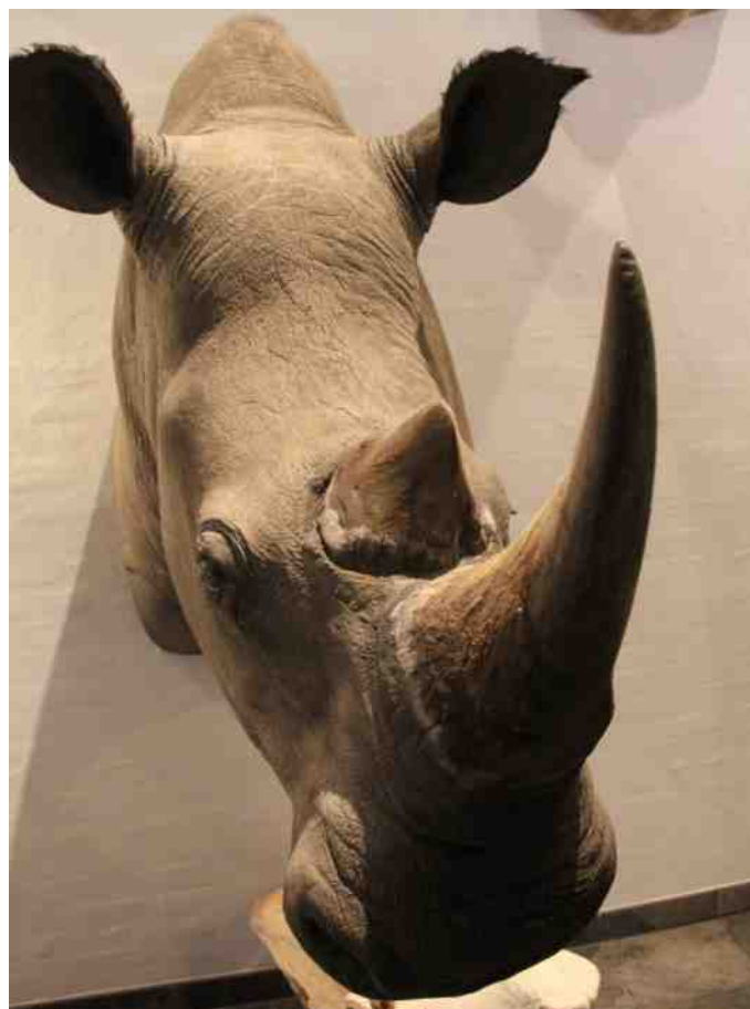
Næsehornet, som det lykkedes Knud at skyde på en af turene.