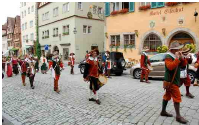
Stemmingsbillede fra Rothenburg.