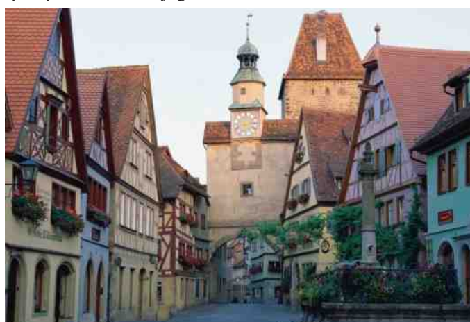
Flotte gamle huse i Rothenburg.

Derefter tog vi en tur med en turbil (en der skulle forestille en gammel hestevogn). Chaufføren var en ældre mand, der var god til at fortælle, så vi fik valuta for alle pengene. Efter en ekstra god spadseretur tog vi til hotellet, og gjorde klar til at gå ud og spise på vores lille dejlige restaurant.