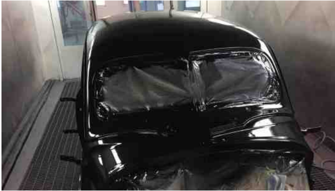
Baronessen hos maleren.

Enhver ledig stund, tilbringer Einstück hos hende. Instrumentbrættet er monteret, alle knapper og kontakter er sat til. Det er blevet rigtig flot med woodgrainingen (Trælook).