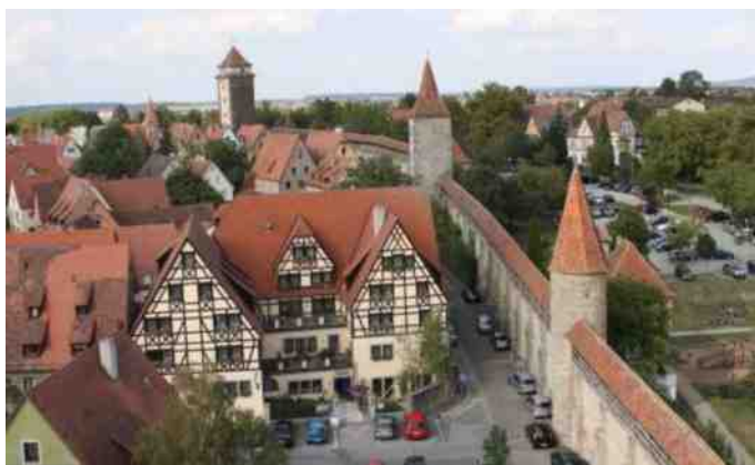
Ringmuren omkring Rothenburg.

Alt i alt var de meget tilfredse, og vi har ikke hørt mere til sagen. Søndag morgen efter morgenmaden gik turen til Farsø - 995 km. 14 dage efter kom begge biler hjem med samme transport.