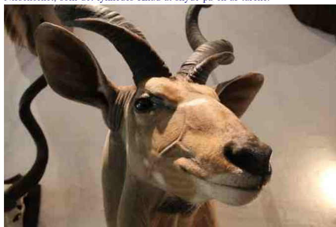
Dyrene er meget livagtige.