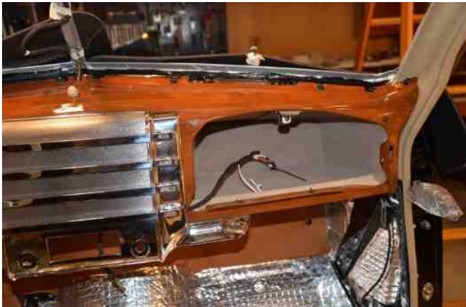
Det tager ligeså stille form nu.

Enhver ledig stund, tilbringer Einstück hos hende. Instrumentbrættet er monteret, alle knapper og kontakter er sat til. Det er blevet rigtig flot med woodgrainingen (Trælook).