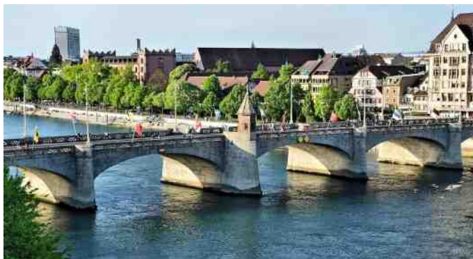
Bro over Rhinen i Basel.

Torsdag var vi på køretur og samledes på en skøn skovkro, hvor vi skulle spise frokost, derefter var der arrangeret en køretur rundt i det kønne Schweiz. Herefter gik turen hjem til hotellet og aftensmaden. Efter lidt hygge i baren var vi trætte, og gik i seng. Fredag efter morgenbuffet startede vi op igen på en længere tur, hvor vi endte på endnu et museum med gamle biler, benzinstandere og mange andre ting, der relaterede til biler. På museet skulle vi spise frokost, en tallerken med pølse, pålæg ost og andre gode ting. Så var det tid at tage hjem på hotellet. Kl. 18 stod der en bus udenfor, som skulle køre os ind til Basel, hvor vi skulle spise til aften. Synd at vi var for trætte. Dog fik vi kræfter til lidt hygge i baren.