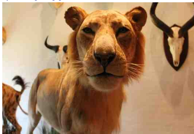
Løven så nærmest ud, som om den var levende.