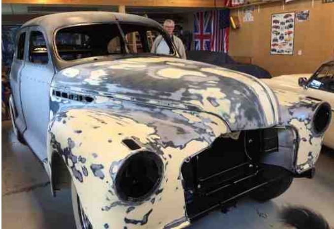
Længe siden hun så sådan ud.

Der er sket rigtig meget det sidste år i garagen. Men der bliver nusset og puslet hos den gamle frue.