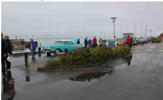
Ankomst til havnen i Løgstør.