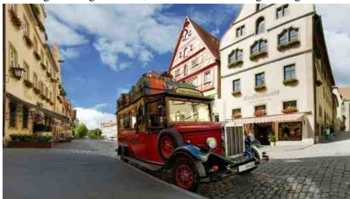
Man kan også støde på flotte gamle biler i Rothenburg.

Fredag var der morgenmad i hotellets restaurant, og så ud og se på byens små gader (2 biler kan ikke passere hinanden uden at tage fortovet i brug), hver gang man drejer om et hjørne kommer der nye synsindtryk. Man kommer nemt til at trænge til en øl eller et glas køligt hvidvin, lidt frokost kunne også bruges.