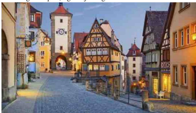
Flotte gamle huse i Rothenburg.

Vi havde lovet os selv, at vi ville til Rothenburg igen, så den 14. Maj 2015 startede vi Audien og tog afsted til 3 overnatninger. Vi fandt et dejligt hotel, lidt sent, da vi havde et lille uheld med en bolt, der sprang ved et eller andet, der skulle holde hjulet. Heldigvis passede en af hjulboltene. Derefter var det bare ud og finde noget at spise, og så hjem og sove.