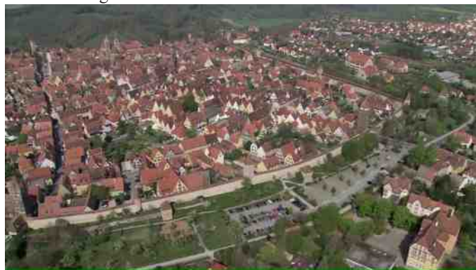
Rothenburg med ringmuren omkring den gamle bydel.