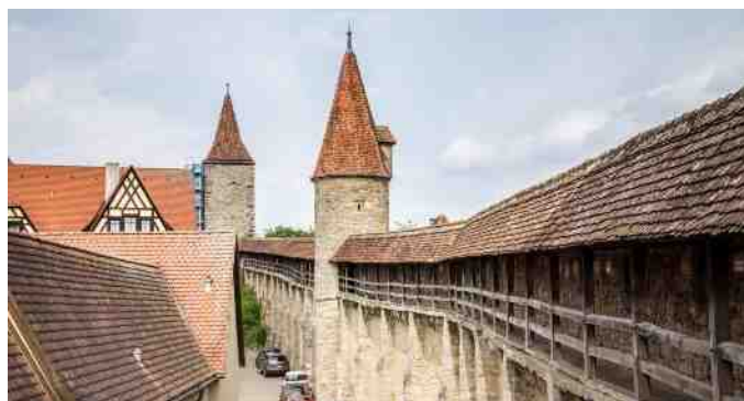
Her ses hvorledes man kan gå på ringmuren.