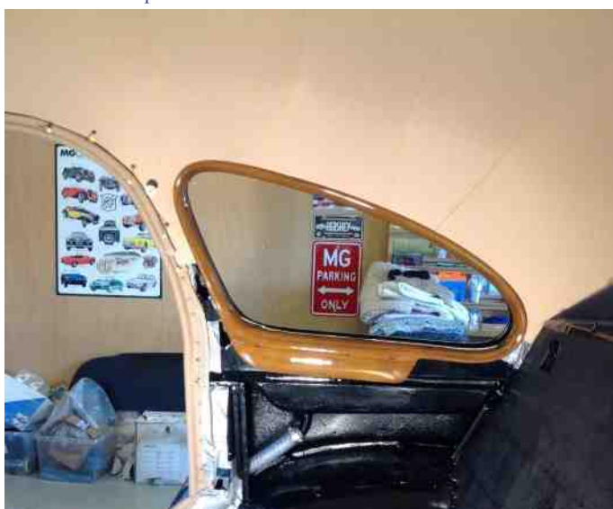
Det bliver godt med trælook rundt ved vinduerne.

Ledningsnettet er helt nyt i bilen, det er rigtig dejligt.