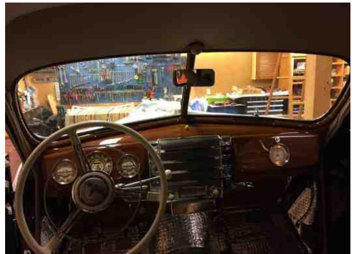
Nu med rat, og alle instrumenterne på plads.