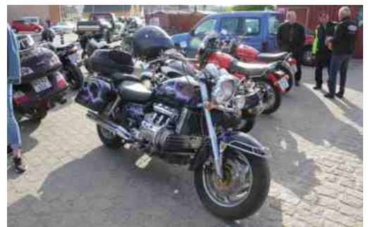
Hobro havn den 17. Juli 2017.