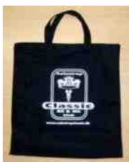
Mulepose: 50,- kr.