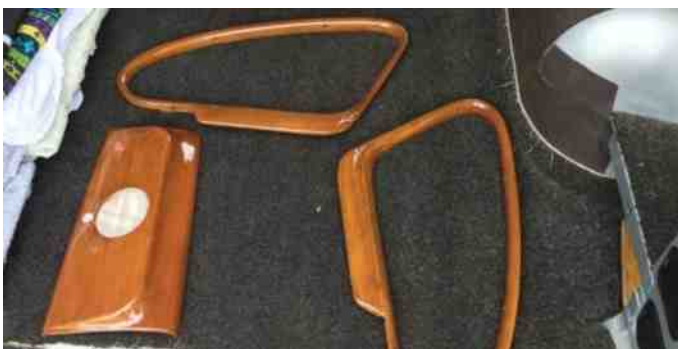
Vinduesrammerne er klar til montering.