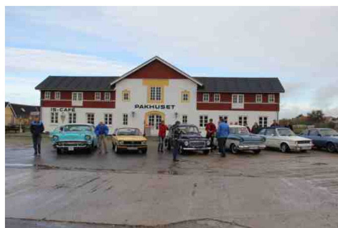
Pause ved Pakhuset i Hvalpsund.