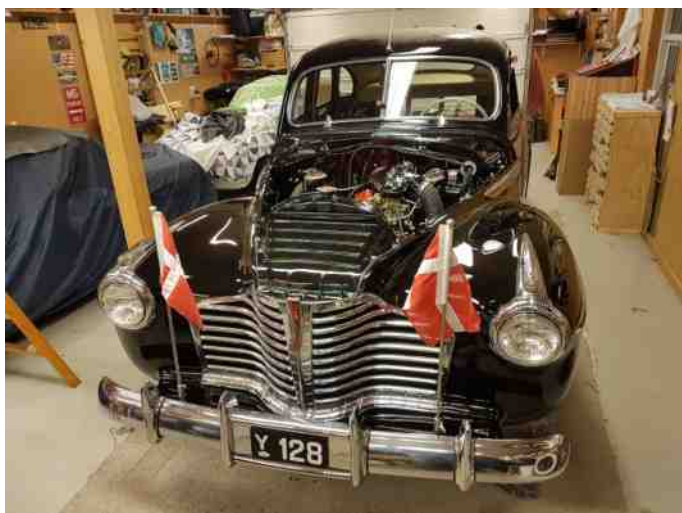
Så kan vi snart hejse flaget

Vi mangler kun det sidste. (Det har Einstück sagt de sidste 3 år)