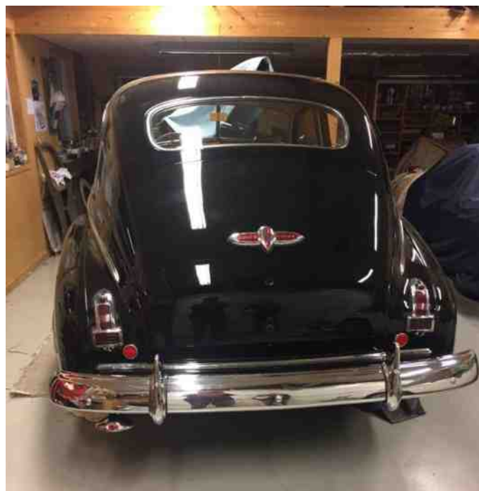
Så er bagklappen på.

Forruderne og bagruden er monteret. Næste punkt er vinduerne i dørene. Så kan vi også få dørbeklædningen sat på og lukket det. Dørlisterne skal også monteres.