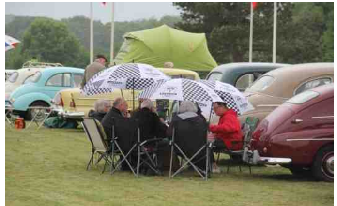
Aalestrup Classic Træf 2017 var en våd omgang, men der blev alligevel hygget under paraplyerne.