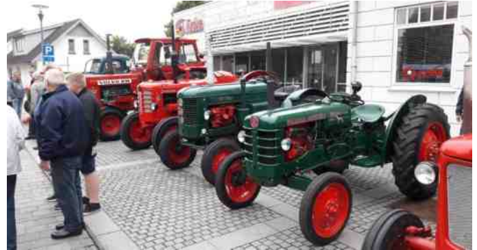
Et par fine Bolinder-Munktell traktorer

Mandagen efter, den 24. Juli 2017, var der igen udstilling af veterankøretøjer i Farsø. Denne gang var det veterantraktorer og maskiner, der stod for tur. Der var mange fine traktorer og maskiner og der var rigtig mange af dem. Faktisk er jeg lige ved at tro, at der var lige så mange køretøjer denne aften, som der var ugen før. Det er flot!