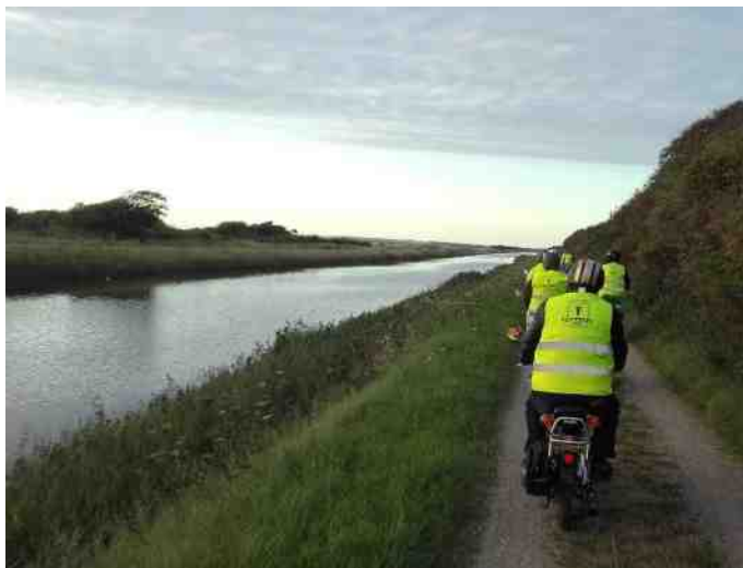
Kørsel langs kanalen mod Løgstør.

Herefter måtte man trække knallerterne over broen, og så gik turen fra Ranum til Rønbjerg, hvor der igen var en lille pause, hvor der var flere interesserede tilskuere, som beundrede de gamle knallerter. Så gik turen til Lendrup, og man kørte langs kanalen tilbage til Løgstør, og man endte efter en havnetur igen på Hvedemarken.