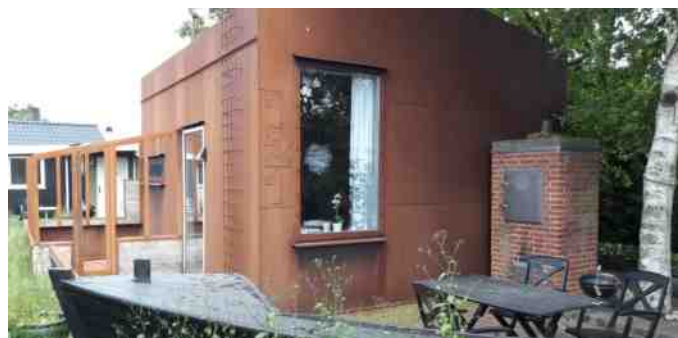
Dette hus er bygget i stålplader.

Efter et par timer var der afgang fra Aalborg. Målet var Nibe havn, hvor vi skulle have vores kaffe. Ruten gik ad Restrup- og Nørholm enge gennem Klitgård sommerhusområde. Et mere åbent landskab, hvor vi det meste af tiden kunne se fjorden. Vel fremme på havnen i Nibe blev der dækket kaffebord for en times hygge, inden vi skulle hjem.