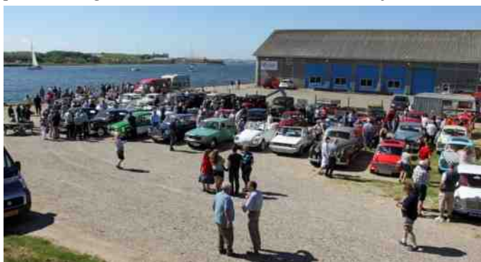
Parkering på havnen.

Derfra fulgtes vi i samlet flok til Aggersund. Vi parkerede nede på havnen og der var stor interesse for vores køretøjer.