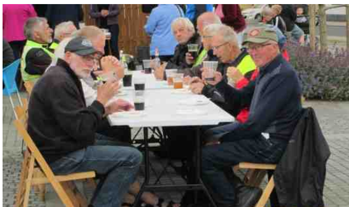
Den helstegte pattegris med flødekartofler blev spist med stor velbehag.