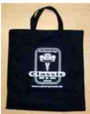
Mulepose: 50,- kr.