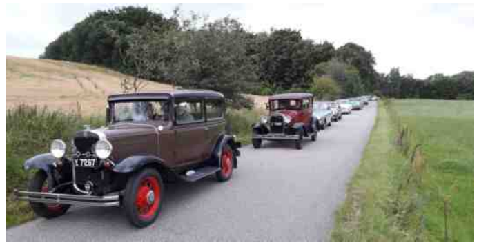
Dejligt syn med alle de fine biler.

Der blev snakket, grinet og nørdet i pausen. Jernalderlandsbyen var levendegjort, men beboerne kom gående med deres madrasser på hovedet, så vi var tydeligvis kommet for sent.