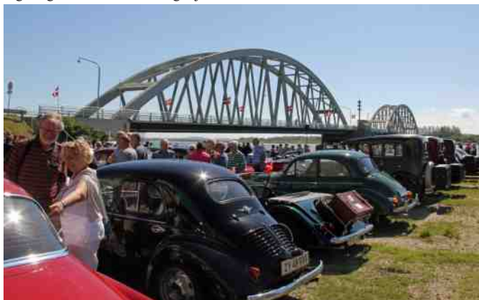
Fine biler med Aggersundbroen i baggrunden.

TV Nord var også mødt frem, og Ove Haubro fik besøg af Mogens i lastbilen, hvor de fik en god snak om betydningen af broen for specielt lastvognstrafikken.