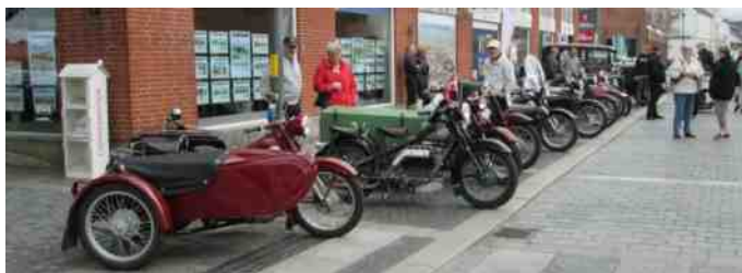
Himmerlands Nimbus klub var også mødt med 8-10 Nimbusser.