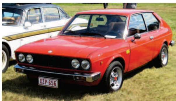
Fiat 128 1300 Sport Coupé årgang 1971.

Drivlinjen i Fiats lille sportsvogn X 1/9 blev taget direkte fra 128 Rally og motoren fra 128 blev siden videreudviklet til modellerne Ritmo/Regatta, Uno, Tipo/Tempra, Punto, Bravo/Brava, Marea, Multipla og Stilo. I 1978 introducerede Fiat model Ritmo der skulle afløse 128. Imidlertid var 128 så populær, at modellen fortsatte i produktion frem til 1985.