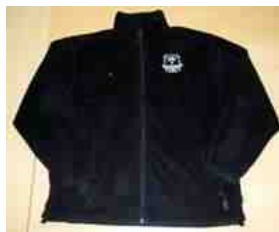
Fleece: 250,- kr.