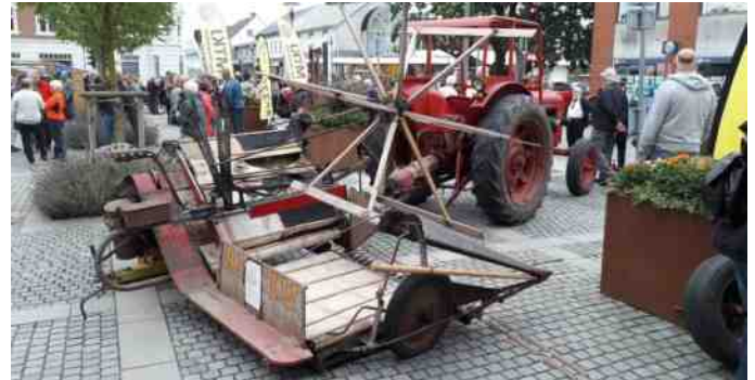
En Aktiv selvbinder efterspændt en Bolinder-Munktell traktor.

Der var også mulighed for at få en køretur med en veterantraktor, idet der var arrangeret rundture med et par traktorer med 4-hjulede vogne, hvor gæsterne kunne sidde i.