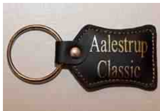
Nøglering: 25,- kr