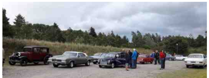
Pause ved Hvolris Jernalderlandsby.

Det var nu heller ikke meningen, at vi skulle se landsbyen, men istedet drikke en øl eller sodavand og have et stykke chokolade. Nogle få havde glemt, at der sjældent er automatisk køreløys på veteranbiler, men det var dog rettet, inden vi kørte videre.