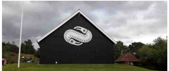
Ankomst til Hvolris Jernalderlandsby.

Det var nu heller ikke meningen, at vi skulle se landsbyen, men istedet drikke en øl eller sodavand og have et stykke chokolade. Nogle få havde glemt, at der sjældent er automatisk køreløys på veteranbiler, men det var dog rettet, inden vi kørte videre.