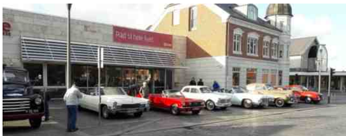
Også foran sparekassen holdt der mange køretøjer.