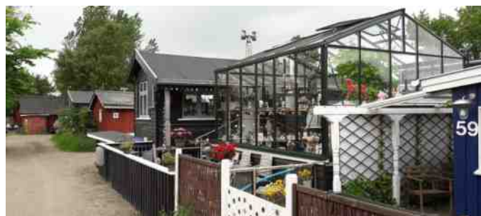
Nogle af de mange spændende bygninger i Fjordbyen.