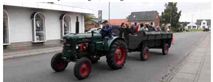
Der var mulighed for at få en køretur med veterantraktor.

Der var også mulighed for at få en køretur med en veterantraktor, idet der var arrangeret rundture med et par traktorer med 4-hjulede vogne, hvor gæsterne kunne sidde i.