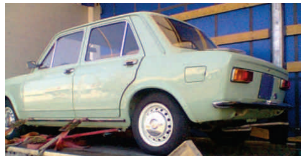
Så er min anden Fiat 128 læsset i Lodi Italien klar til turen mod Danmark i september 2016.

Jeg elsker at køre i min Fiat 128 som i forhold til nutidens biler har langt bedre udsyn. Den kører 15-16 km/l i gennemsnit, hvilket mange nye biler ikke gør meget bedre. God sommer!