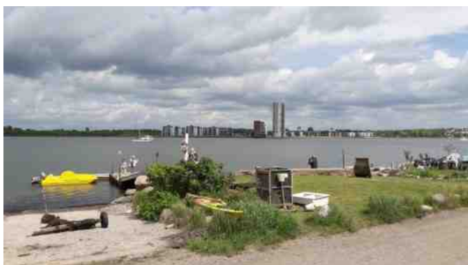
Fjordbyen er smukt beliggende i Aalborgs vestby lige ned til Limfjorden.

Parkering inde i Fjordbyen ville fylde så meget, at man skønnede at det kunne blive til gene for beboerne.