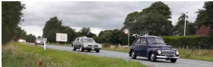
Afgang fra Aalestrup mod Hvilsom.

Vi kørte fra Aalestrup mod Skravad Mølle. Vejen slyngede sig igennem dale og bakker, men strabasserne var ikke større end alle sagtens kunne klare det. Vejene omkring Skravad Mølle var som biveje er flest, men vi kørte jo ikke hurtigere, end at vi sagtens kunne undgå de værste bump.