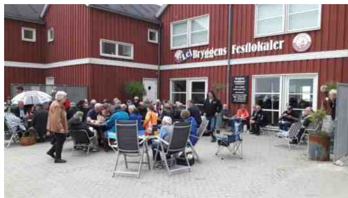
Eftermiddagskaffe på havnen i Nibe.

Efter et par timer var der afgang fra Aalborg. Målet var Nibe havn, hvor vi skulle have vores kaffe. Ruten gik ad Restrup- og Nørholm enge gennem Klitgård sommerhusområde. Et mere åbent landskab, hvor vi det meste af tiden kunne se fjorden. Vel fremme på havnen i Nibe blev der dækket kaffebord for en times hygge, inden vi skulle hjem.