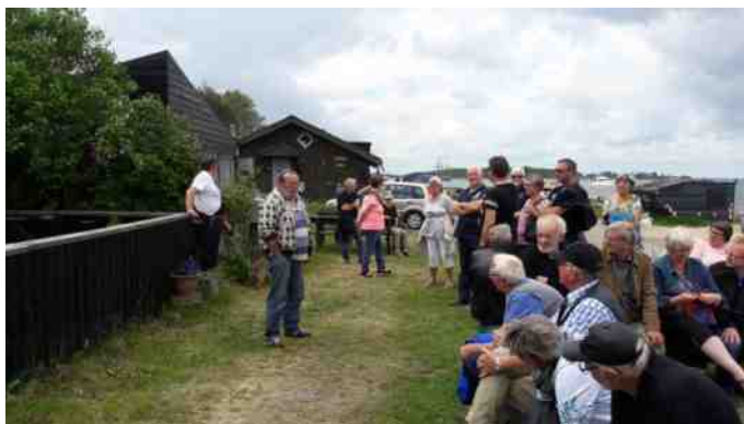
En af vores 3 rundvisere fortæller om Fjordbyen, og hvad det er for et sted.

Tilbage i Fjordbyen blev vi mødt af 3 spøjse herrer, der viste os rundt i den specielle bebyggelse, en oase for beboerne der både var venlige og gæstfrie.