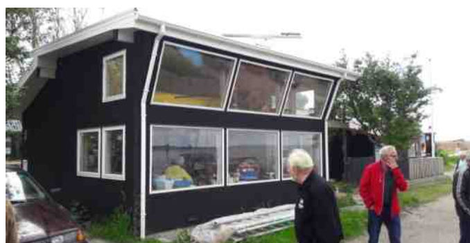
Ejeren af dette hus er tidligere sømand, og har bygget huset som broen på et stort fragtskib.