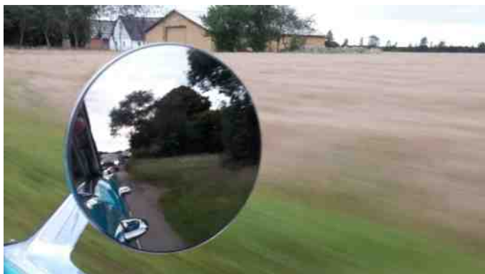
Et glimt i sidespejlet.

Turen gik videre mod Bjerregrav, og derefter til Hvolris Jernalderlandsby, hvor vi holdt pitstop.