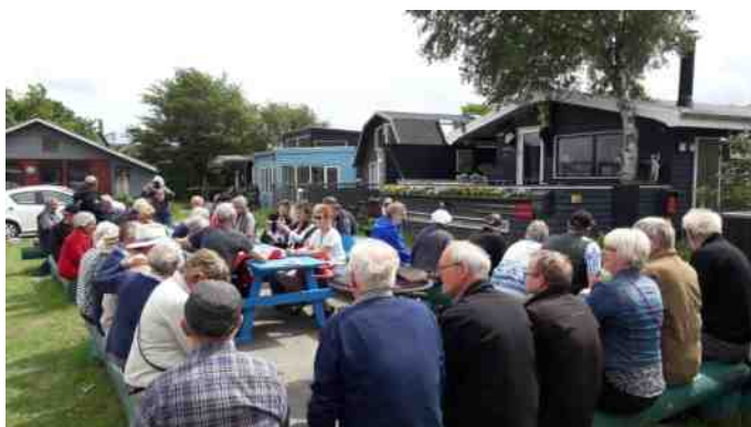
Alle lyttede opmærksomt til de spændende fortællinger rundviserne viderebragte.