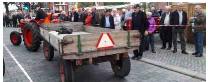
Konkurrence i at bakke med 4-hjulet vogn.

Endvidere var der arrangeret konkurrence i at bakke med 4-hjulet vogn, og det var sjovt at se den store forskel, der var på deltagerne. Nogle kunne bakke med vognen, som om de aldrig havde lavet andet, andre kunne knap nok bakke et par meter, før det gik galt.