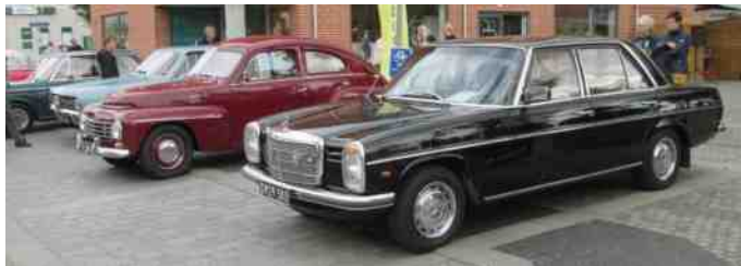
Mange fine biler i hovedgaden.