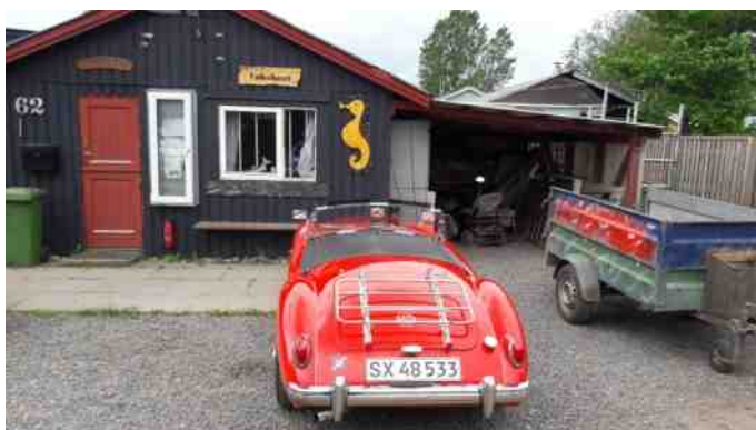
Nogle af Fjordbyens beboere kører selv veteranbiler. Her er det en fin MGA fra 1959.

Tilbage i Fjordbyen blev vi mødt af 3 spøjse herrer, der viste os rundt i den specielle bebyggelse, en oase for beboerne der både var venlige og gæstfrie.