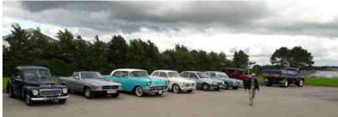
Et lille udsnit af bilerne, der var mødt op denne aften.

Det var en dag, hvor sommervejret var, som vi mest kender det. Lidt sol, lidt overskyet og selvfølgelig blæst. Vi mødtes på træfpladsen i Aalestrup og ad snørklede veje skulle vi ende i Gedsted. Vi var 20 biler, en lastbil og en modig motorcyklist, der trodsede vejret. Nogle var modige og lod kalechen blive nede, mens andre valgte at lade den blive oppe, og skrue op for varmen.