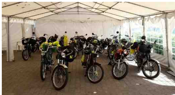
De mange knallerter der var med på turen denne aften.