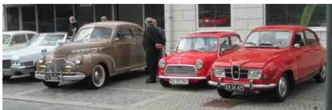
Flere fine biler.