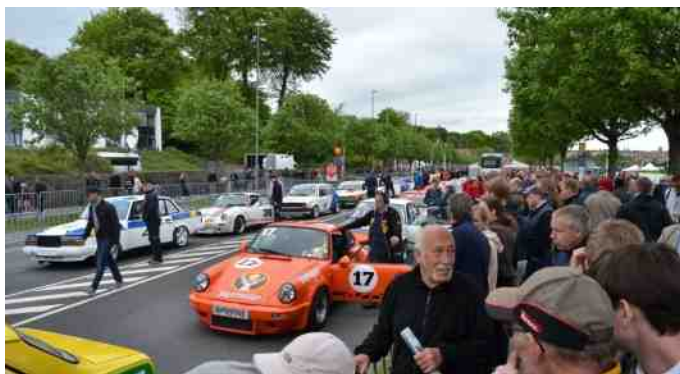
Bilerne er linet op til start.

Vi ankom midt på formiddagen, og gik straks ind i ryttergården. Det var et spændende sted, og der var masser at se på. Det var jo som sagt første gang jeg var der, så jeg vidste ikke, hvor det foregik, men heldigvis havde jeg jo Stig med, som havde været der flere gange. Til tider var det svært at høre racebilerne for Stig, men alligevel tak for en god rundvisning. ☺