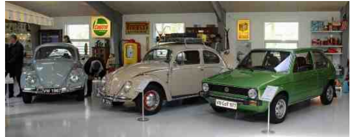
Nogle af den mange flotte biler.

I løbet af de sidste 15 år har samlingen taget fart, og de har valgt at bygge en hal, hvor gulvet er opvarmet. Der står de flotte biler.