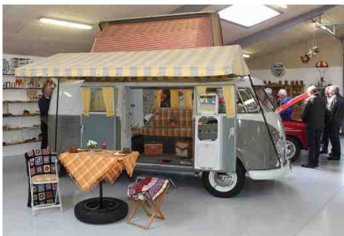
Meget sjælden VW Transporter Westphalia Campingbus fra 1963.

Den mest specielle er en VW Transporter Westphalia Campingbus fra 1963. Der blev i alt lavet 25 af denne type, hvor hele taget kunne have. Det var en meget dyr model. Denne her blev fundet i Næstved. Den er meget sjælden, og måske findes der kun tre tilbage. Bilen står fuldstændig original. Selv opvaskebaljen er original. Dem er der vist heller ikke mere end tre tilbage af. Ejeren af den ene balje tænkte, at man måtte kunne lave penge på den, så han sendte den til Kina i håbet om, at de kunne reproducere den. Den kom tilbage i rigtig mange stumper, så nu er der kun to baljer tilbage.