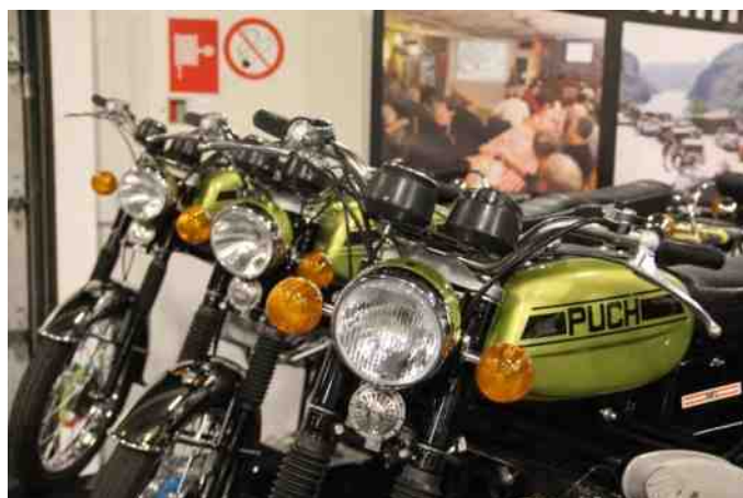
5 stk. Puch Flagskib på klubbens stand til stumpemarked i Aars.

Dækkene var meget stive at montere, men det er også 6-lags, lige så meget, som på en varebil.