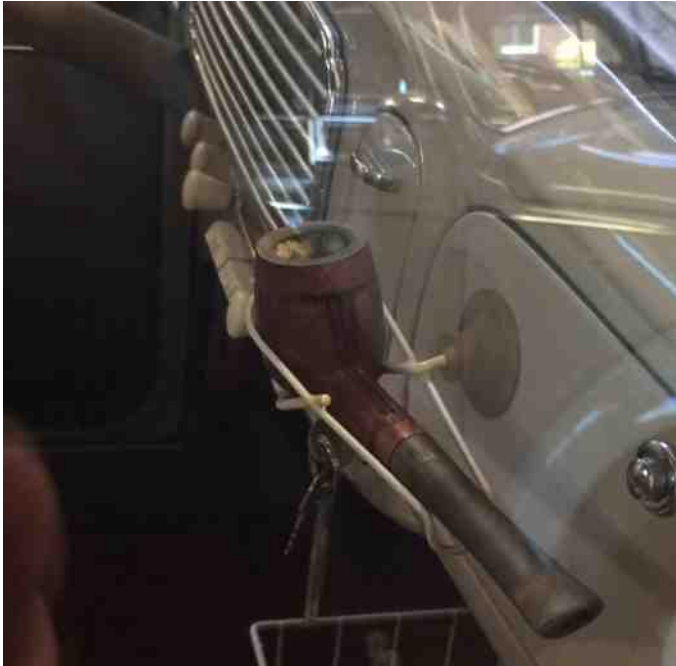
VW har altid været kendt for deres sjove og utraditionelle løsninger. Her er det en pibeholder til en Folkevogn.