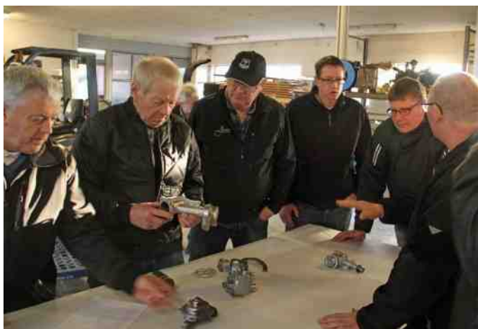
De mange behandlede emner blev nøje studeret.

Mange af os har naturligvis stor interesse i at se den slags nye spændende metoder, og de færdige resultater blev studeret nøje af de fagkyndige medlemmer.