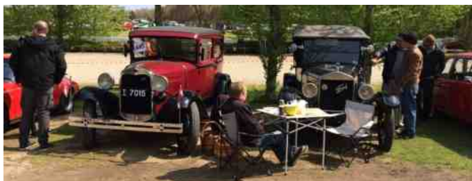
Ford A og Ford T.

Parken var også pakket rigtig godt med over 100 flere inde end sidste år. Vi fandt de andre fra Aalestrup, og fik lige sagt hej til dem. I alt var der over 500 biler, solen skinnede og tulipanerne stod i fuldt flor. Det kunne ikke være en bedre dag.