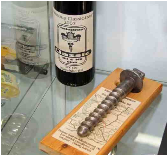
Carsten og Sussi har også deltaget i Aalestrup Classic Træf, og ikke overraskende vundet præmie for bedste bil.