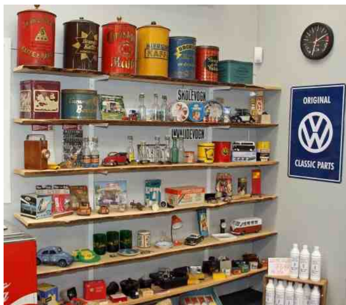
Flere fine retro ting.