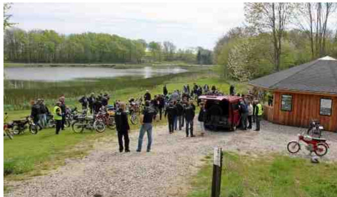
Der var indlagt flere pauser på turen.

Vi var heller ikke kommet ret langt, før der var en, der var punkteret, men det var den nu inden vi startede. Han lånte min Puch Maxi, som jeg havde med som reserve knallert. Resten af turen bemærkede jeg ikke flere nedbrud og kassebilen kom ikke yderligere i brug, ud over dens funktion som feltkøkken.