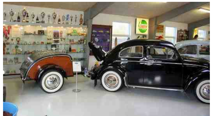
Folkevogn med trailer foran skabet med de mange præmier Carsten og Sussi har vundet gennem tiden.