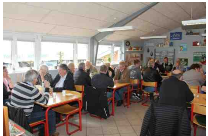
Efter rundvisningen var det tid til kaffe og småkager i cafeen.

Dagen sluttede af med kaffe og småkager, hvor der var mulighed for at stille flere spørgsmål.