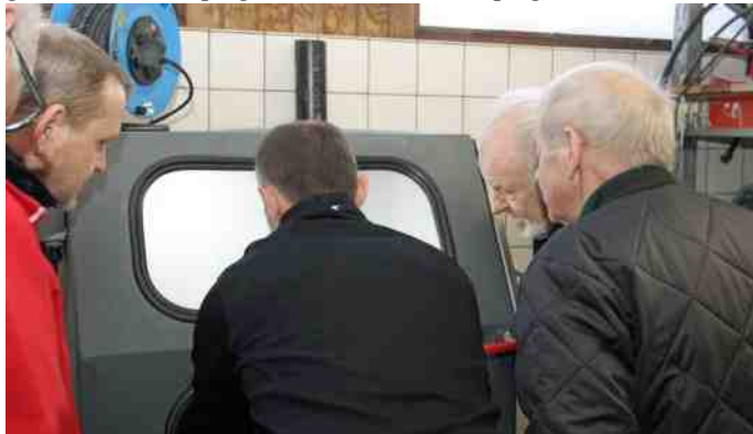
Maskinen blev demonstreret og alle fulgte nøje med.

Den korte tur fra klubhuset på Vandværksvej og til firmaet i Vestergade, foregik for en gang skyld heller ikke i hverken gamle biler eller på gamle knallerter, men på gå-ben.