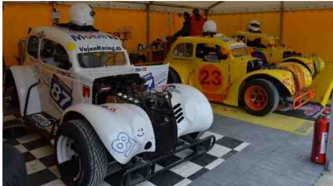
Racerbiler, der kører i klassen "Legend Cup".