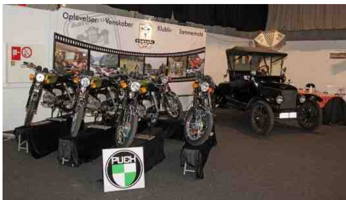
5 stk. Puch Flagskib på klubbens stand til stumpemarked i Aars.

Til stumpemarkedet i Aars den 22. april, 2017 var der på Aalestrup Classic Bil & MC klubs stand, ikke færre end 5 stk. Puch Flagskib, der så ud som nye. Hvordan var det gået til?