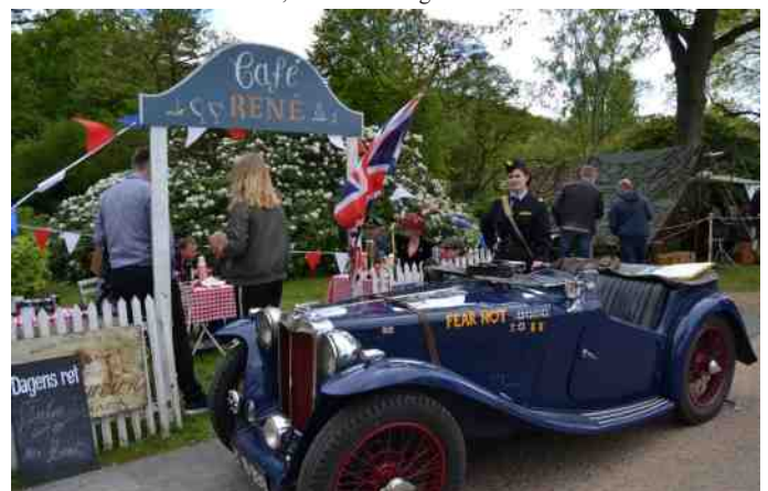
Der er også masser af stande, hvor folk er klædt ud i tidstypisk tøj.

Lyden skal opleves, og jeg kan kun anbefale at tage forbi næste år. Der er virkelig fuld valuta for pengene.