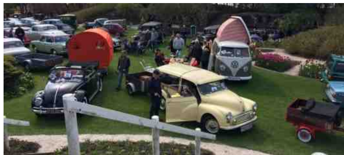
Flotte biler i skønne omgivelser.

Det er sjovt, at have så gammel en bil med, for far havde meget travlt med at snakke med folk. Der kom blandt andet en ældre mand, som startede med at spørge, om ikke det var den, der holdt i Vammen, og om ikke det var den, der var blevet købt på auktion.