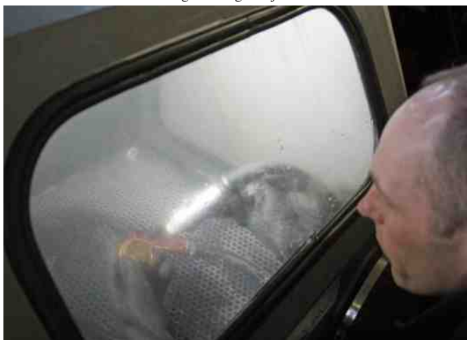
Maskinen blev demonstreret.

Vi fik en spændende fremvisning af en ny teknologi, nemlig Vandpolering. Vandpolering er noget forholdsvis nyt på markedet, og er en ny måde at afrense og overfladebehandle fx aluminiumsemner på, som f. eks. motorblokke, karburatorer, topstykker m.m.