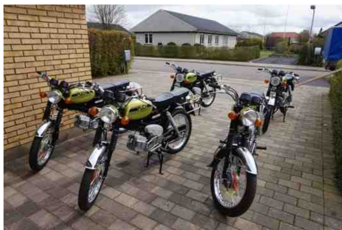
5 stk Puch Flagskib netop færdigsamlet og klar til stumpemarkedet i Aars.

Da det rygtedes, hvad vi havde gang i, var der mange, som blev interesseret. Det endte med at vi måtte afsted igen efter 3 stk. mere. Vi nåede lige at få dem samlet til stumpemarkedet. Den ene var solgt på forhånd, og en blev solgt på udstillingen. Vi beholder selv 2 stk.