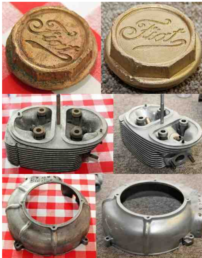
Nogle af de mange behandlede emner før og efter behandlingen.

Jeg er sikker på, at det er en mulighed, som mange af os vil benytte os af.