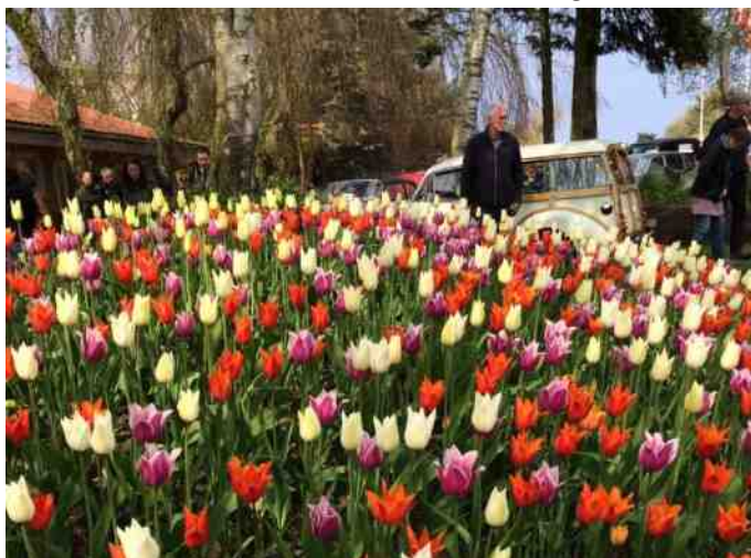
Masser af flotte tulipaner med veteranbiler i baggrunden.

Parken var også pakket rigtig godt med over 100 flere inde end sidste år. Vi fandt de andre fra Aalestrup, og fik lige sagt hej til dem. I alt var der over 500 biler, solen skinnede og tulipanerne stod i fuldt flor. Det kunne ikke være en bedre dag.