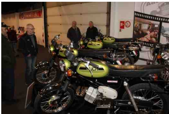
5 stk. Puch Flagskib på klubbens stand til stumpemarked i Aars.

Der var hele tiden en masse mennesker, for at se på. Der var virkelig stor opmærksomhed om knallerterne. Der blev stillet mange spørgsmål, og jeg kunne også høre, at mange talte om dem i hallerne. Det hele startede med at min nabo, som er gammel Flagskib fan, lidt før julen 2016, begyndte at lede i diverse medier efter en Flagskib. Han stødte på en annonce i Den Blå Avis, hvor man hos Puch Parts, kunne man købe et helt byggesæt med alle dele, hvoraf de 80% var helt nye. Han besluttede sig for at køre til Haderslev og kikke på sagen, og det endte med, at han fik et byggesæt med hjem. Samme aften, var jeg ovre for at se delene, som han havde spredt ud over hele spisebordet og stuegulvet. Jeg blev virkelig imponeret over, hvor fine delene var. Motoren var renoveret med alle sliddele skiftet. Der var nye skruer og bolte overalt. Krom delene var også i en rimelig kvalitet, måske med undtagelse af forskærmen. Det endte med at vi ugen efter, kørte til Haderslev for at hente et sæt til mig.