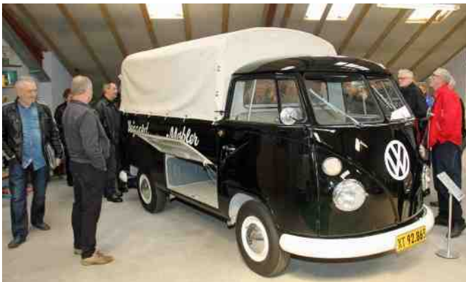
Møbelbilen fra Vejgaard Møbler, der også fungerer som rustvogn.