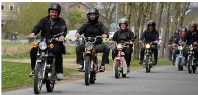
Knallerter i alle mærker og farver.

Vi var knapt startet på den 80 km lange tur før benzinen pi.... neden ud af min Yamaha. Svømmeren havde sat sig fast, men det gik med at lukke og åbne for benzinen hver 30. sekund de næste 80 km. Jeg turde ikke skille karburatoren af, for så skulle det nok ende med, at det blev værre.