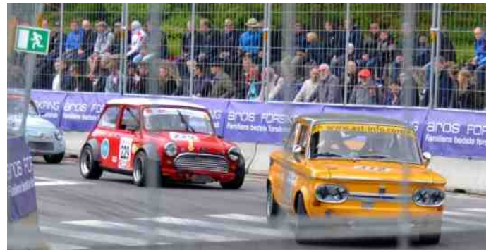
Selvom det er klassiske biler, så bliver der gået til den.

Vi flyttede os rundt, så vi så det fra flere vinkler. Nogle af bilerne larmede godt nok meget. Især en Ferrari, den lød helt fantastisk og højt!