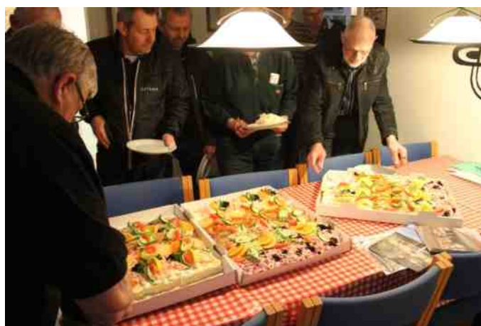
"Projektgruppen Aalestrup ApS" var vært ved pålægskagemand efter besøget.

Efter et vellykket besøg hos Projektgruppen, og en frisk gåtur tilbage til klubhuset, var kaffen klar, og Projektgruppen var vært ved pålægskagemand til os.