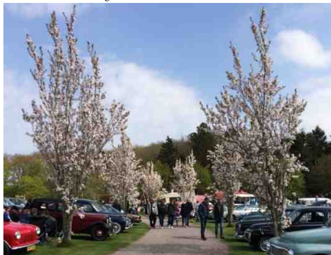
Flotte biler i skønne omgivelser.