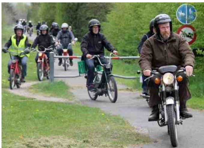
Et lille udsnit af de 55 knallerter.

Da de mange knallerter startede op, kan man vel nemt forestille sig at det mindede om et gasangreb. Hele pladsen var total indhyldet i blå røg - der blev sendt røgsignal om, at nu kommer vi.