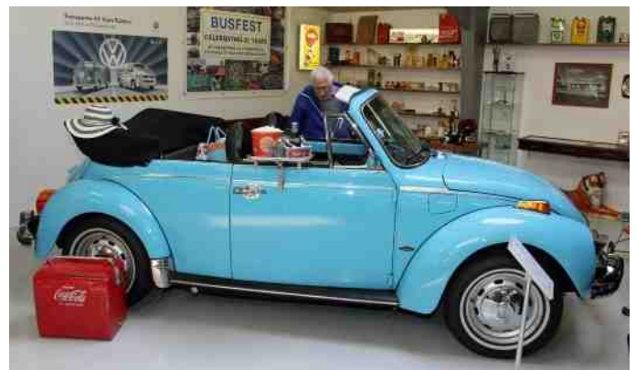
Redaktørens far er tydeligt interesseret i denne fine Folkevogn cabriolet.