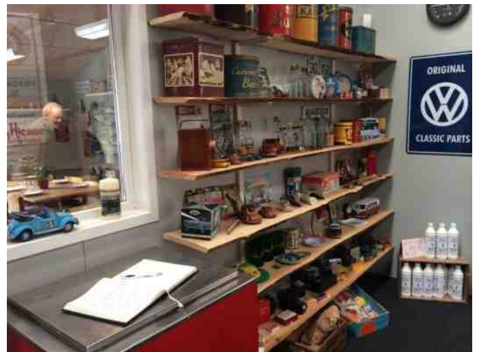
Flere af de mange sjove retro ting, samt museets gæstebog.

Alle biler bliver der selvfølgelig kørt i.