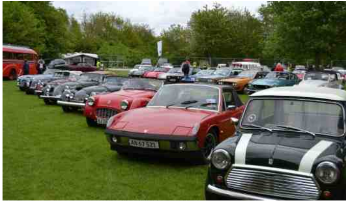
Nogle af de mange klassiske biler, der var udstillet.

Vi var 3 medlemmer fra Aalestrup Classic, der benyttede os af køreligheden. Det var ud over undertegnede, Aage og Stig. Vi havde en rigtig hyggelig tur med god forplejning under vejs.