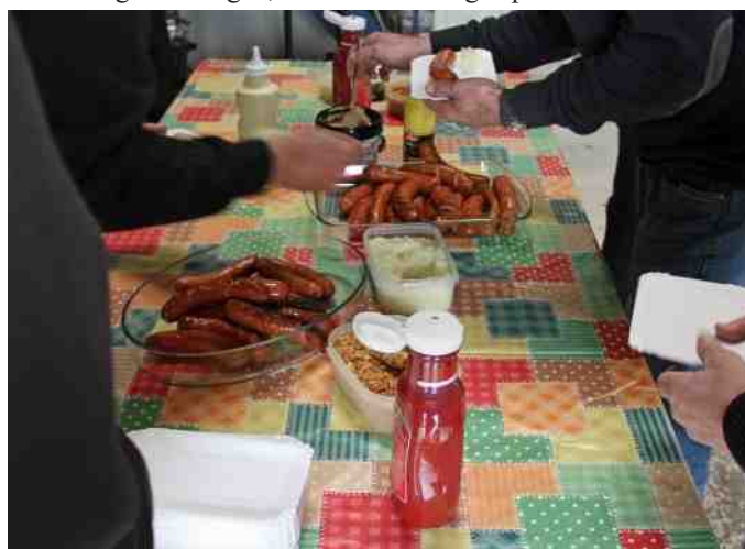
Efter turen var der grillpølser til alle.

Efter mange af os igen havde læsset knallerterne på trailere, ladbiler og kassevogne, så var de lækre grillpølser klar til os.