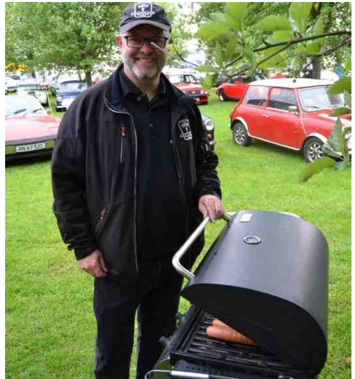
Undertegnede fik lov at passe grillen.

Vejret var lige, som det skulle være. Ikke for varmt og ikke for koldt, så det kunne ikke blive bedre. Det var en utrolig god oplevelse, og et meget smukt område, de har lavet det i.