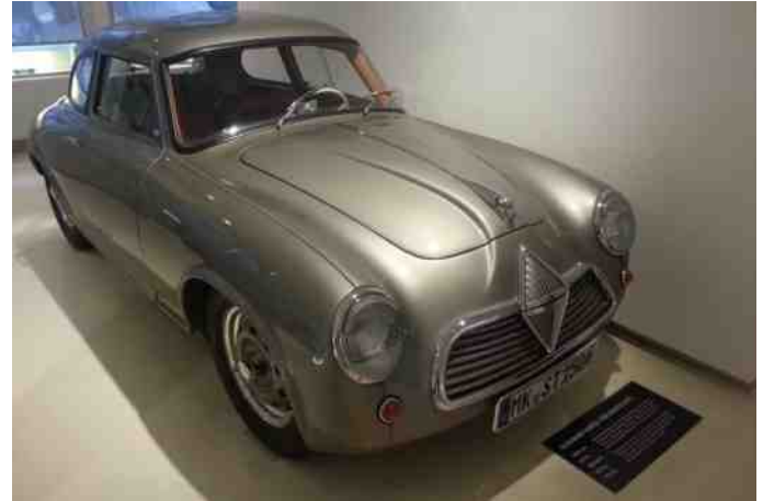
Borgward Hansa 1500 Sportcoupé fra 1954.

Det er vigtigt at bemærke ordet "lille" i sætningen ovenover, da samlingen er ganske lille, og derfor ret hurtigt set. Det er også derfor jeg syntes besøget var noget skuffende, da jeg havde forventet mere.