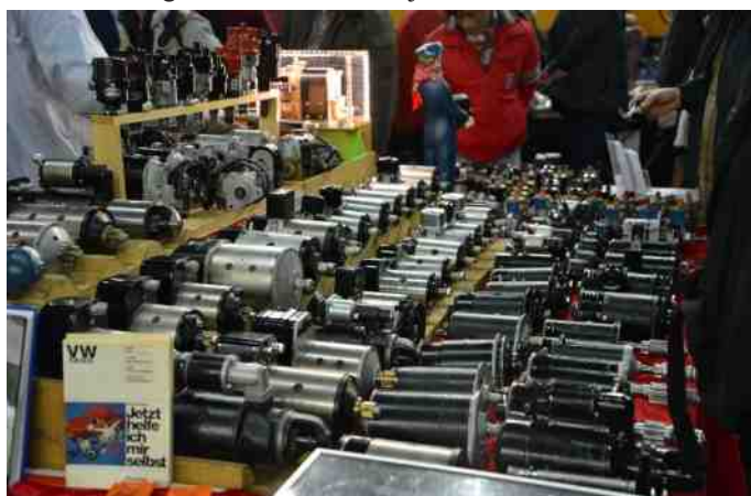
Massevis af selvstartere.

Der blev dog snart fyldt op med mennesker i de mange haller. Messen er en blanding af stande med stumper, bilforhandlere og klubber, der gør meget ud af at gøre deres stand spændende. Det kunne vi godt lære lidt af her hjemme.