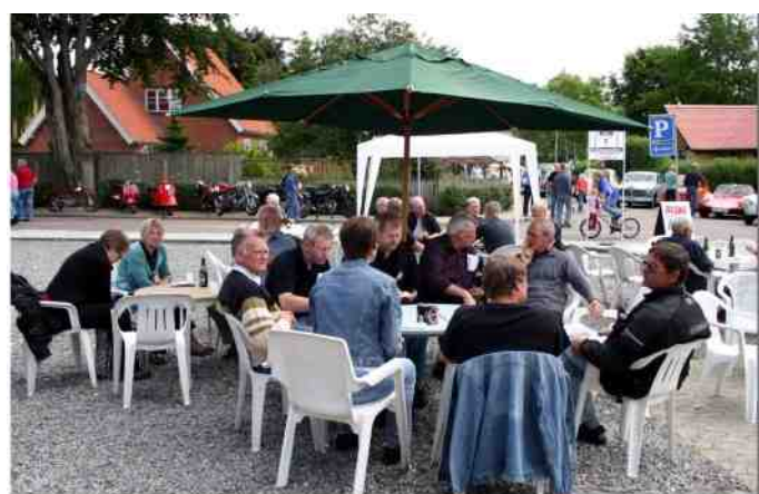
Billede fra Classic Træf 2008.

Det var hyggeligt, men pladsen var for trang. Da Ove Haubro så startede med hans veteranlastbilstræf på en større plads ved LEOKA ude på Borgergade, ja, så var det jo indlysende, at det var der vi fremover skulle afholde vores lokale træf.