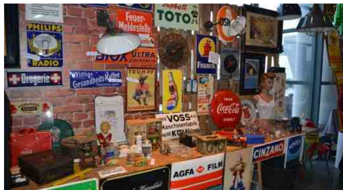
Emaljeskilte var der også masser af.

Vi gik rundt i mindre grupper på 2-3 stykker eller alene, alt efter hvad man nu var til. Man når selvfølgelig mest, når man går alene, men det er nu også hyggeligt at dele oplevelserne med nogen. Der er jo masser at være imponeret af i løbet af dagen.