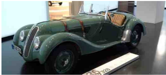
BMW 328 fra 1936.

Rolls Royce har også en stor udstilling af deres biler i en sidebygning ved BMW museet, hvor man virkelig får set, hvordan håndværket blev udført helt fra bunden af.