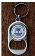
Oplukker: 20,- kr