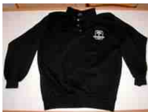
Trøje: 160,- kr.