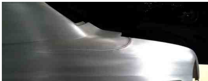
Svejsning på skærm.

Så kommer I i nærheden af München, så kan vi klart anbefale et besøg på BMW Welt og museum.