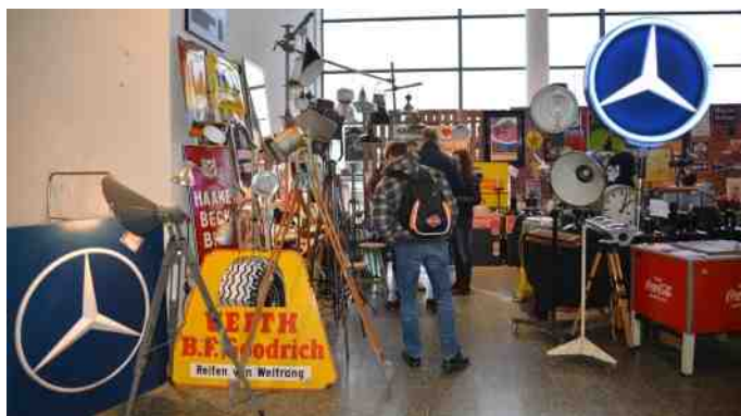
Alt i lyskilte og lamper.

Vi var blandt de første par hundrede, så der var rimeligt rolig det første stykke tid.