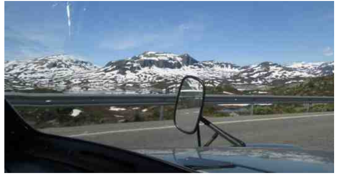
Norge har en flot natur.

Vi havde bestemt at turen skulle gå videre med Kinsarvik Camping som næste stop. Da vi kørte, var der mange ting, som ikke er som i Danmark. Der var flere gange, hvor jeg måtte ned i andet gear, men når man kiggede ud, så det ud som om vi kørte ned ad, men vi kørte i virkeligheden op ad. Jeg tog et kig på instrumenterne, men alt var okay, det var blot synsbedrag. Vi kørte og kørte ad E134, men pludselig var vejen spærret af ved en tunnel. Der var en følgebil, som ledte os i hold uden om. Jeg tror det var en sti, som ræven havde brugt, men den var dog godt nok asfalteret. Vi kom op til vej 13 mod Odda, og så var freden forbi. For det første var vejen smal, og for det andet var den fuld af skarpe sving. Vi måtte næsten holde stille, hver gang vi mødte en lastbil eller bus. Det skete tit, at der kom modkørende.