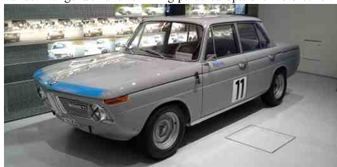
BMW 2000 TI racerbil.

BMW har altid kørt motorløb, så derfor er der også en stor udstilling med mange af deres tidligere racerbiler, som har vundet mange løb rundt omkring på de europæiske motorbaner.