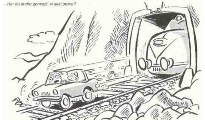
- Har du andre genveje, vi skal prøve?

Hvordan vil de kunne bevise, at De ikke har kørt for stærkt? spurgte motorcykelbetjenten. Jeg kan bevise, at jeg skal til middag hos min svigermor.