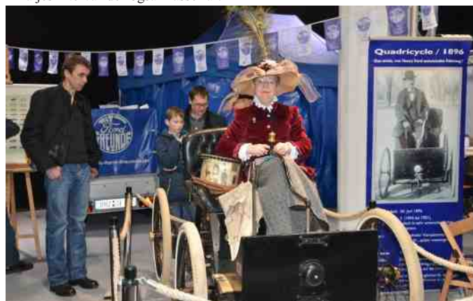
Damen i bilen er levende. Vi må ikke håbe at hun skulle sidde der hele dagen.

Hvad stumper angår, og biler for den sags skyld, så skal man ikke gøre sig nogen illusion om, at finde et godt og billigt køb i Bremen. Det koster nogenlunde det samme i Euro, som vi helst vil give for det i kr. her hjemme. Til gengæld kan næsten alt findes der.