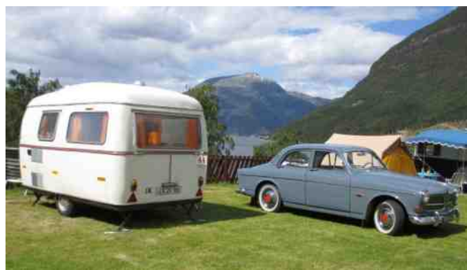
Volvoen og campingvognen i den skønne norske natur.

Vi blev færdige til at vi kunne køre fra Åmot Groven camping. Vi skulle lige have handlet ind til de sidste par dage, så vi gik i Rema1000, og vi fik tanket benzin. Da vi kørte ned ad igennem Norge besluttede vi os for at dreje fra på vej 38. Vi kom ned af vej 134, og vi var lige ved at fortryde, da vi så vejene, men den var nu ganske god, og der var en fantastisk udsigt. Vejen gik op og ned, og vi fandt en hyggelig rasteplads, hvor vi spiste til middag. Efter en times tid kørte vi videre. Der var kønt og vi kørte frem til vej 335, som vi vil tage, da den anden vej var gået godt. Vi kørte og kørte, og på et tidspunkt fik vi øje på en campingplads, hvor vi gerne ville overnatte. Da vi fik fundet den plads, vi havde fået anvist, kiggede vi lidt. Det var en plads helt ned til en sø (kun ca. 2 meter), men det var nu dejligt. På pladsen var der en overdækket terrasse, hvor vi kunne grille, og sidde og spise. Vi gik en tur i området, og gik så til ro.