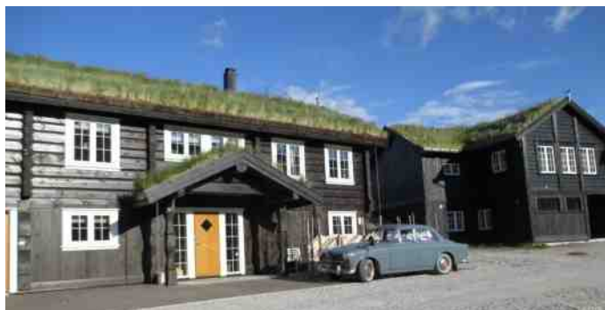
Amazonen foran den gamle købmandsgård.

Derefter skulle vi hjem og grille. Det blev en god aften, og igen havde jeg mine høreapparater på, så det var luksus med at høre, hvad der blev sagt. Der var amerikansk lotteri, hvor man fik en hel blok i en farve. Det var sponsorgaver, og der var mange af dem, men vi vandt ikke noget. Aften sluttede for nogle kl. 23.00, og for andre lidt senere.