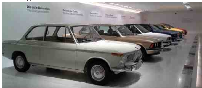
BMW 2 serie.

Længere rundt i udstillingen kommer den populære 2 serie, som senere bliver 3 serie i 1976, opstillet på række, så man kan se udviklingens forløb i den samme bilmodel i over 20 år.