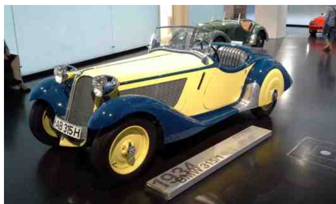
BMW 315/1 fra 1934