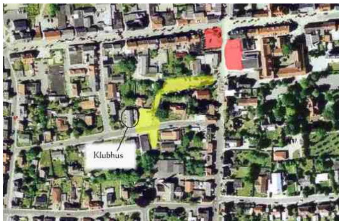
Det var her det startede for 10 år siden.

Tænk at det allerede er ti år siden vi lavede det første lille træf omkring klubhuset på Vandværksvej. Pladsen var trang og vi brugte både Vandværksvej og parkeringspladsen mellem Torvet og klubhuset for at vi alle kunne være der.