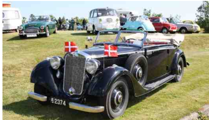
Billede fra Classic Træf 2009.

Det var hyggeligt, men pladsen var for trang. Da Ove Haubro så startede med hans veteranlastbilstræf på en større plads ved LEOKA ude på Borgergade, ja, så var det jo indlysende, at det var der vi fremover skulle afholde vores lokale træf.