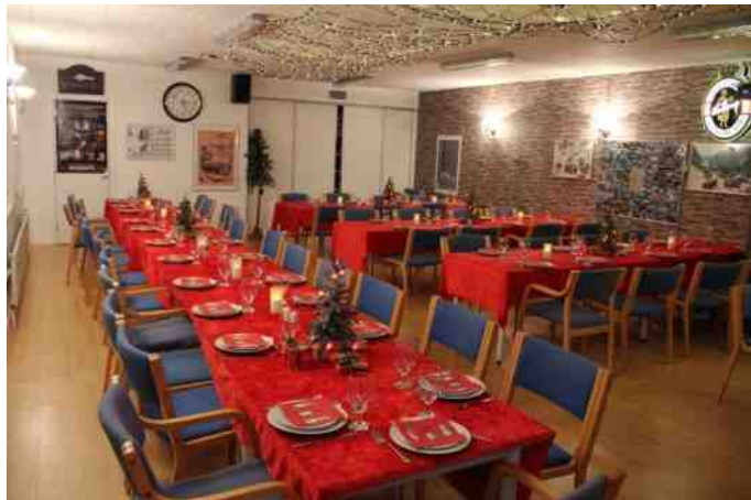
Bordene var fint pyntet.

Julefrokosten plejer altid at være et tilløbsstykke, men denne gang var der 12 pladser ledige. Hvorfor vides ikke, men formanden mente, at det var fordi han ved en fejl, var kommet til at bestille grønsagstærte, og at det havde skræmt nogen væk. 😊 Der var som sædvanligt pyntet fint op med røde duge og andet julepynt, så julerammerne var i orden.