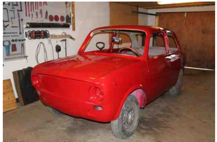
Helges Fiat 850 i Februar 2015.

Motoren har der også været en del arbejde med, men nu lysner det. Bilen blev sendt til maler sidst i januar måned, og ca. 14 dage senere, stod der en nymalede Fiat i garagen.