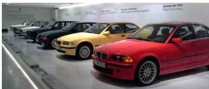
BMW 3 serie.

BMW har altid kørt motorløb, så derfor er der også en stor udstilling med mange af deres tidligere racerbiler, som har vundet mange løb rundt omkring på de europæiske motorbaner.