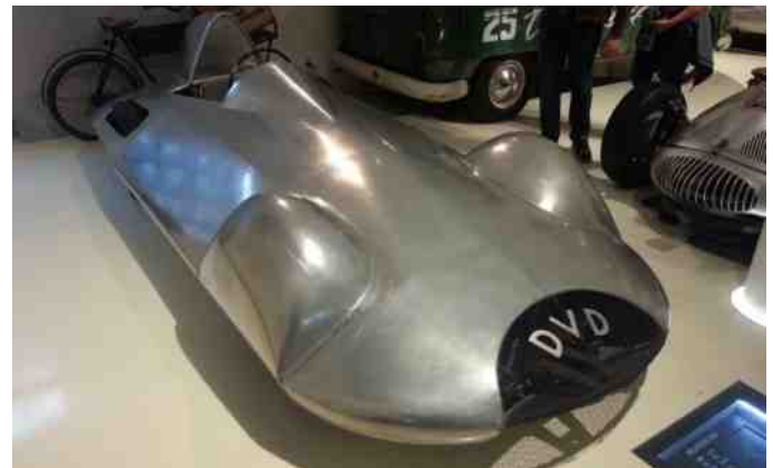
Delfosse DVD fra 1947.