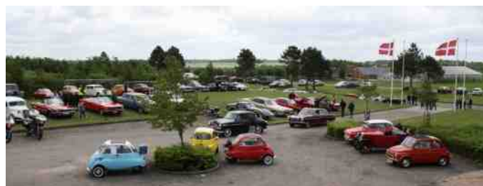
Billede fra Classic Træf 2010.

Det syntes vi var var et godt valg, i hvert fald er der både kommet flere køretøjer og tilskuere til i årenes løb.