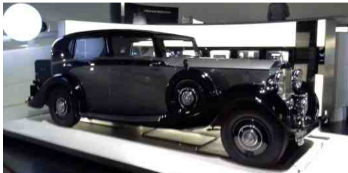
En af de mange fine Rolls Royce modeller.

Rolls Royce har også en stor udstilling af deres biler i en sidebygning ved BMW museet, hvor man virkelig får set, hvordan håndværket blev udført helt fra bunden af.