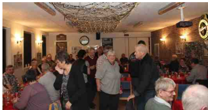
Pakkespillet er i gang.

Traditionen tro var der også pakkespil, og denne gang var det placeret før desserten, så vi kunne få lavet plads til risalamanden