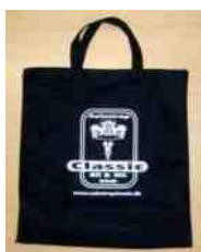
Mulepose: 50,- kr.