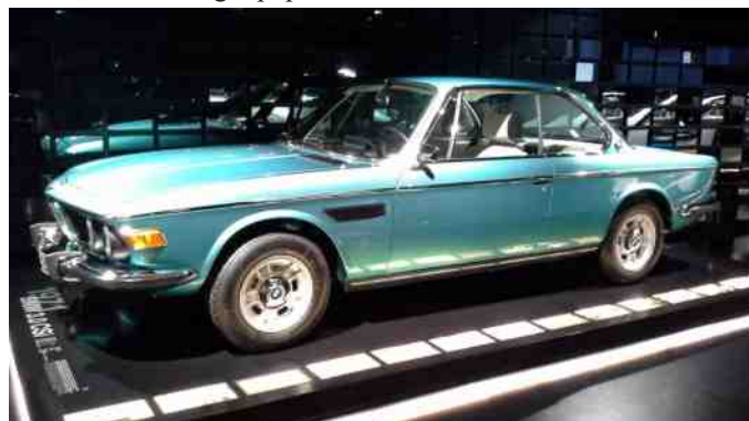
BMW 3,0 CSI fra 1971.

Udover racerbilerne, har BMW som bekendt også mange sportslige modeller, som tiltrækker folk med hang til at komme hurtigt afsted hen over asfalten. ☺ Blandt andet den meget fine 3,0 CSI, som var forløberen for 6-serien, som er meget populær blandt BMW-entusiaster.