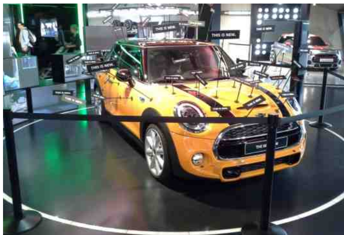
Mini står ikke tilbage med at fortælle hvilke dele, der er nydesignede.

Mini One findes i mange specielle udgaver og med mange farvesammensætninger, og man kan selv sætte det hele sammen, som man har lyst til. Hvis man døjer lidt med at få det hele til at se fornuftigt ud, så står der mange rådgivere parat med hjælp til de sidste designmæssige råd, så man kan få lavet en bil, der trods alt kan sælges igen. ©