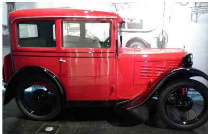
BMW personvogn fra 1930erne.

Motorcyklerne har en stor glasmontre på den ene gavl, hvor de starter med de ældste øverst, og så bevæger sig nedad i etager mod de nyeste modeller.