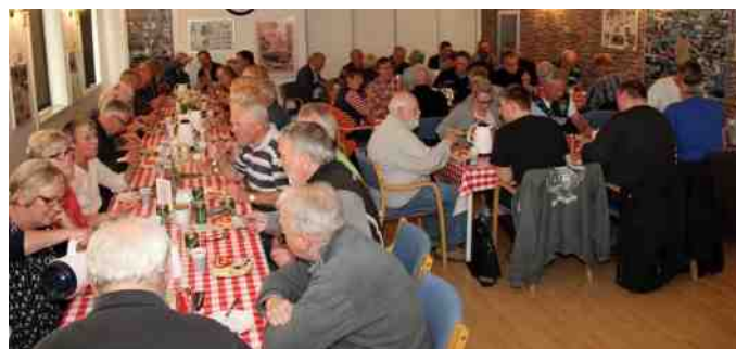
Billede fra sidste års generalforsamling.

Indkaldelse til ordinær generalforsamling i Aalestrup Classic Bil & MC Klub 2015.