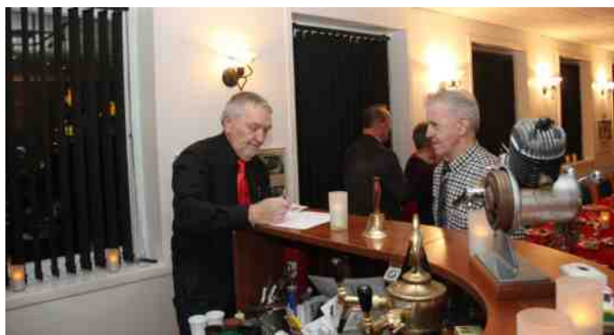
Aage tager imod betaling.

Stemningen plejer heller ikke at fejle noget, og på trods af det lidt mindre antal personer, så var den også i top denne gang. Det plejer jo også at være til julefrokosten at Fiduspokalen bliver uddelt, men der var ikke nogen, der havde gjort sig fortjent til den i år.