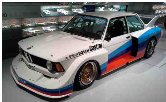
BMW 320 racerbil.

Udover racerbilerne, har BMW som bekendt også mange sportslige modeller, som tiltrækker folk med hang til at komme hurtigt afsted hen over asfalten. ☺ Blandt andet den meget fine 3,0 CSI, som var forløberen for 6-serien, som er meget populær blandt BMW-entusiaster.