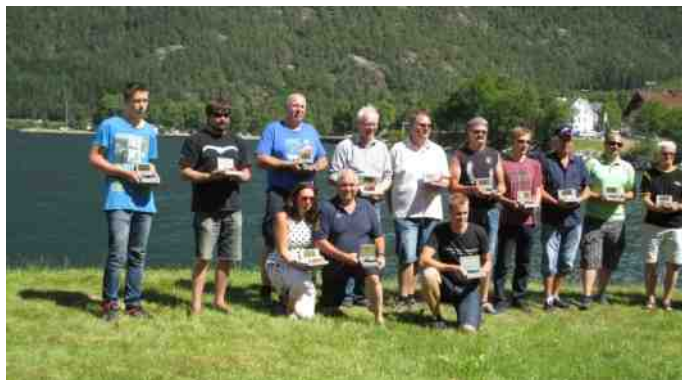
Alle vinderne stillet op til fotografering.

Søndagen blev en hård dag, da jeg startede allerede kl. 8 med at få vasket bilen. Kl. 10 skulle alle volvo'erne der deltog i træffet være udstillet. Der var 59 biler som opstillede i forskellige klasser: original, ombygget og andre klasser. Der var en dommergruppe, som skulle se på de forskellige biler. Kl. 14.30 var dommerne færdige, og dem der havde vundet blev kaldt til infotellet. Jeg blev kaldt op til en flot anden plads i originale biler. Jeg vandt en granitsten med en mini volvo og et emblem med træffet. Alle, der havde fået en gevinst, blev samlet til fotografering.