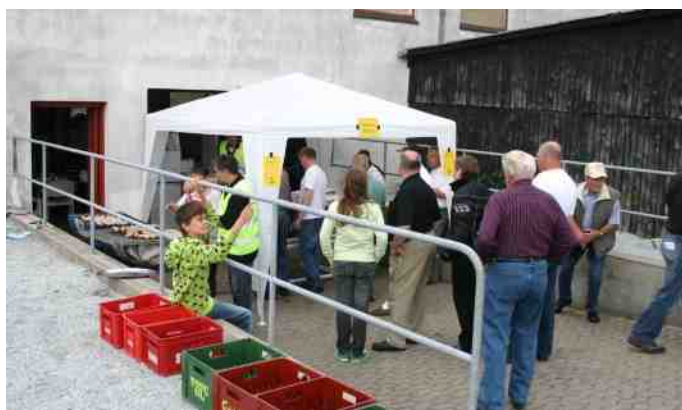
Billede fra Classic Træf 2007.