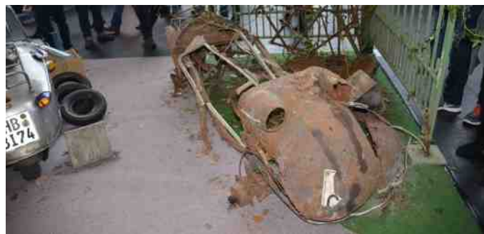
Det var ikke alt der var guld, der var også noget i rust.

Hvad stumper angår, og biler for den sags skyld, så skal man ikke gøre sig nogen illusion om, at finde et godt og billigt køb i Bremen. Det koster nogenlunde det samme i Euro, som vi helst vil give for det i kr. her hjemme. Til gengæld kan næsten alt findes der.