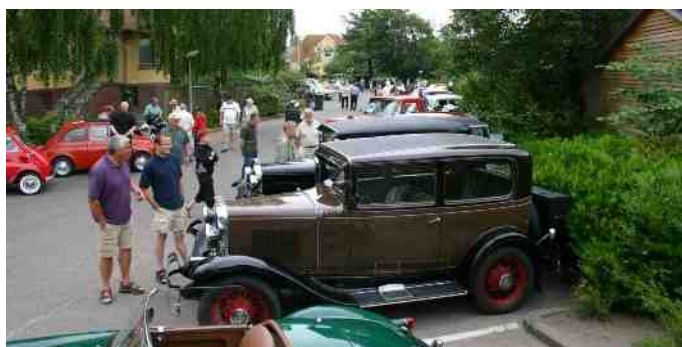
Billede fra Classic Træf 2006.