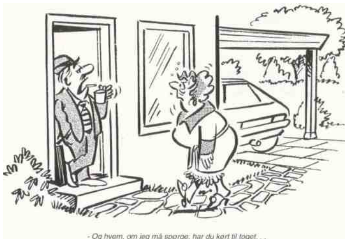
- Og hvem, om jeg må spørge, har du kørt til toget. . .

Hvordan går det med køretimerne? Det går da fint. Jeg venter spændt på hvornår vi skal lære at rulle vinduet ned og råbe "Sjover!" til de andre bilister.