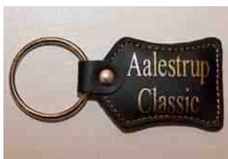
Nøglering: 25,- kr