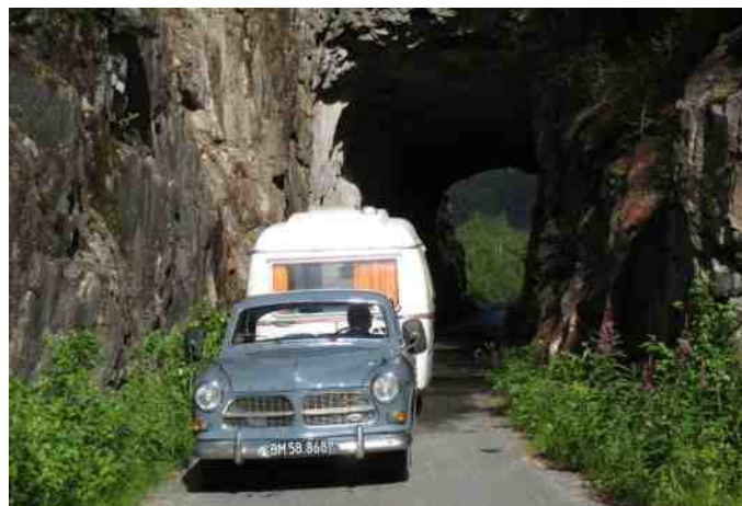
Amazonen i flot symfoni med de Norske klipper.