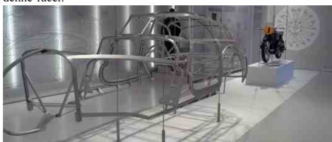
Rørramme før beklædning.

Motorcyklerne er udstillet i glasmonter på den ene gavl af bygningen. BMW har altid gjort meget i letvægtsmaterialer i bilerne, og det begyndte allerede omkring 1930, hvor denne rørramme var lavet i aluminiumsrør, og siden beklædt med aluminiumsplader til denne racer.