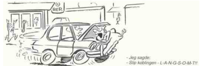
- Jeg sagde: - Slip koblingen - L-A-N-G-S-O-M-T!!

Jamen kan de da slet ikke finde noget godt at sige om automobilen? spurgte vor udsendte medarbejder formanden i "Tilbage til naturen". Jo, sagde han efter kort betænkningstid, den har da nedsat antallet af hestetøyerier betydeligt.