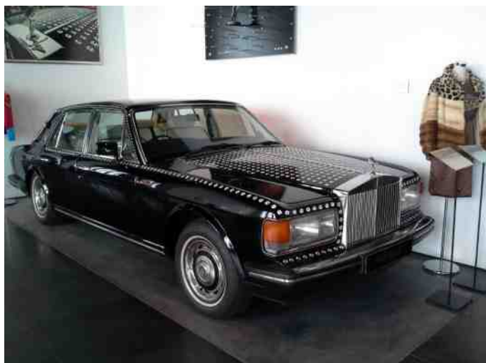
Rolls-Royce fra 1985 - 8 cyl, 200 hk, 6700cc.