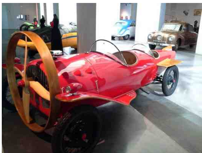
Helicon 2 fra 1932.