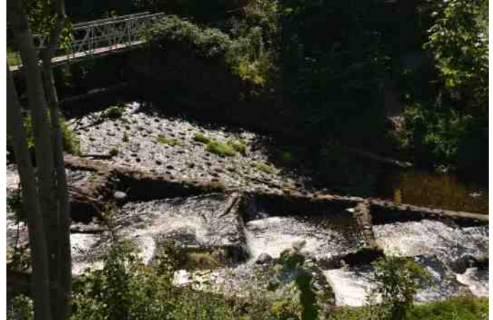
Flot syn ved fisketrapperne.