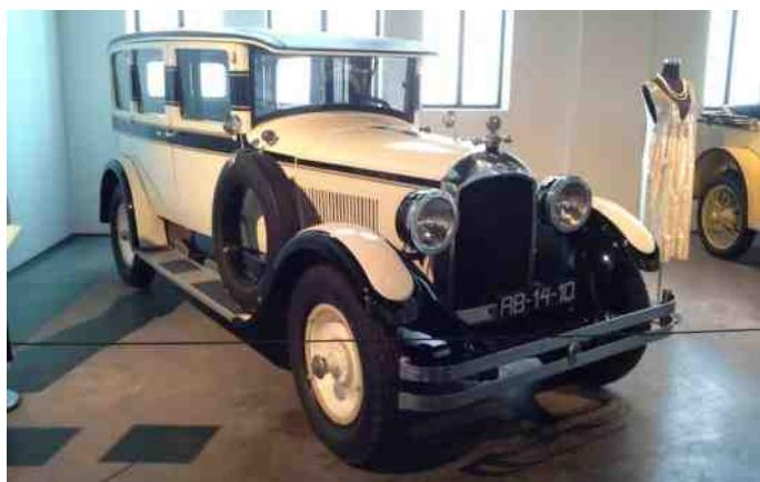
Mercedes 540K - 8 cyl, 180 hk, 5499 cc.

Den mest værdifulde bil i kollektionen. Der blev kun produceret 447 biler af denne model, og i dag er kun 50 af dem kendt. Det er en tysk bil, der blev brugt af Nazi-Tysklands ledere. Den der er udstillet på Museo Automovilístico Málaga, er den som transporterede Heinrich Himmler på hans bryllupsdag.