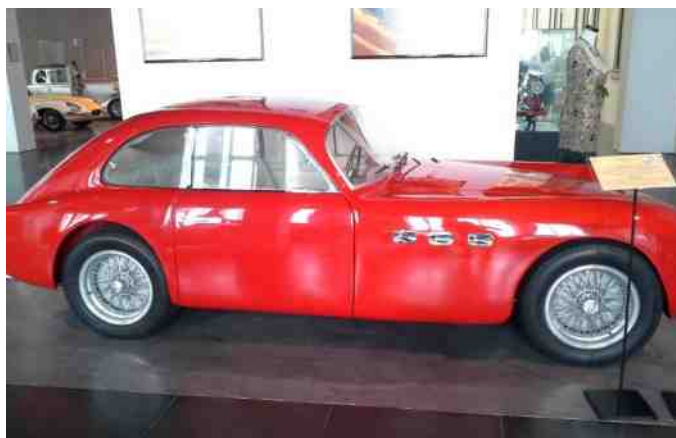
Maserati Italia fra 1950 - 6 cyl, 65 hk, 1500cc.