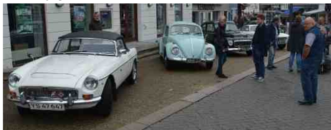
"Felix" (Pigalops MG) var linet fint op.

Jeg var blevet spurgt af handelschefen i Viborg, om jeg kunne samle nogle biler, til at udstille lørdag den 15. august 2015. Ja, selvfølgelig kan jeg det. Men det var da ikke sådan lige, da der var byfest i Farsø, og mange faktisk stadig var på ferie. Men det lykkedes mig da at samle 18 biler og 31 personer til denne lejlighed.