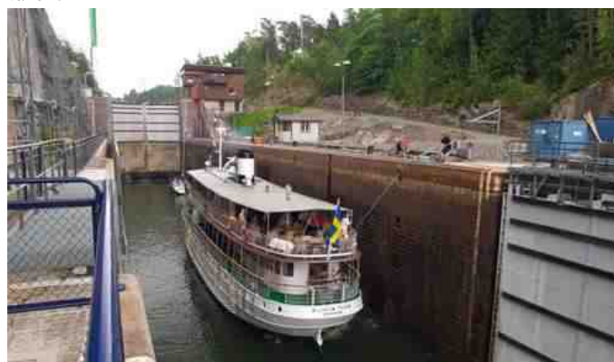
Sluserne ved Trollhättan.

Jeg er kommet i Trollhättan til træf siden 1991, så jeg kender området godt, og glæder mig lige meget hvert år, når vi skal der op. Med alle mine gode oplevelser i området, tør jeg godt være guide på en spændende weekendtur til dette dejlige område. Trollhättan er et fantastisk spændende område, der blandt andet byder på sluser, dæmning, SAAB museum, svævebane og meget andet spændende, for slet ikke at tale om naturen. Planen er at vi skal bo i hytter på Stenröset camping, få km uden for Trollhättan by. Den er en fin base til de ting, vi skal se på turen.