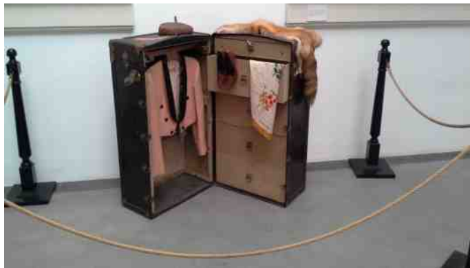
Tidstypisk kuffert og tøj.

Museet består af enten specielle biler eller biler, der har en speciel historie, og det kan være ejerens historie, eller en meget kendt personlighed/gruppe. Dertil er der en del udstillet tøj, kufferter og andre tidsrelaterede ting, så man kan se sammenhængen fra bilerne over til de materielle goder, der fandtes på dette tidspunkt.