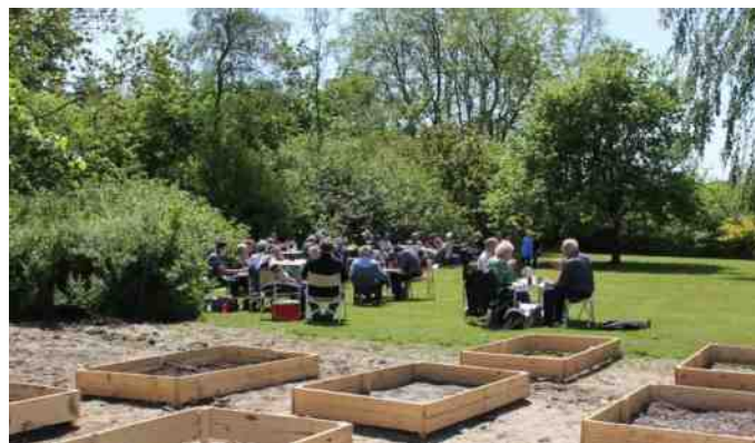
Middagsmaden blev indtaget i haven ved en nærliggende børnehave.