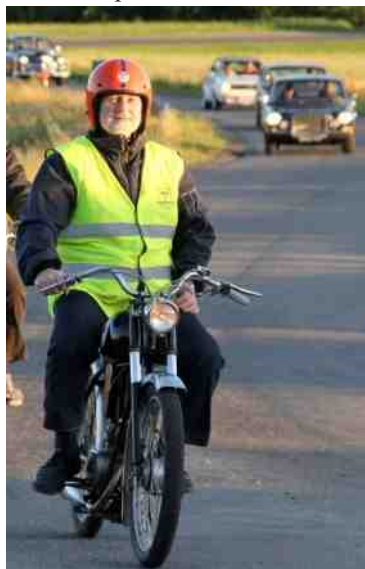
Knallerter og biler i fælles trop.

Da vi ankom, var de fleste allerede ankommet, og holdt klar i en lang række. Jeg fik knallerten af traileren, og sluttede mig til de fire andre på knallerter.