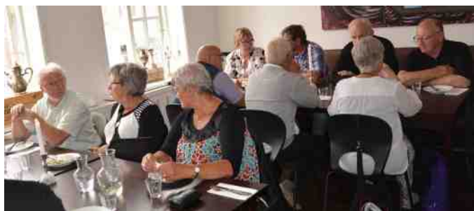
Frokost på "For Enden af Gaden".

Der blev shoppet og hygget rundt omkring. Da folk først var vågnet i Viborg, var der også stor interesse omkring bilerne. Vi fik frokost for at udstille, og den blev serveret kl.12:00 på "For Enden Af Gaden".