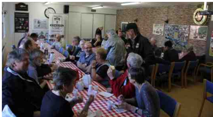
Morgenkaffe med rundstykker sponsoreret af Arne Bach Pedersen VVS.

Vi mødtes kl. 9.00 i klubhuset til kaffe og rundstykker, der var sponsoreret af Arne Bach Pedersen VVS, som også har lavet det biogas anlæg, vi så senere på dagen.