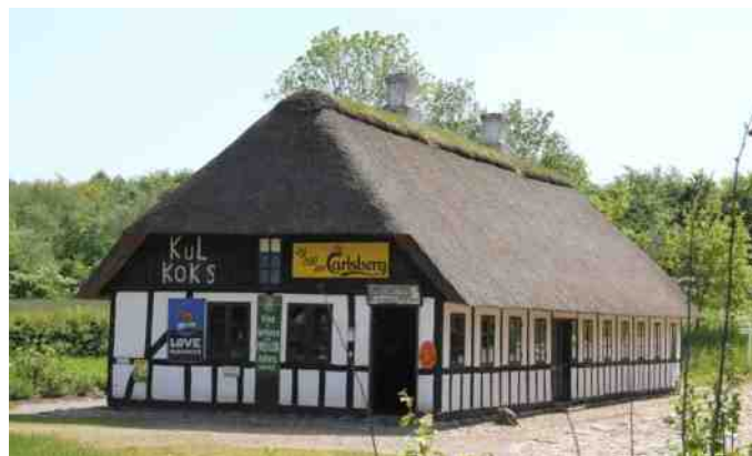
Købmanden på Hjerl Hede.

Nogle fik set lidt af bygningerne, men vi var ved at være godt brugte, så kl. 16:00 var der opbrud. "Den gamle grønne" tog kurs mod Sundsøre, så vi var hjemme kl. 17:45.