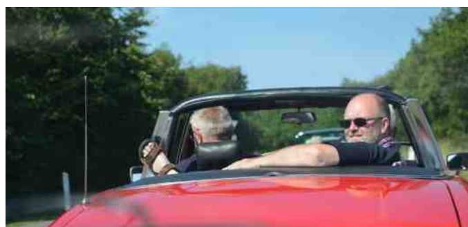
Formanden havde overladt kørslen til kasereren, så han kunne slappe af på bagsædet.