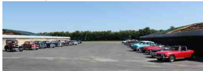
Der var ryddet en køresilo, hvor vi parkerede vores biler under rundvisningen.

Vi var 37 biler med på turen, og efter rundvisningen kørte vi lidt ned af vejen til en børnehave, hvor vi indtog haven, og spiste vores medbragte mad.