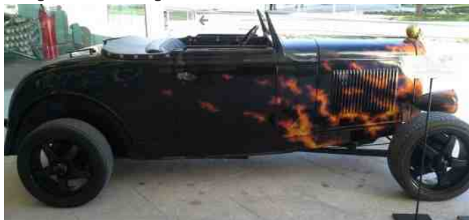
Ford fra 1929 - 4 cyl, 50 hk, 3300 cc.

Stedet hedder: Museo Automovilístico Málaga, og har egen hjemmeside ( http://www.museoautomovilmalaga.com ), og det ligger i den sydvestlige del af byen. Der er gratis parkering ved museet, men det er et helvede at finde parkering i resten af byen, så tag det lokale S-tog, der har station ca. 1,5 km fra museet.