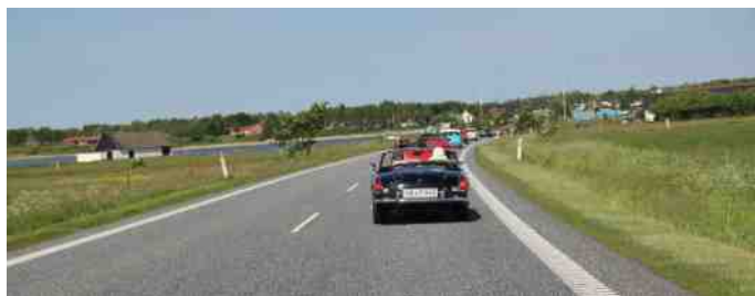
Vejret var fantastisk, da vi passerede dæmningen ved Virksund.

Kl. 9.30 var der afgang mod Skive ad små veje, så vidt det var muligt.