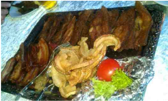
Stegt flæsk fra Biersted Kro.

Det er efterhånden blevet en noget forlænget weekendtur. Fra start var det fra fredag til søndag, men Einstück og jeg, begyndte at tage til Grønhøj torsdag, for at have en dag ekstra. Der begyndte så at dukke flere op om torsdagen, så nu tager vi afsted onsdag. I år var vi 14 fra onsdag. Vi mødtes ved Aggersund Broen, på nordsiden og spiste vores madpakke der. Dejligt solskin og lidt vind. Vi fortsatte i samlet trop, op gennem Tingskoven og videre på mindre veje forbi Fosdalen, Rødhus og videre til Saltum. Vi ankom til campingpladsen og fik anvist vore hytter. Vi flyttede ind og fik en kop dejlig kaffe. Onsdag aften tog vi på Biersted Kro, hvor de laver det mest fantastiske stegte flæsk. 3 variationer. MUMS.