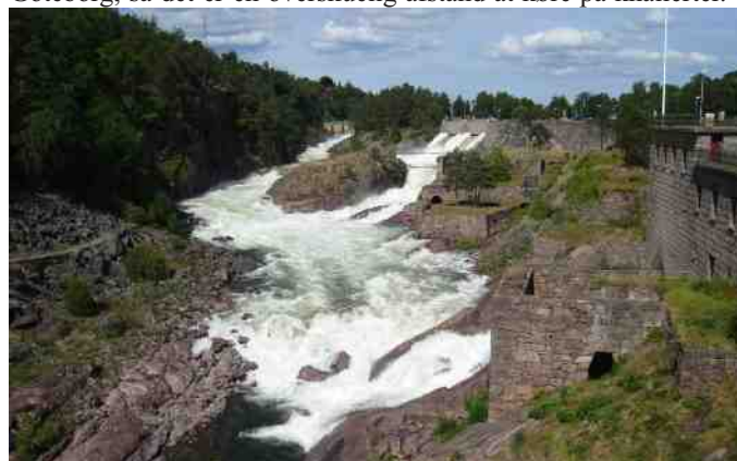
Vandfald ved sluserne ved Trollhättan.

Næste år i den sidste weekend i august bliver der en knallerttur til den svenske by Trollhättan. Den ligger ca. 80 km nord for Göteborg, så det er en overskuelig afstand at køre på knallerter.