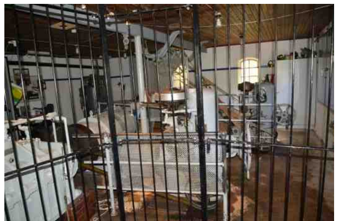
Det gamle elværk.