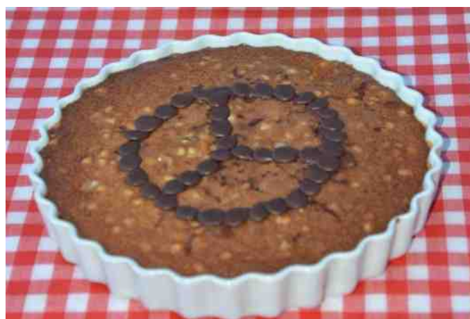
Louise's forældre var blevet bildt ind, at nye medlemmer skal have kage med, så de stillede med et par flotte Mercedes kager.