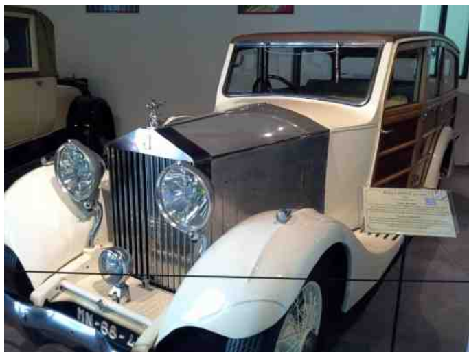
Rolls-Royce fra 1927 - 6cyl, 50 hk, 3100cc.

Det britiske aristokratis yndlingsbil til jagtture! Modellen var især en stor succes blandt kaptajnerne i den britiske koloni i Indien, som – tro det eller ej – brugte den til at jage bengalske tigre i.