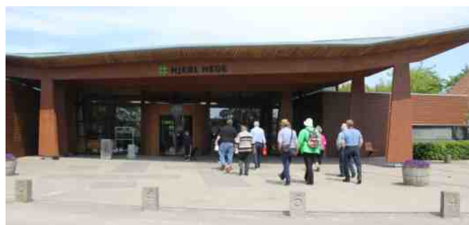
Indgangen til Hjerl Hede.