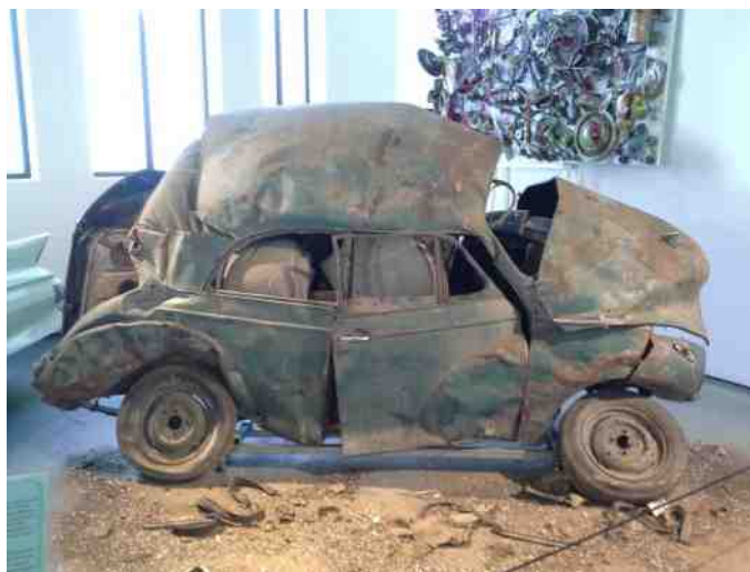
Det er ikke alt på museet der skinner. Her en Morris Minor, der trænger til en hånd.