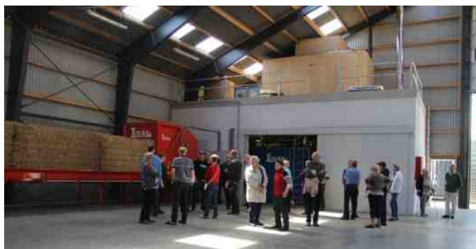
Der skal bruges en del varme til at lave biogas, så anlægget har sit eget halmfyr.

Vil man vide mere om anlægget kan der findes meget god information her: http://www.madsenbioenergi.dk