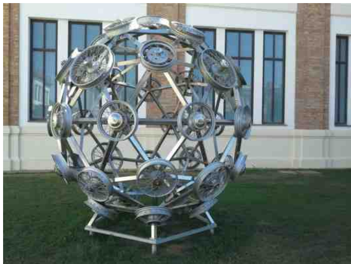
Skulptur ved indgangen til museet.

På søgningen dukkede et lidt specielt bilmuseum op, så det måtte vi jo undersøge nærmere, inden vi helt forlod landet.