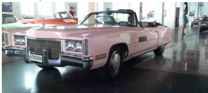
Cadillac El-dorado fra 1959.

En af kollektionens kronjuveler. Ingen anden bil repræsenterer "The American way of life" bedre, og denne model var da også Elvis Presleys favorit model.