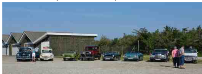
Udstilling på campingpladsen før køreturen.