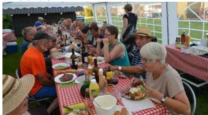
Fredag aften var der fælles grill hygge.

Der var 6 af dem, der kom onsdag, der kørte hjem fredag. Men så kom der jo en masse nye folk. Vi var 26 til grill fredag aften. En rigtig dejlig aften i teltet.