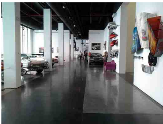
Indblik i den store udstilling.

Hver bil, sin historie, som du kan læse på spansk og engelsk ved bilerne. Det er også muligt på forhånd at arrangere en guidet tur.