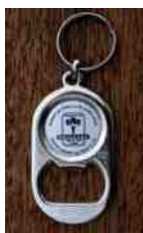
Oplukker: 20,- kr