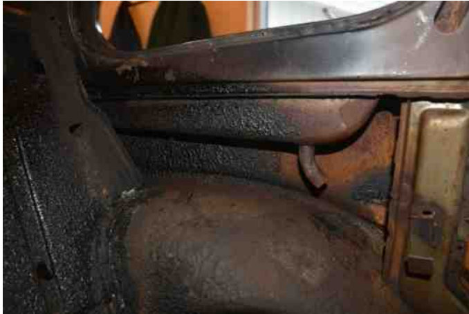
"Tagrenden" under sideruden.