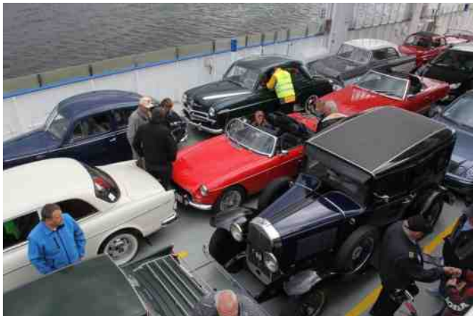
De klassiske køretøjer fyldte godt op på færgen.

Allerede sidste år ville jeg lave en tur til Limfjordsøen Fur, men tiden løb fra mig, så det blev i stedet i år. Det var jo nok heldigt nok, for vejret var igen med os. Det var en kombineret knallert/MC/Bil tur. Det er ikke så tit det kan lade sig gøre at blande langsomt kørende knallerter med de andre køretøjer, men på denne tur var det oplagt. Der var godt 30 køretøjer, der deltog på turen, deraf 11 knallerter.