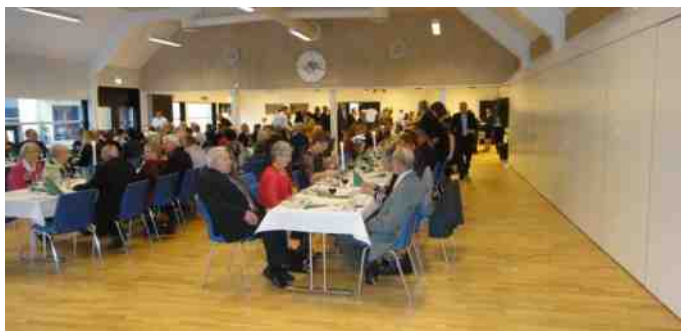
Der var middag for filmfremvisningen.

Alle var klædt i det helt store skrud, hold da op, hvor var alle flotte. Der var inviteret omkring 800 personer, så der var trængsel i Skive Hallerne. En helt fantastisk og flot oplevelse. Os der kom i gamle biler blev linet op foran hallerne, vi var omkring 100 personer fra veteranklubberne. Vi fik serveret en fantastisk flot tre retters menu med vin.