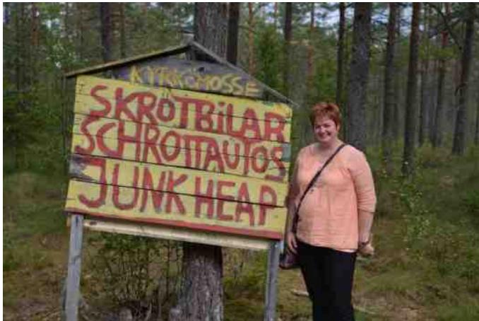
Pigalop ved indgangen til Åke's Bilskrot.

Vi har nogle gode venner, som har hus i Sverige. Huset ligger ca. 20 minutters kørsel fra Ryd, så vi blev inviteret til Sverige, for at besøge Åke's Bilskrot.