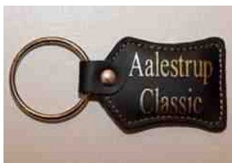
Nøglering: 25,- kr