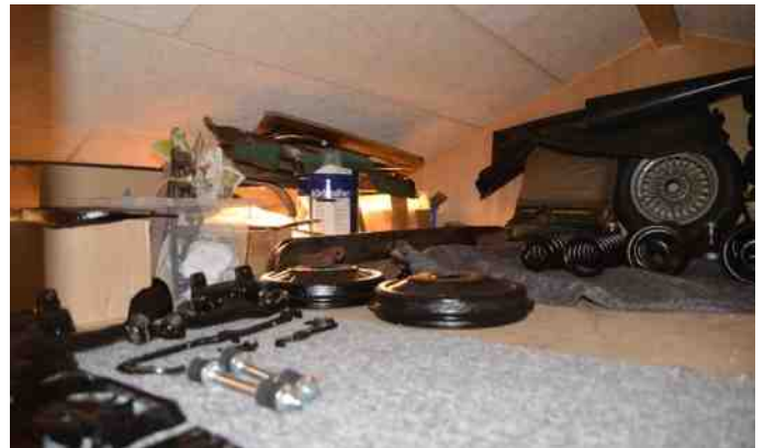
Et lille udsnit af delene på hems.

Der var smådele i 10 giga plastkasser fra IKEA + alle de store dele, som er fordelt rundt om forskellige steder. Godt vi har hems på vores garage.