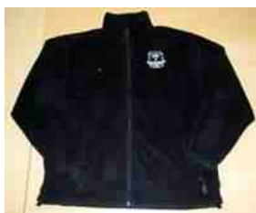
Fleece: 250,- kr.