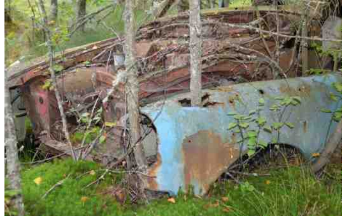
Bilerne har stået længe på pladsen. Læg mærke til træet, der er groet op gennem skærmen.

Folk var begyndt at besøge stedet fra hele landet. De kunne se en ide' med at bevare Åkes bilskrot som et "kulturminne". Det endte i 2001 med at kommunen besluttede, at erklære pladsen bevaringsværdig, og den har nu fået lov til at stå som et minde om en tid, der var, men også som et bevis på altings forgængelighed – ihvertfald frem til år 2050.