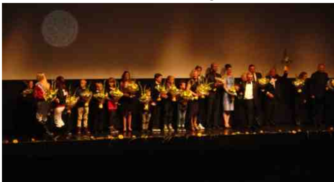
Alle medvirkende fik overrakt blomster efter filmen.

Alle medvirkende fik overrakt blomster på scenen.