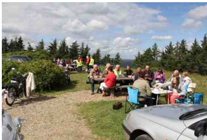
Frokost i det grønne.

Vi mødtes selvfølgelig ind i mellem på vores vej rundt på øen og igen, da der var fælles frokost og kaffe.