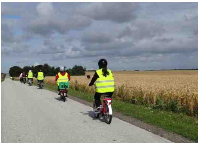
Knallerterne på vej mod Fur.

Vi mødtes ved færgen i Hvalpsund og vi fyldte god op på færgen da vi krydsede sundet. Knallerterne kørte den korteste vej til Fur færgen og bilerne tog den lidt længere tur.