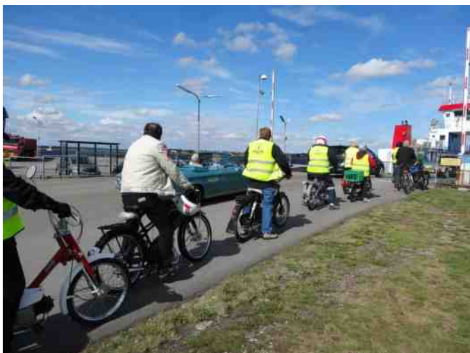
Både knallerter og biler er ankommet til færgen til Fur.

Det betød at der kun var en fæргеafgang mellem os. På Fur kørte vi rundt hver for sig eller i mindre grupper.