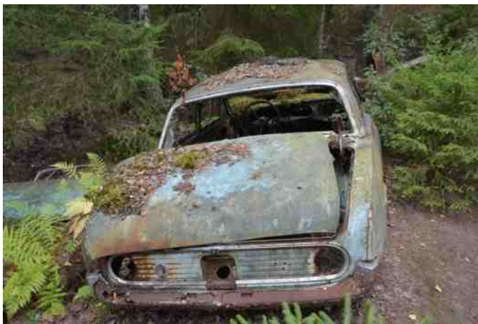
Ensom og forladt står den der i kanten af skoven.

Veteranposten kom med posten den dag, hvor vi skulle køre derop, så vi fik lige nogle gode info inden besøget. Åke var skrothandler. Idag er der ca. 150 køretøjer at se på i området. De sidste biler blev sat der i 1980'erne. Åke flyttede derfra i 1992.