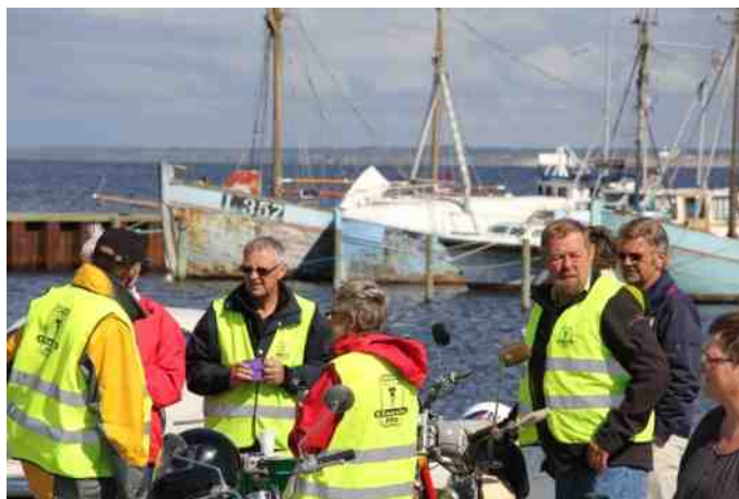
Kaffepause på havnen.

Det betød at der kun var en fæргеafgang mellem os. På Fur kørte vi rundt hver for sig eller i mindre grupper.