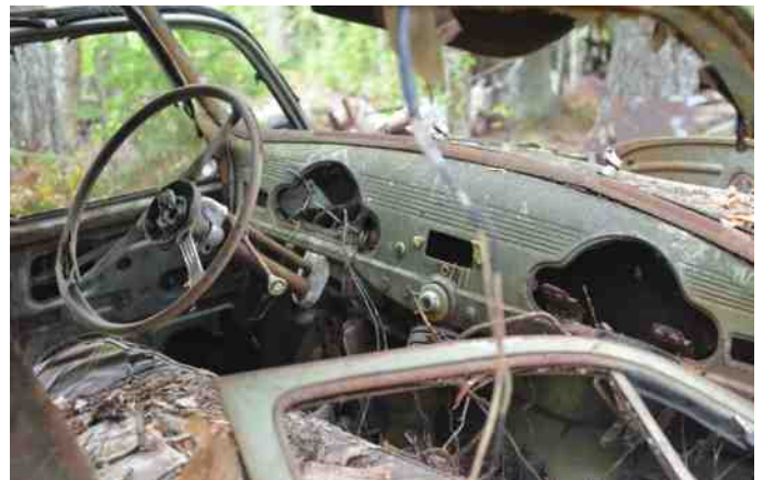
Mange dele er enten solgt eller stjålet.

Bilkirkegård er et rigtig fint ord. Man går ligeså stille rundt på pladsen og ser alle former for biler. Der er ikke nogen løben og råben på denne plads. Man går rundt med respekt for tingene og tænker: "Hold da op de historier de biler ville kunne fortælle os". Der er taget reservedele af mange af bilerne, mange har også stjålet fra bilerne, kan man se. Knapper, kontakter, bilskilte.