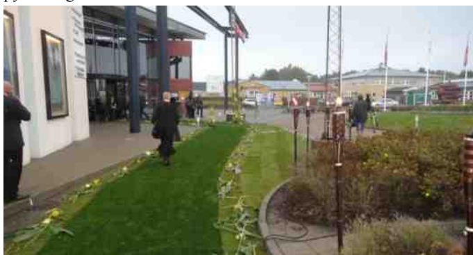
Den grønne løber var lagt klar foran Kultur Center Limfjord.

Herefter blev omkring 20 af de gamle biler sendt ned på hotellet for at hente alle de medvirkende til filmens tilblivelse. Tilbage ved hallerne blev folkene læsset af på den meget smukt pyntede grønne løber.