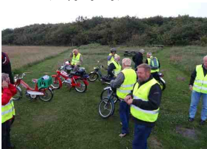
Billede fra 50cc tur fra Hvalpsund den 3 juli 2013.

Nu er den tohjulede sat til side, og den mørke tid er kommet, hvor der er tid til at reparere eller opbygge noget nyt. Vi har haft nogle gode timer sammen med den tohjulede og kammeraterne (både piger og drenge).