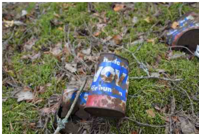
Dåsen med hundefoder.

Der var en tom hundefoder dåse, en gammel fætter, så han har da sikkert haft hund (med mindre han selv spiste det).