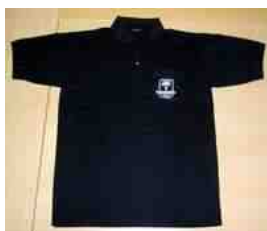
T-shirt: 125,- kr.