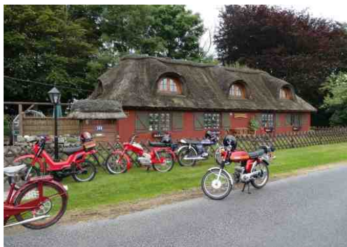
Billede fra 50cc tur fra Hvalpsund den 3 juli 2013.

I 50cc har vi klubaften hver den første onsdag i måneden, hvor vi ønsker god deltagelse af alle medlemmer med knallert.