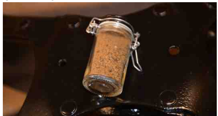
Sandet der lå gemt inde i rammen.

Undervognen fik afmonteret motor, fjedre, gearkasse og det hele blev skilt ad i atomer. Det var tankevækkende, at alle skruer kunne skrues af uden besvær. Inde i rammen var der kommet sand ind. Det var ihvertfald ikke sand fra Danmark, så det må være sand fra Florida. Vi har selvfølgelig gemt det, da det har en speciel farve og konsistens.