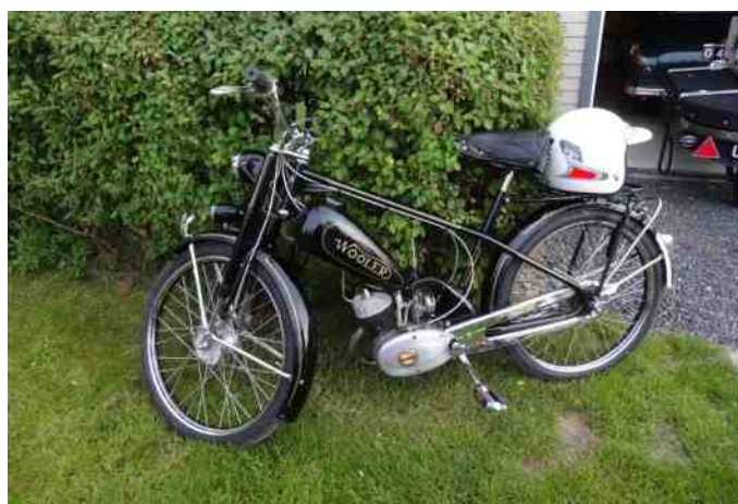
Et fint eksemplar af en Wooler.

I 50cc har vi klubaften hver den første onsdag i måneden, hvor vi ønsker god deltagelse af alle medlemmer med knallert.