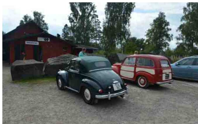
"Fiat klubben" kom på besøg ved stenbrudet.

I forbindelse med besøget i Sverige var vi også henne og se et stenbrug, som har en åre med sort granit, der exporteres til hele verden. Da vi skulle til at derfra, kom der en veteranbilklub "Fiat klubben" på besøg.