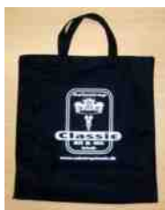
Mulepose: 50,- kr.