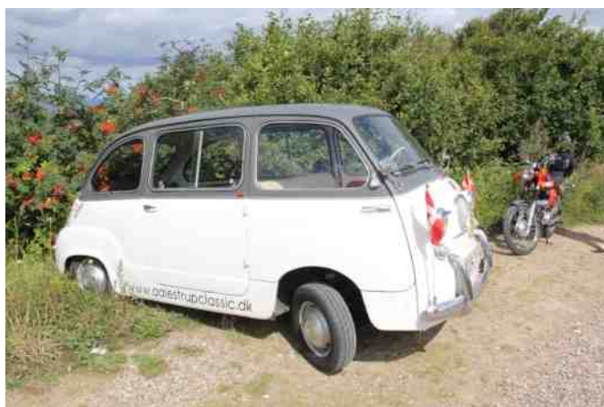
Multiplaen blev forsøgt "skjult" i buskadsset, men det lykkedes ikke helt. Jeg siger ikke hvem der forsøgte at "skjule" den. ☺

Hjemturen foregik i mindre grupper, alt efter hvornår man ville retur igen.