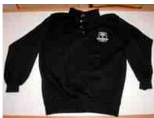
Trøje: 160,- kr.

Udvalget kan købes i klubben eller hos Jens Lund - 98 64 19 72.