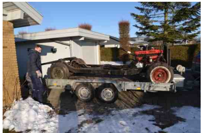
Billede af undervognen, der kommer hjem igen.