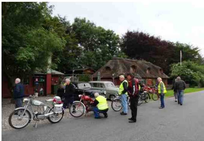
Billede fra 50cc tur fra Hvalpsund den 3 juli 2013.

Der været gode ture fra Løgstør, Hvalpsund, Fur og Aalestrup. Vi i knallertafdelingen kunne dog godt ønske nogle flere ture sammen med bilerne, så tænk over det, når I laver køreture. Der har været super flot deltagelse på turene med ca. 10-15 stk. hver gang.