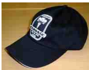
Cap: 80,- kr.