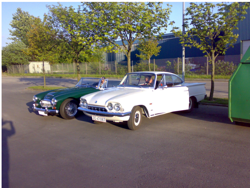
Opmarch efter årets første køretur.