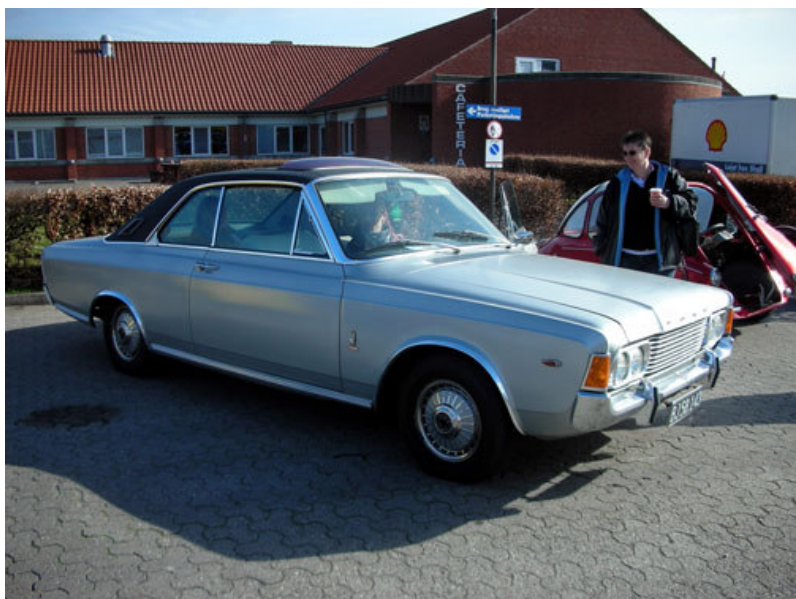
Redaktørens frue får sig en kop kaffe ved Shell i Støvring inden turen går videre til Karolinelund.